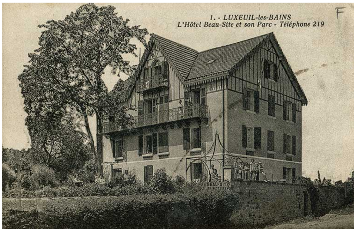
Vue datant du premier quart du 20e siècle. 70, Luxeuil-les-Bains, 18 rue Roger Moulinard