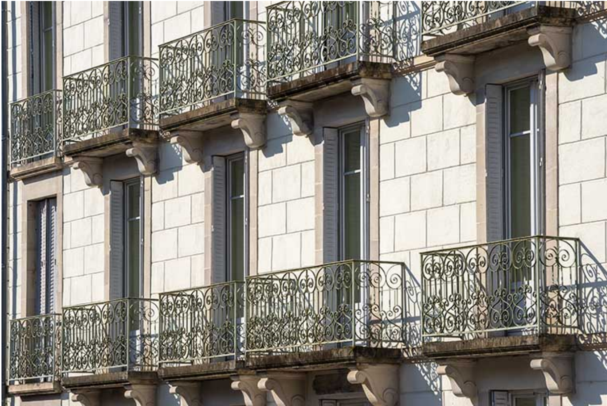
Façade sur rue de l'aile sud, détail : balcons. 70, Luxeuil-les-Bains, 2 avenue Jean Moulin