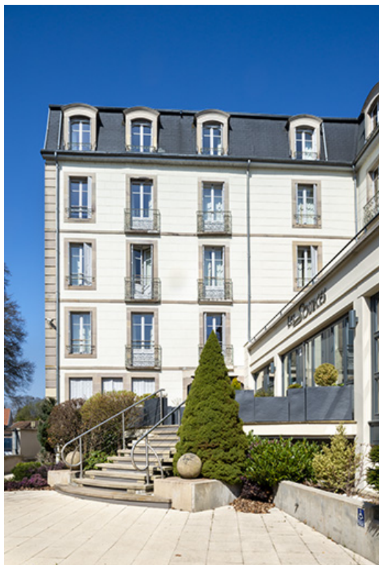
Façade sur parc de l'aile nord.

70, Luxeuil-les-Bains, 2 avenue Jean Moulin