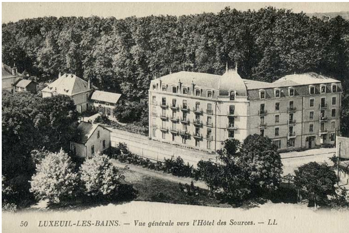
Vue d'ensemble depuis l'hôpital Grammont après la série de travaux achevés en 1914. 70, Luxeuil-les-Bains, 2 avenue Jean Moulin