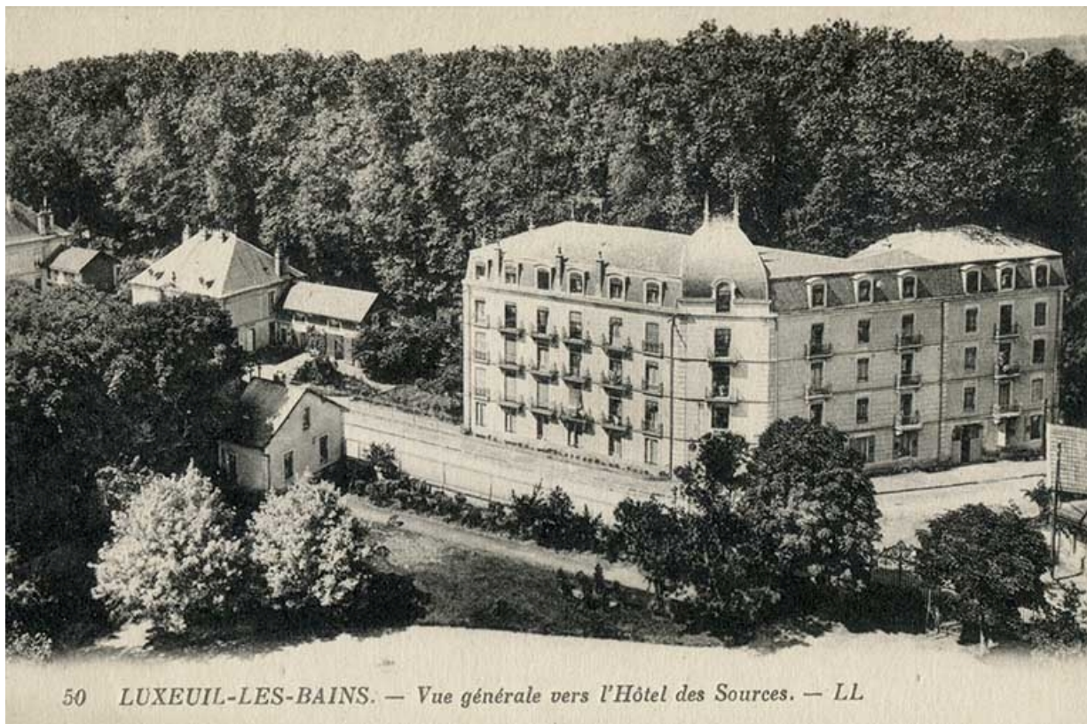
Vue d'ensemble depuis l'hôpital Grammont après la série de travaux achevés en 1914. 70, Luxeuil-les-Bains, 2 avenue Jean Moulin