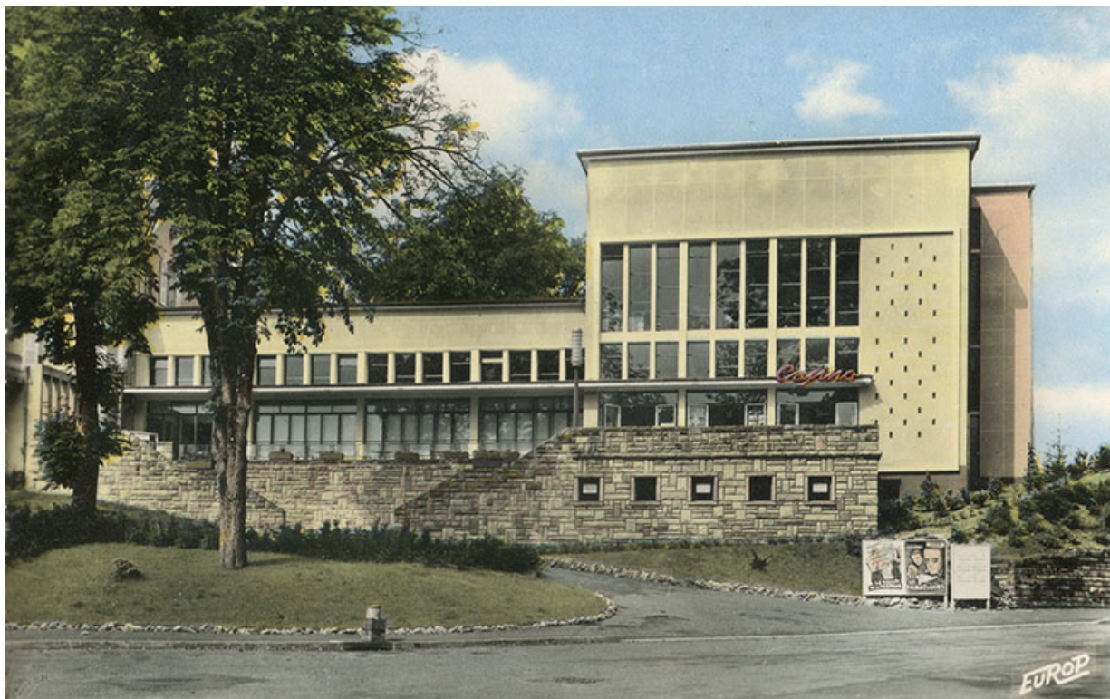
Salle des fêtes, vue ancienne (troisième quart du 20e siècle).

70, Luxeuil-les-Bains, 16 rue de la Saline