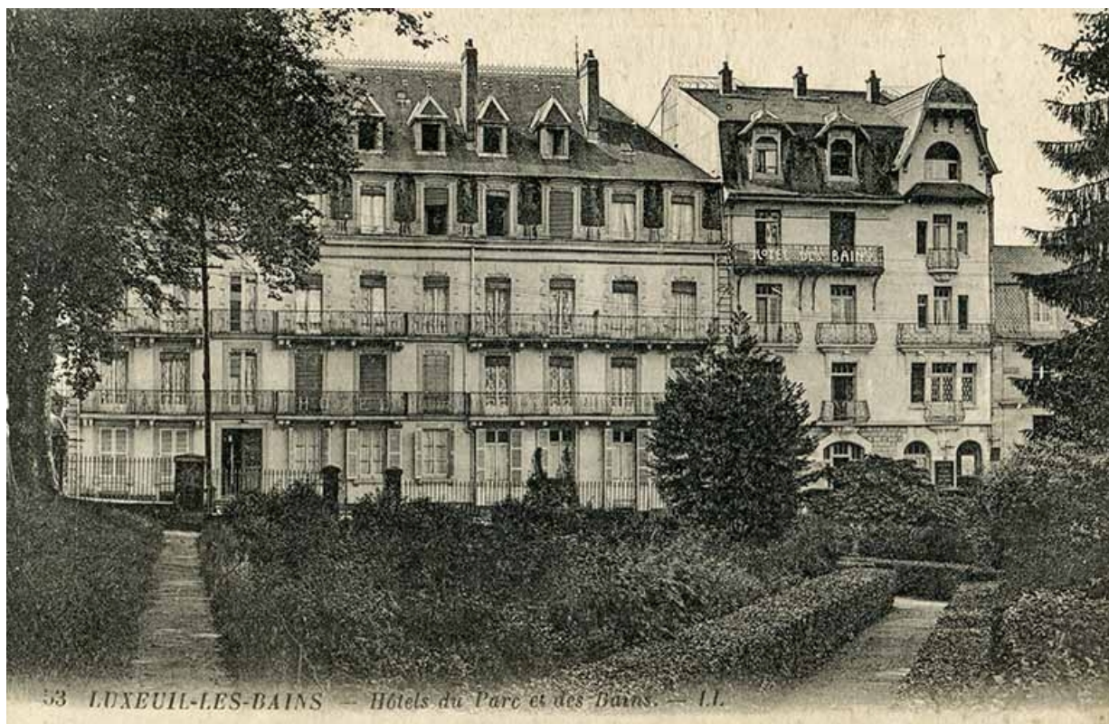
Façade nord, vue depuis le parc thermal au-delà de la rue des Thermes.

70, Luxeuil-les-Bains, 6 rue des Thermes