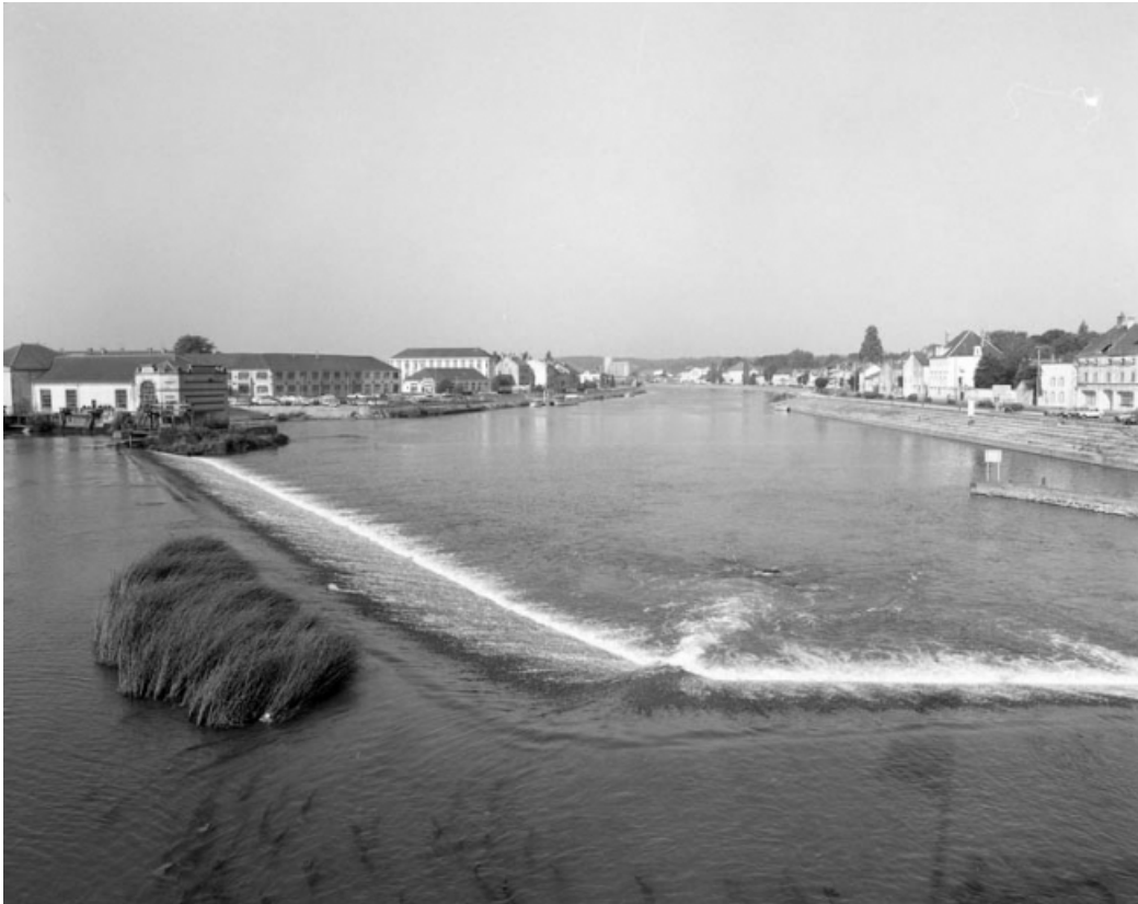
Les quais Mavia et Villeneuve depuis le barrage.