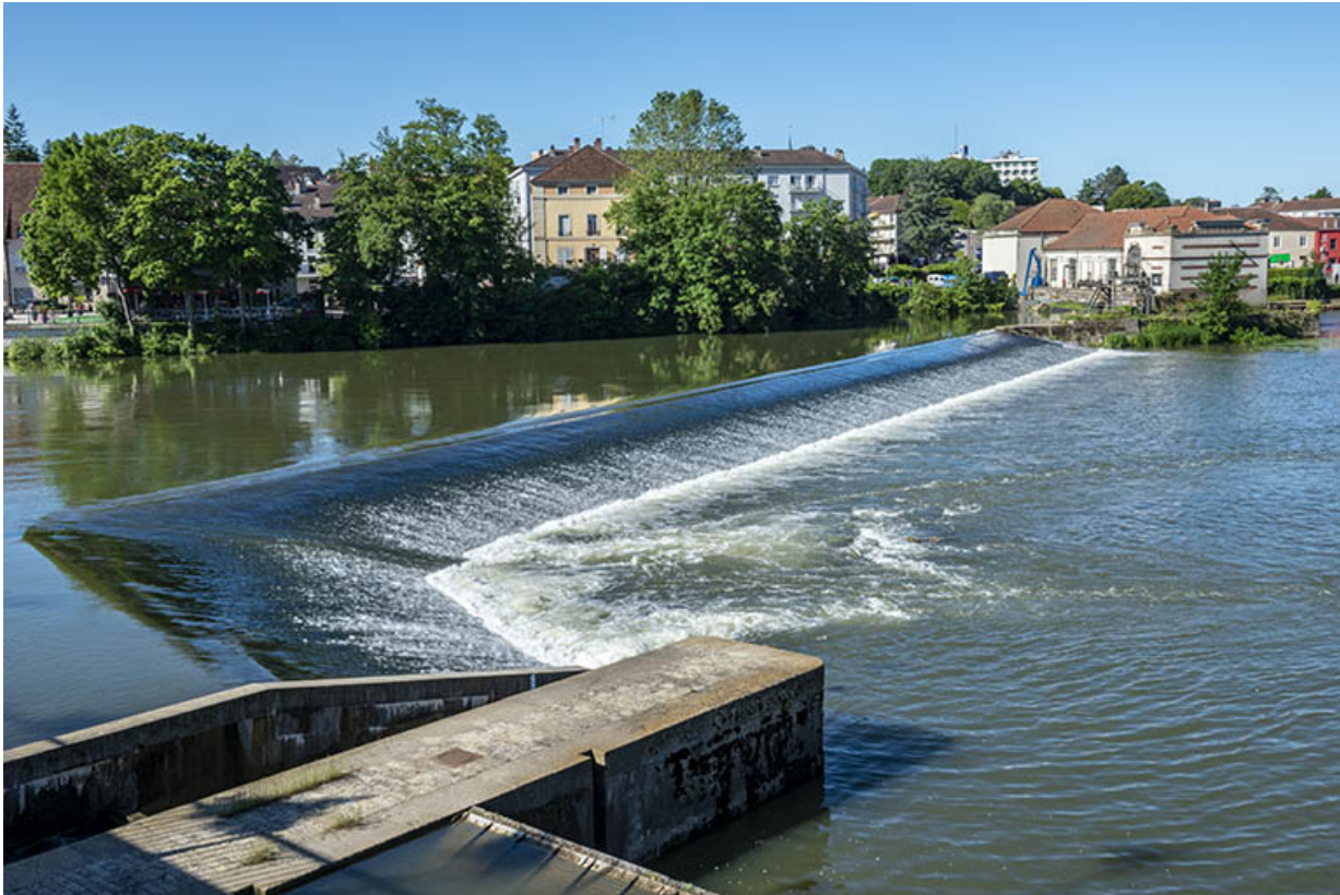
Le déversoir en aval du pont de Gray.