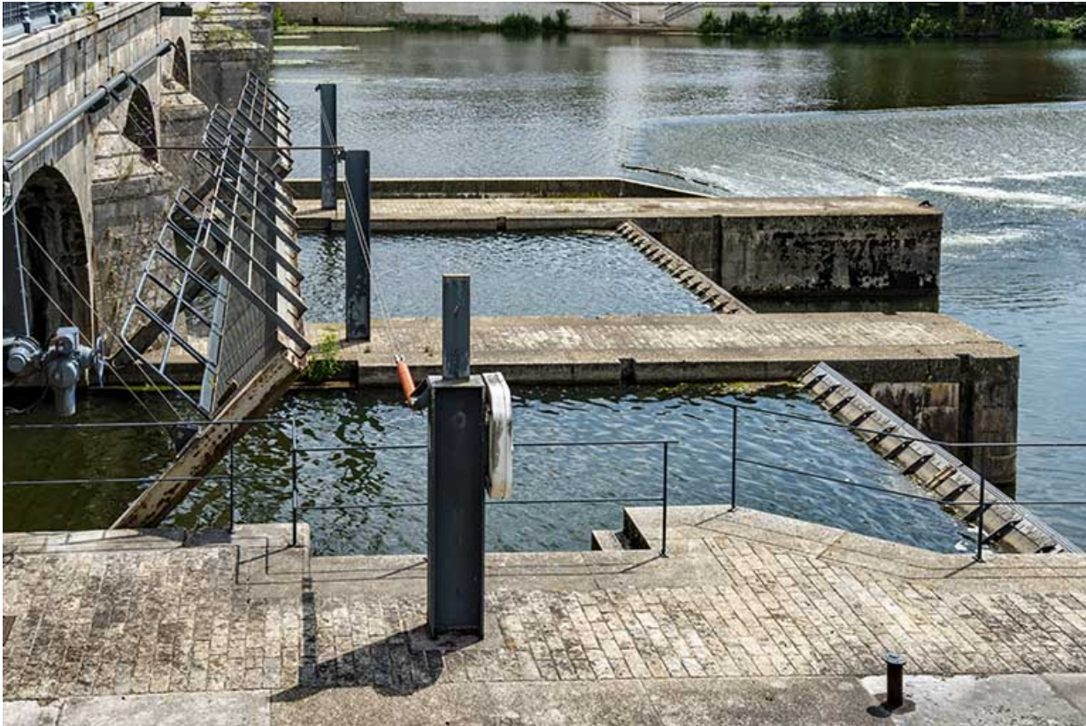
La partie mobile du barrage de Gray.