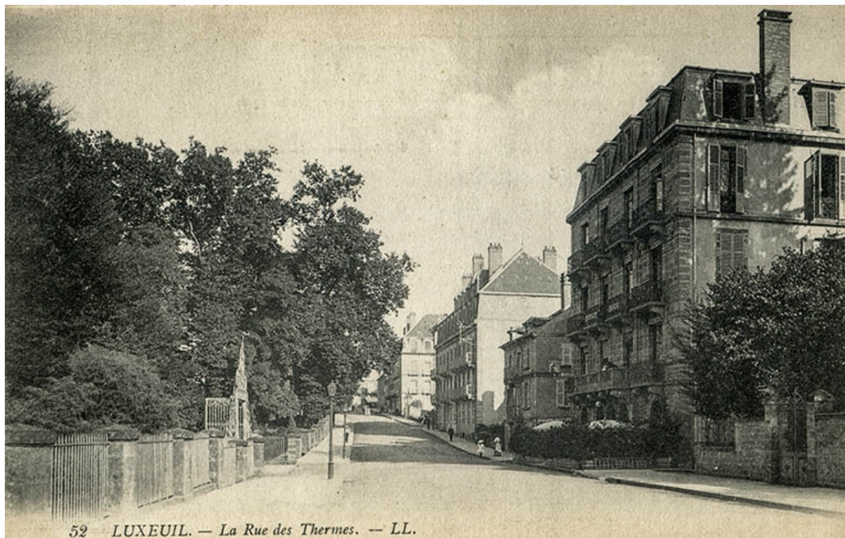
Rue des Thermes, vue en direction de l'est.