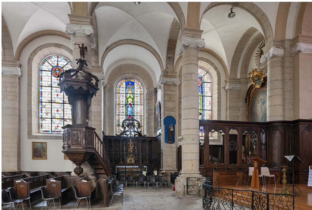
La chaire à prêcher, le croisillon nord du transept et la travée droite du chœur. 70, Jussey, 8 rue Charles Bontemps