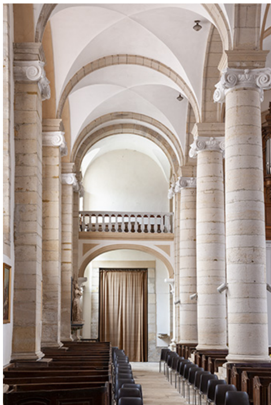
Le collatéral droit depuis le transept.