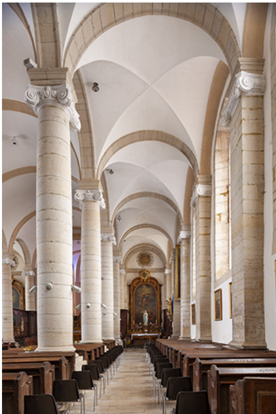
Le collatéral droit depuis l'entrée.