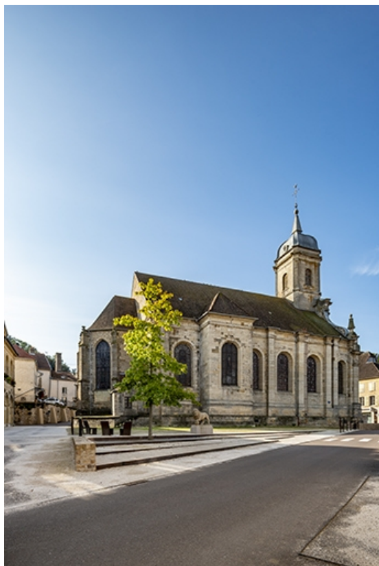
La nef, le transept et le chevet de trois quarts arrière gauche.