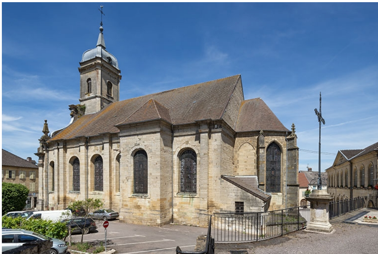
Nef, le transept et le chevet de trois quarts arrière droit.