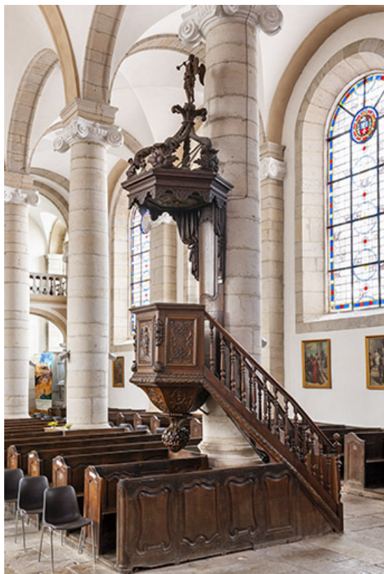
La chaire à prêcher depuis le chœur.