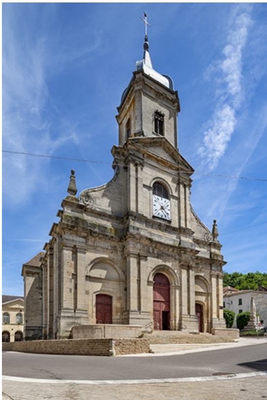
Façade antérieure de trois quart gauche.