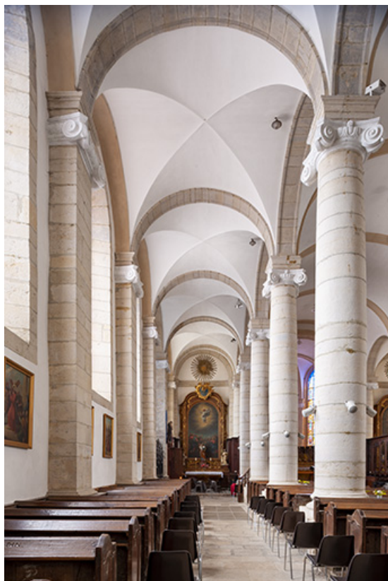
Le collatéral gauche depuis l'entrée.