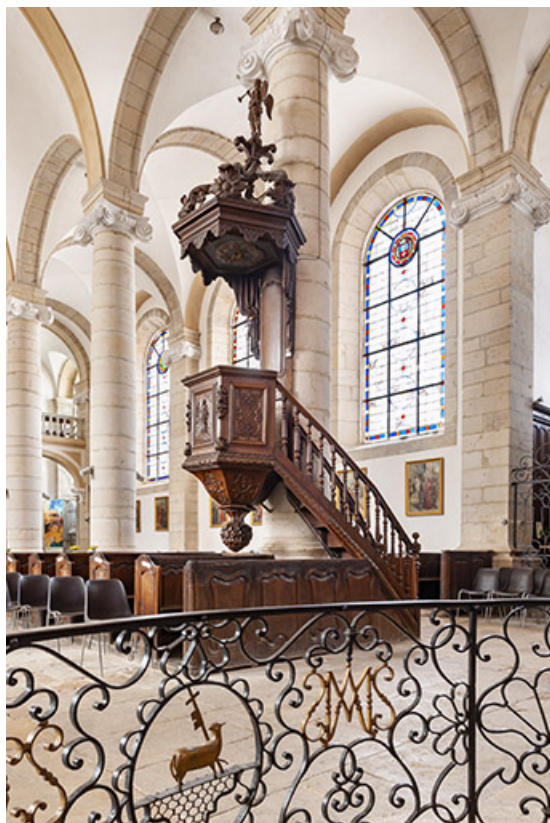
La chaire à prêcher et la grille de chœur depuis le chœur.