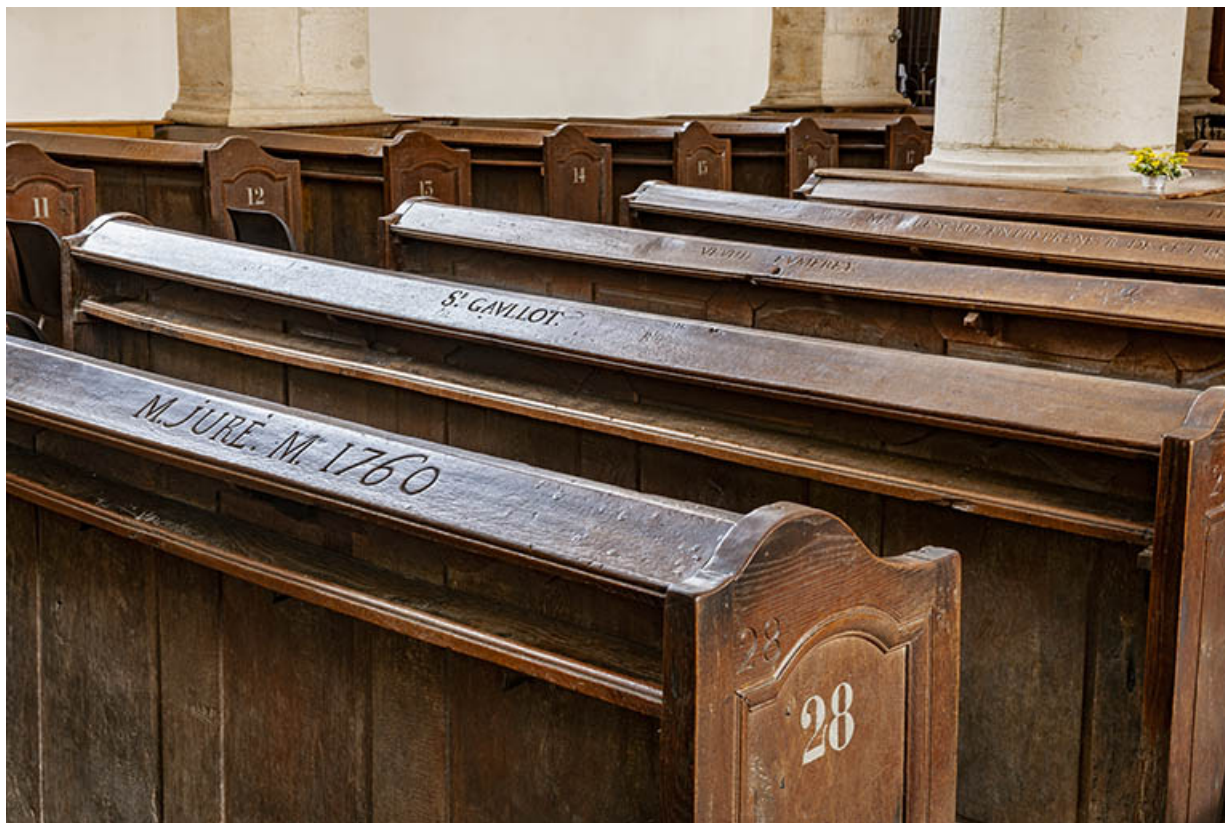
Les bancs de fidèles numérotés et gravés, de trois quarts.