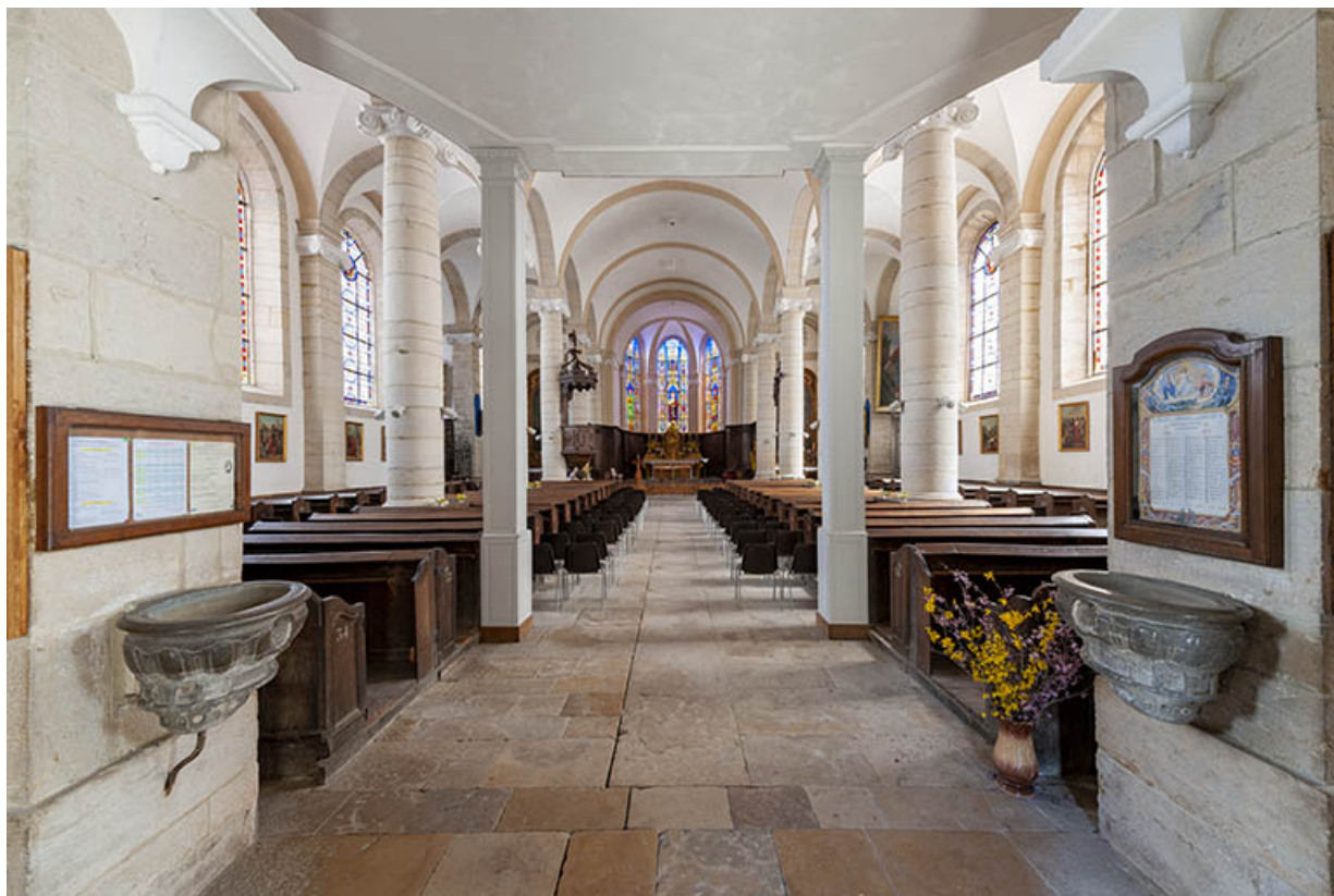
L'intérieur depuis l'entrée.