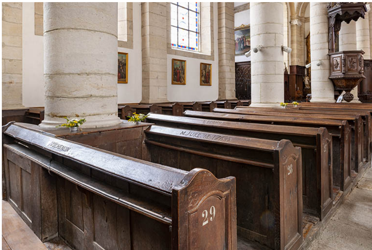
Les bancs de fidèles numérotés et gravés, de trois quarts.