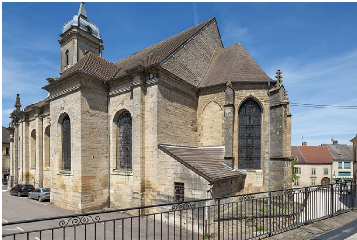
Le chevet et le transept de trois quarts arrière droit.