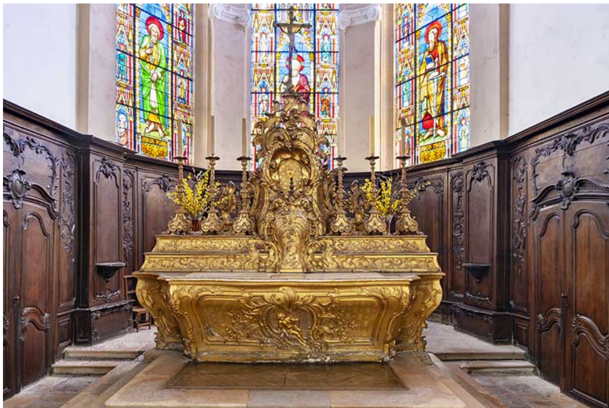
L'autel et la boiserie du chœur, de face.