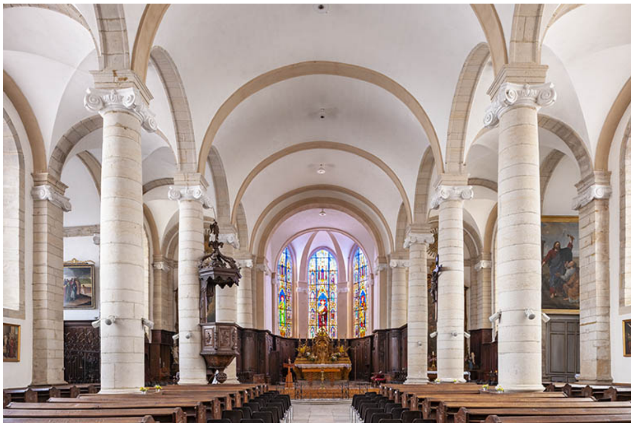
L'ensemble de l'intérieur, depuis le vaisseau central de la nef.