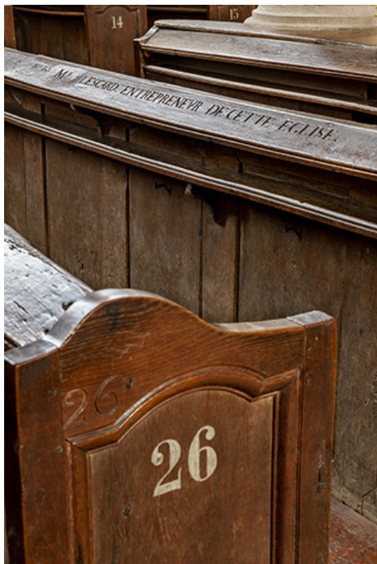
Détail d'un des bancs de fidèles numérotés et gravés.