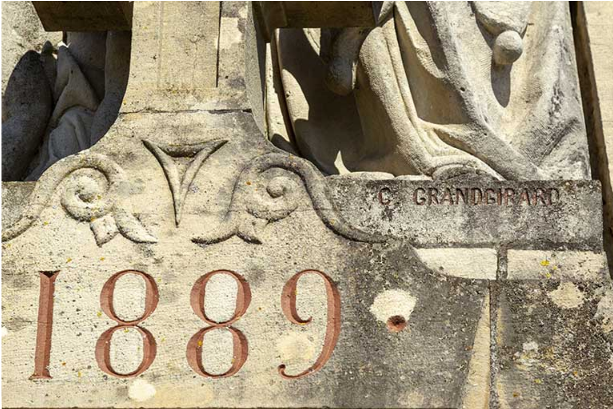
Vue de détail des inscriptions sous la sculpture.