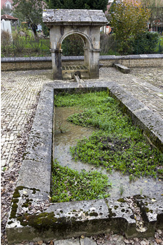
Lavoir et gorge servant à l'écoulement de l'eau. 70, Soing-Cubry-Charentenay, 4 rue de la Fontaine