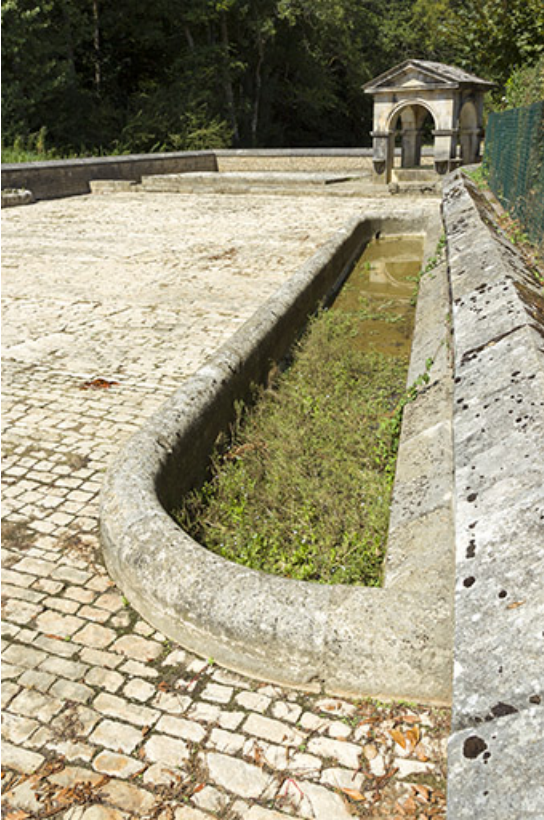
Abreuvoir adossé au mur sud de la place.

70, Soing-Cubry-Charentenay, 4 rue de la Fontaine