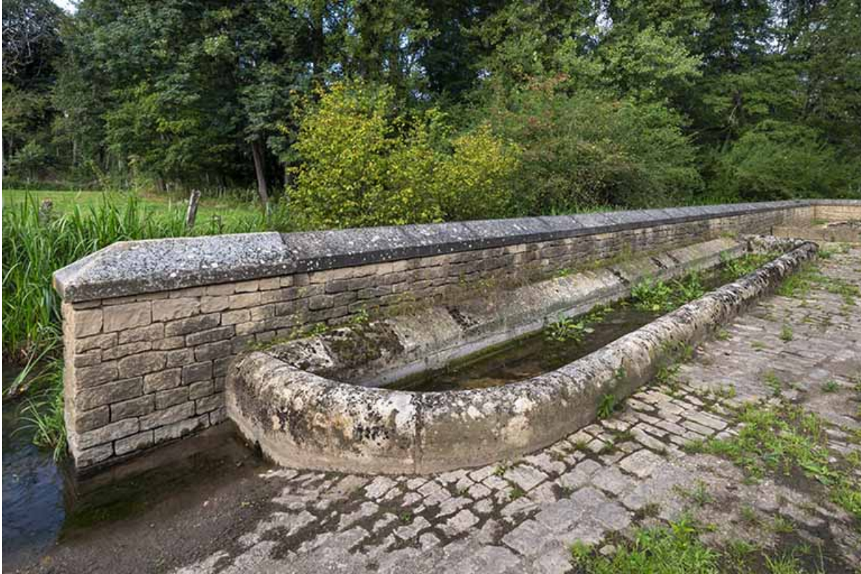
Abreuvoir adossé au mur nord de la place.

70, Soing-Cubry-Charentenay, 4 rue de la Fontaine