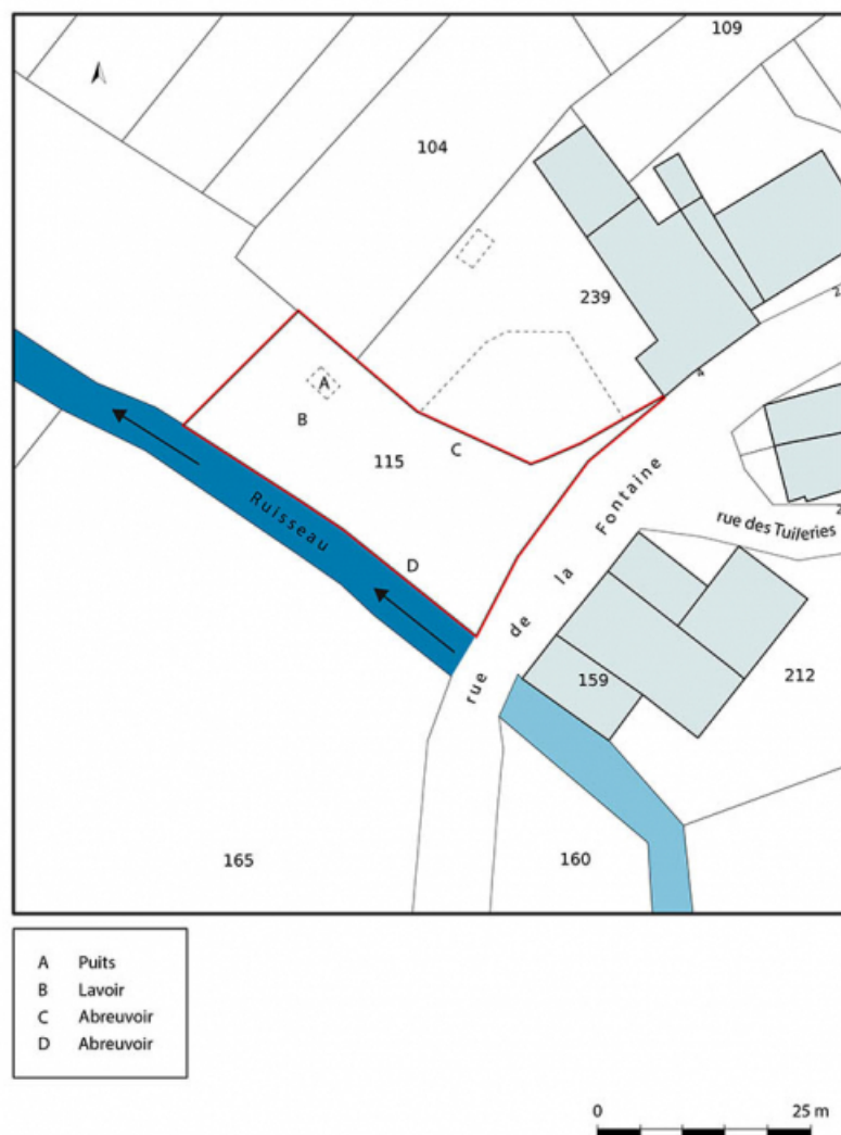
Plan-masse de la fontaine, lavoir, abreuvoir de Cubry-Lès-Soing. Extrait du plan cadastral numérisé, section AB, échelle 1/1000. 70, Soing-Cubry-Charentenay, 4 rue de la Fontaine