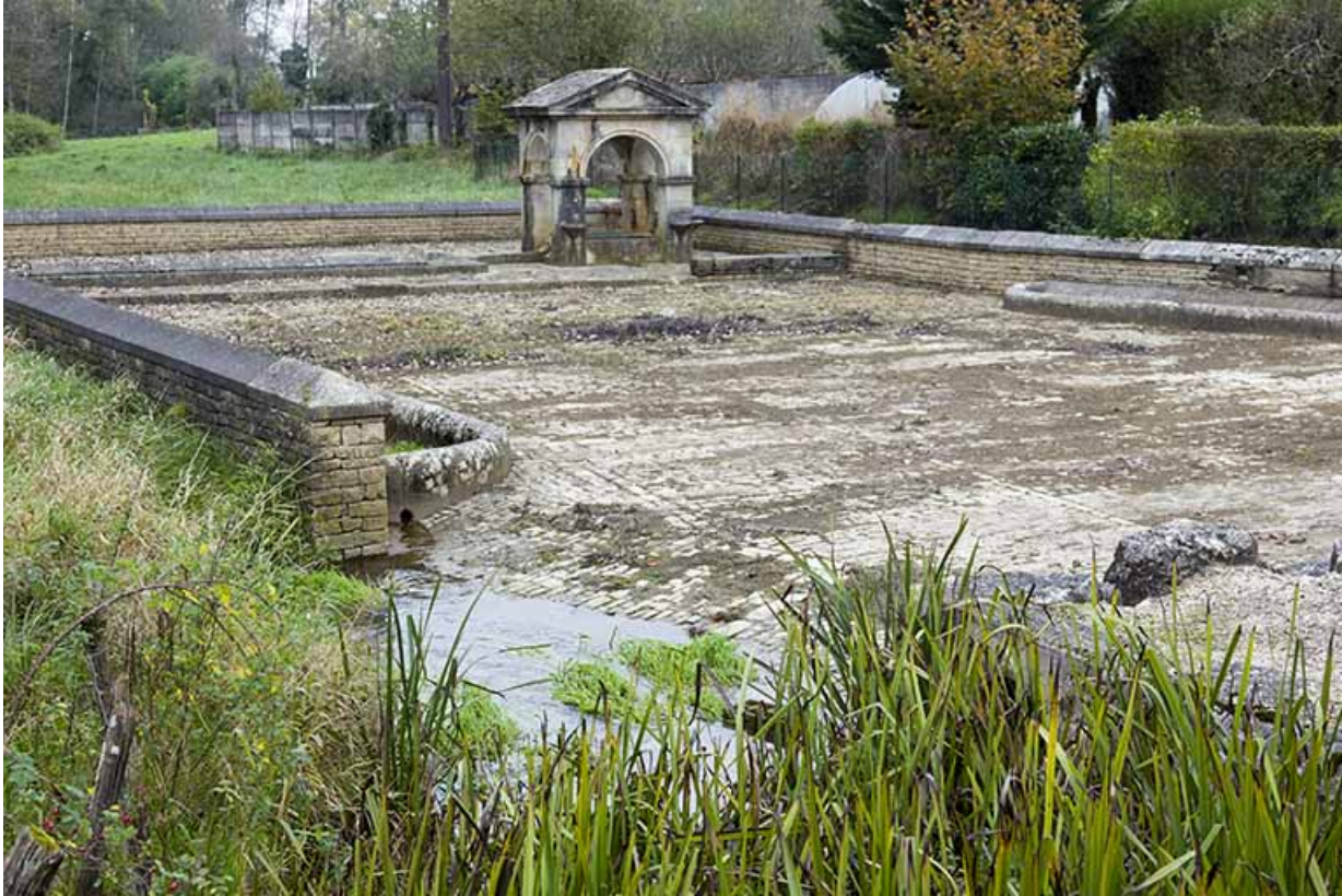
Place de la fontaine vue depuis le pont.

70, Soing-Cubry-Charentenay, 4 rue de la Fontaine