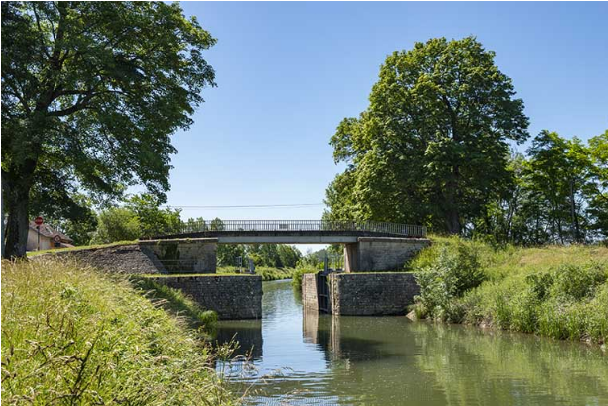
La porte de garde et le canal de navigation.