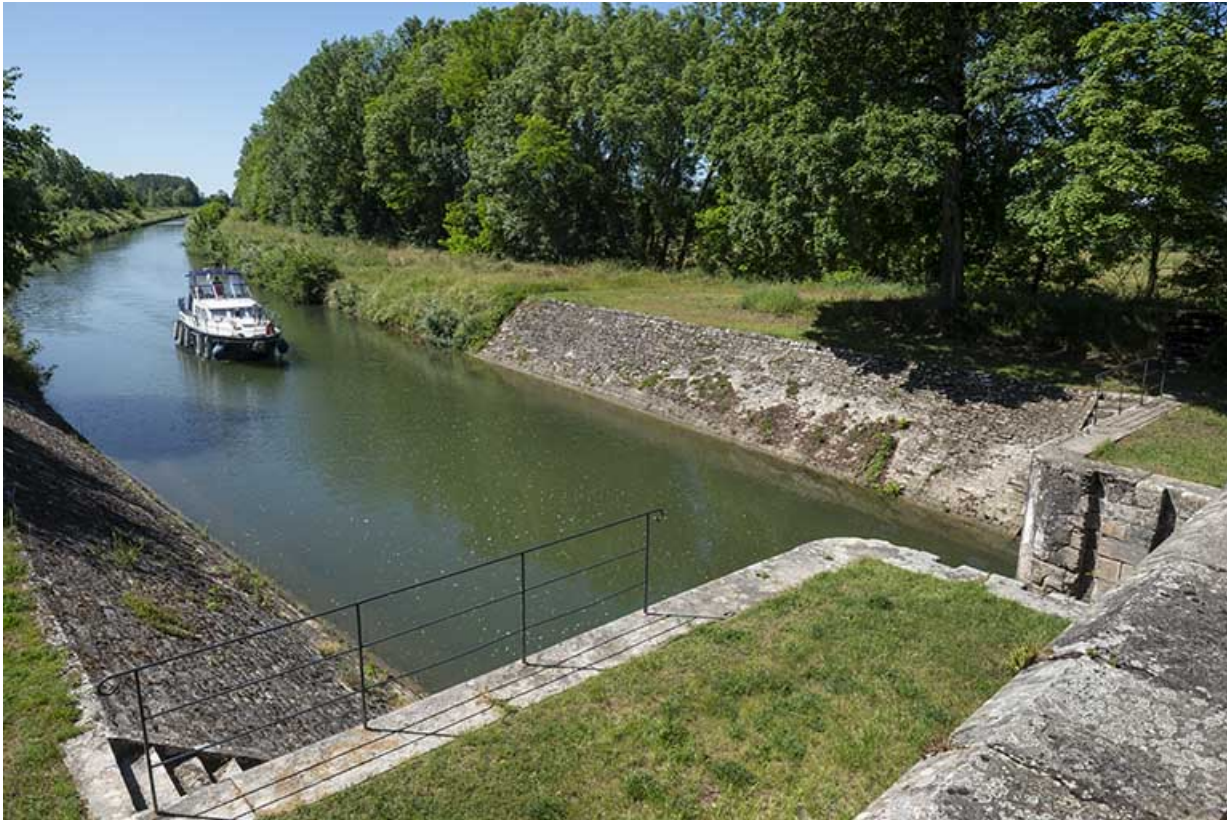
Bateau de plaisance en approche de la porte de garde.