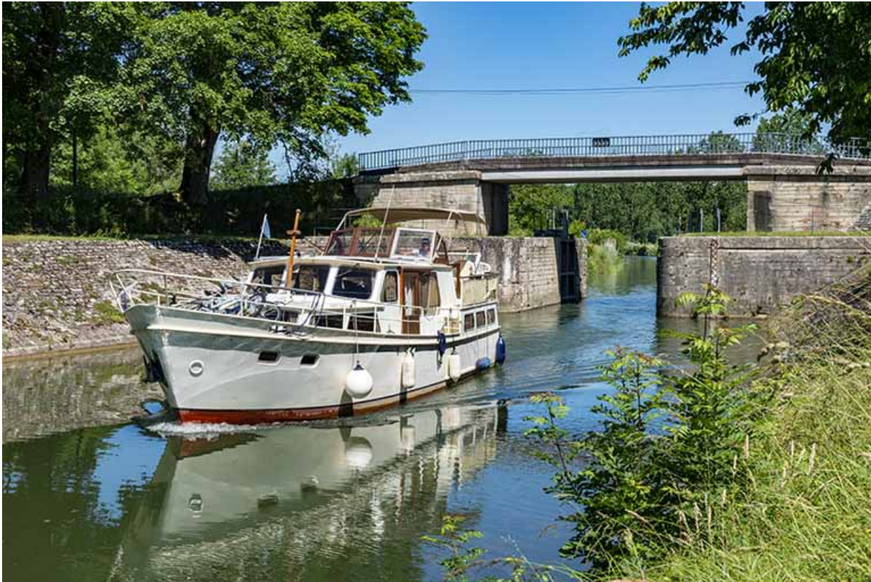
Bateau de plaisance et la porte en arrière-plan.