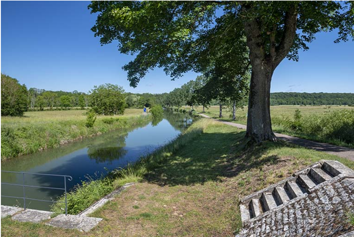
La dérivation et son canal.