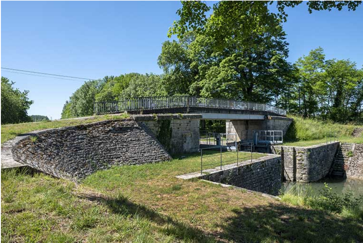
Vue de trois-quarts gauche.