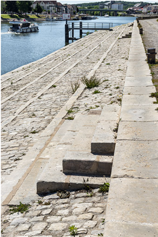
Marches pour remonter du quai vers la rue.