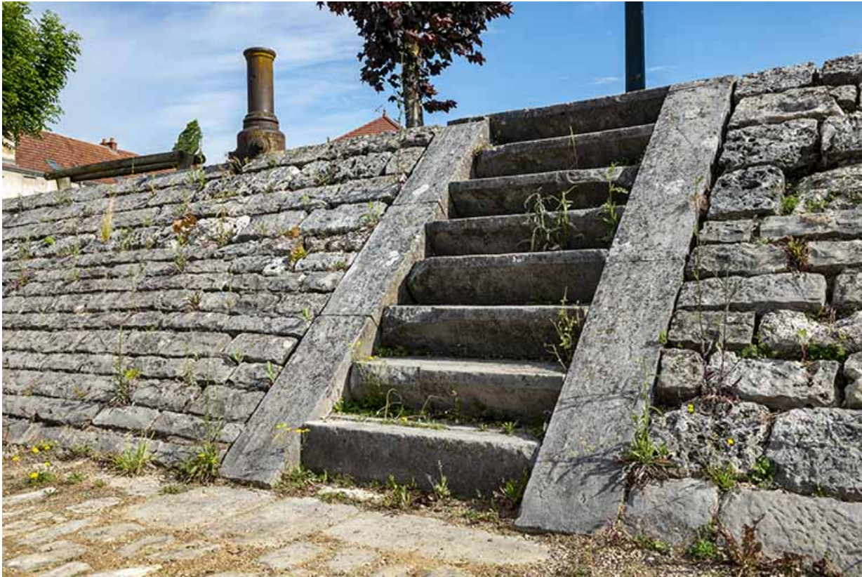
Marches pour accéder depuis le chemin de halage à la rue.