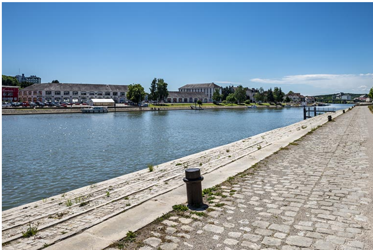
Quai Villeneuve au premier plan et celui de La Mavia sur la rive opposée.