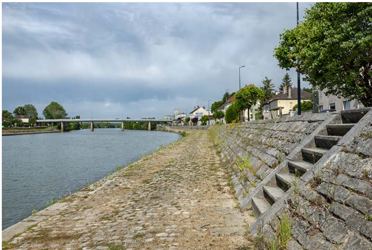
Le chemin de halage.