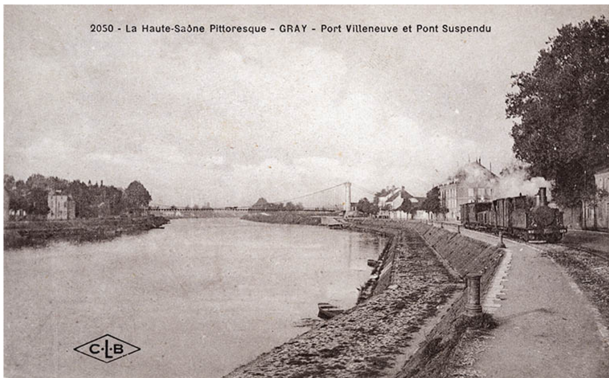
Prolongement du quai Villeneuve, carte postale.