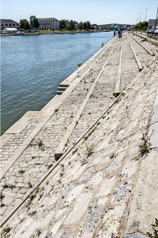
Détail de la maçonnerie du quai.