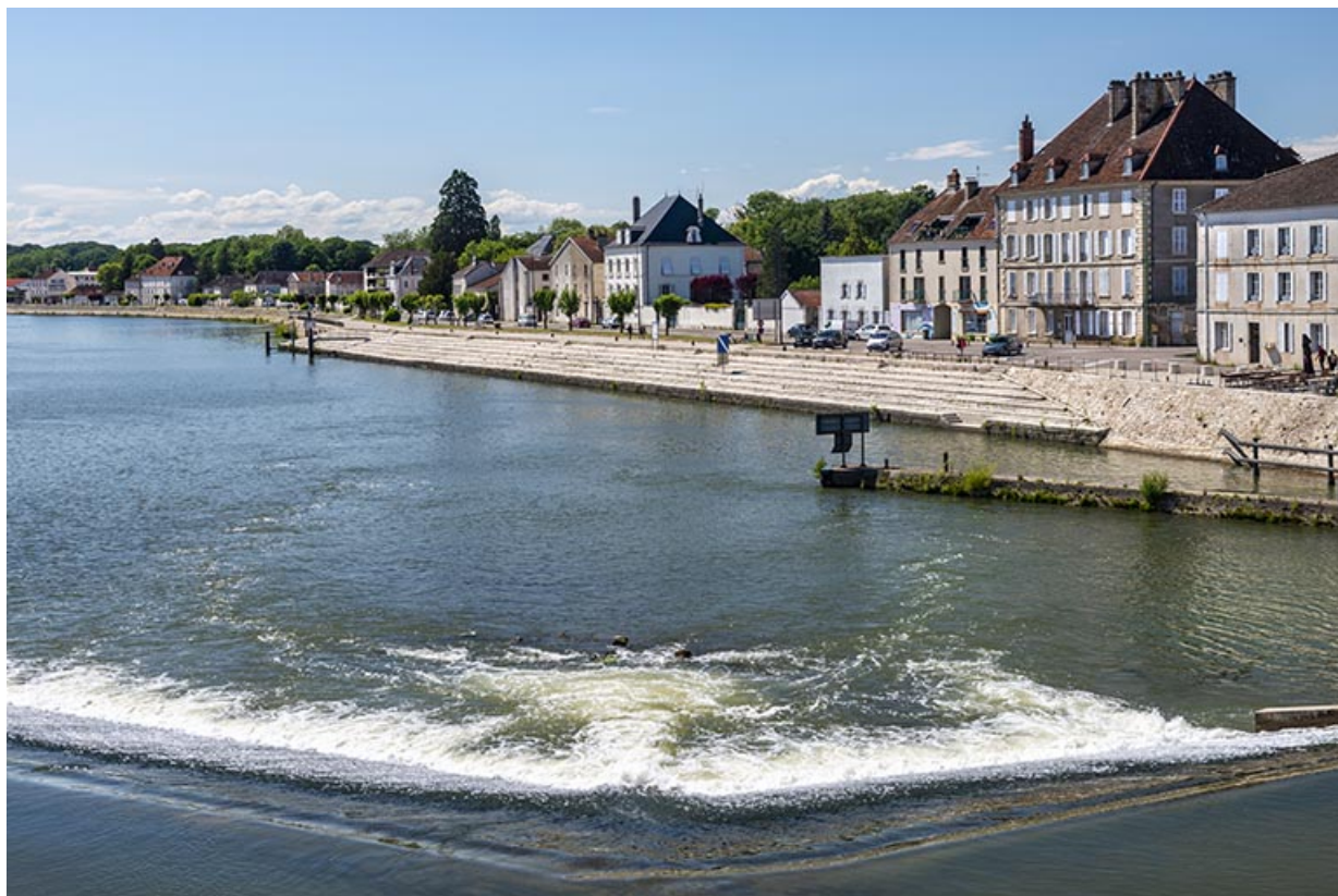
Vue générale du quai prise depuis le pont.