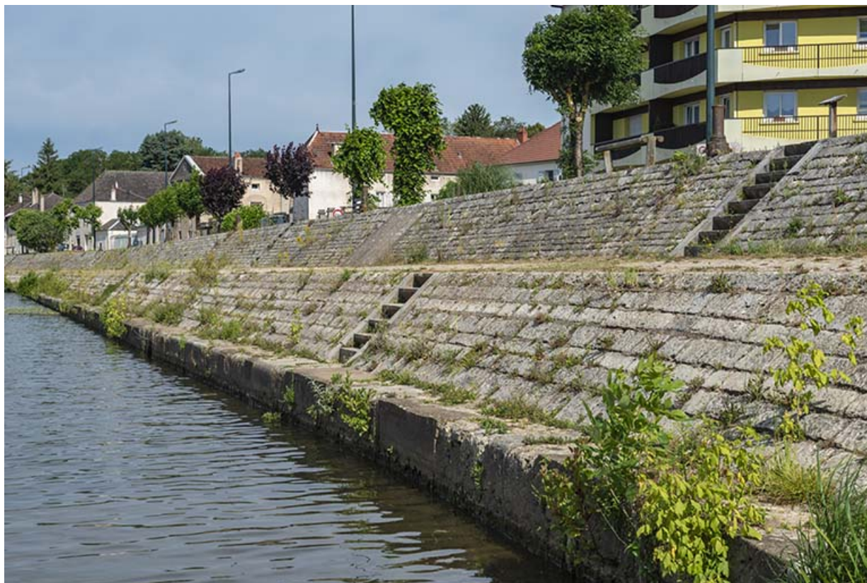
Prologement du quai Villeneuve.