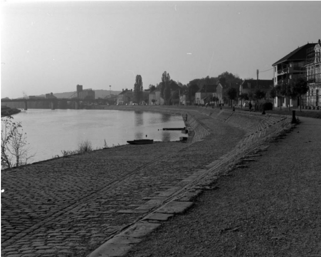
Vue d'ensemble du quai Villeneuve avec les silos en arrière-plan. 70, Gray