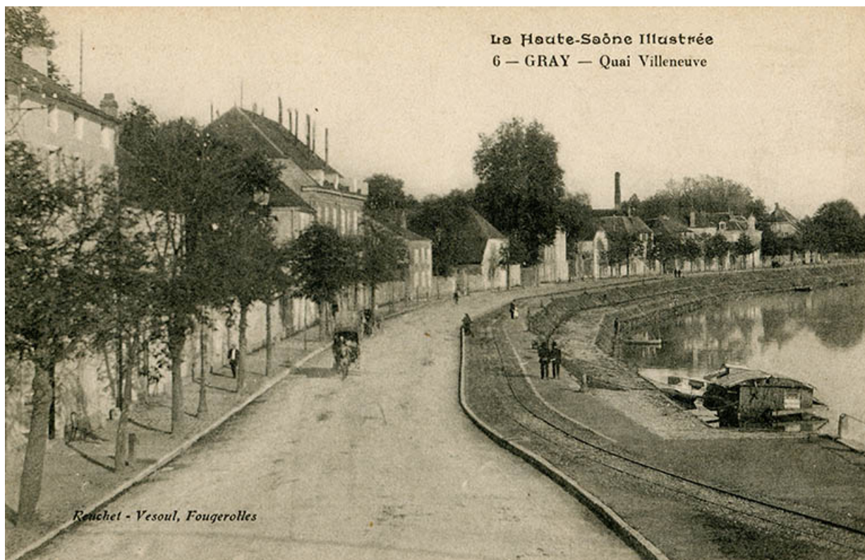
Gray- Quai Villeneuve, carte postale.