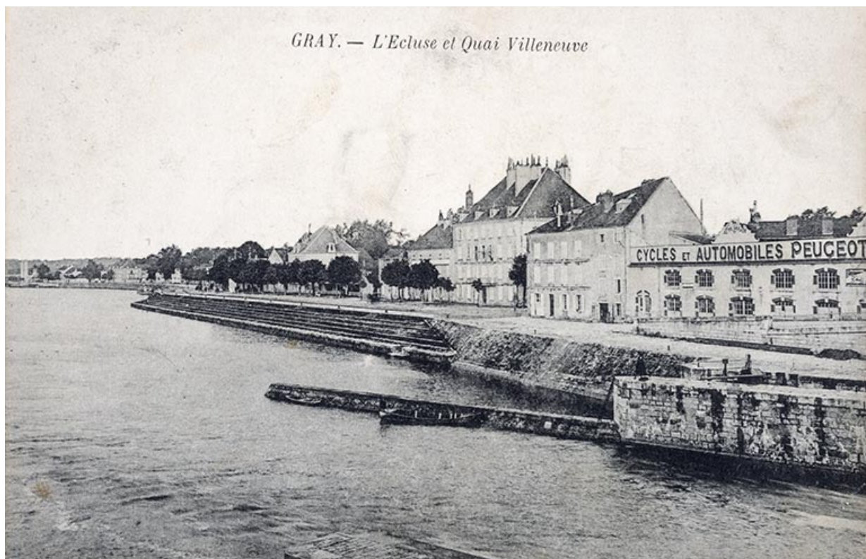
Gray. - L'écluse et quai Villeneuve, carte postale. 70, Gray quai Villeuve

Lieu de conservation : Archives départementales de la Haute-Saône, Vesoul - Cote du document : 11Fi279/79