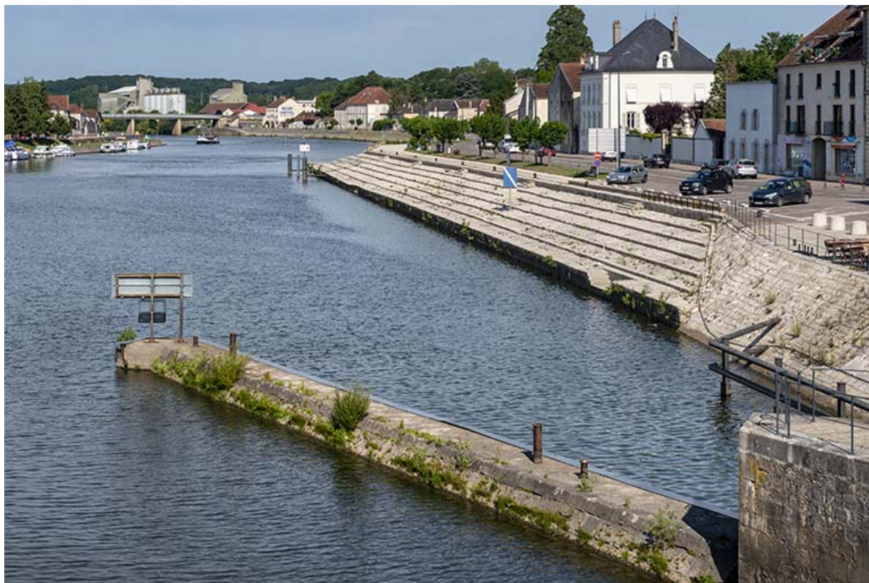
Le quai Villeneuve et ses gradins.