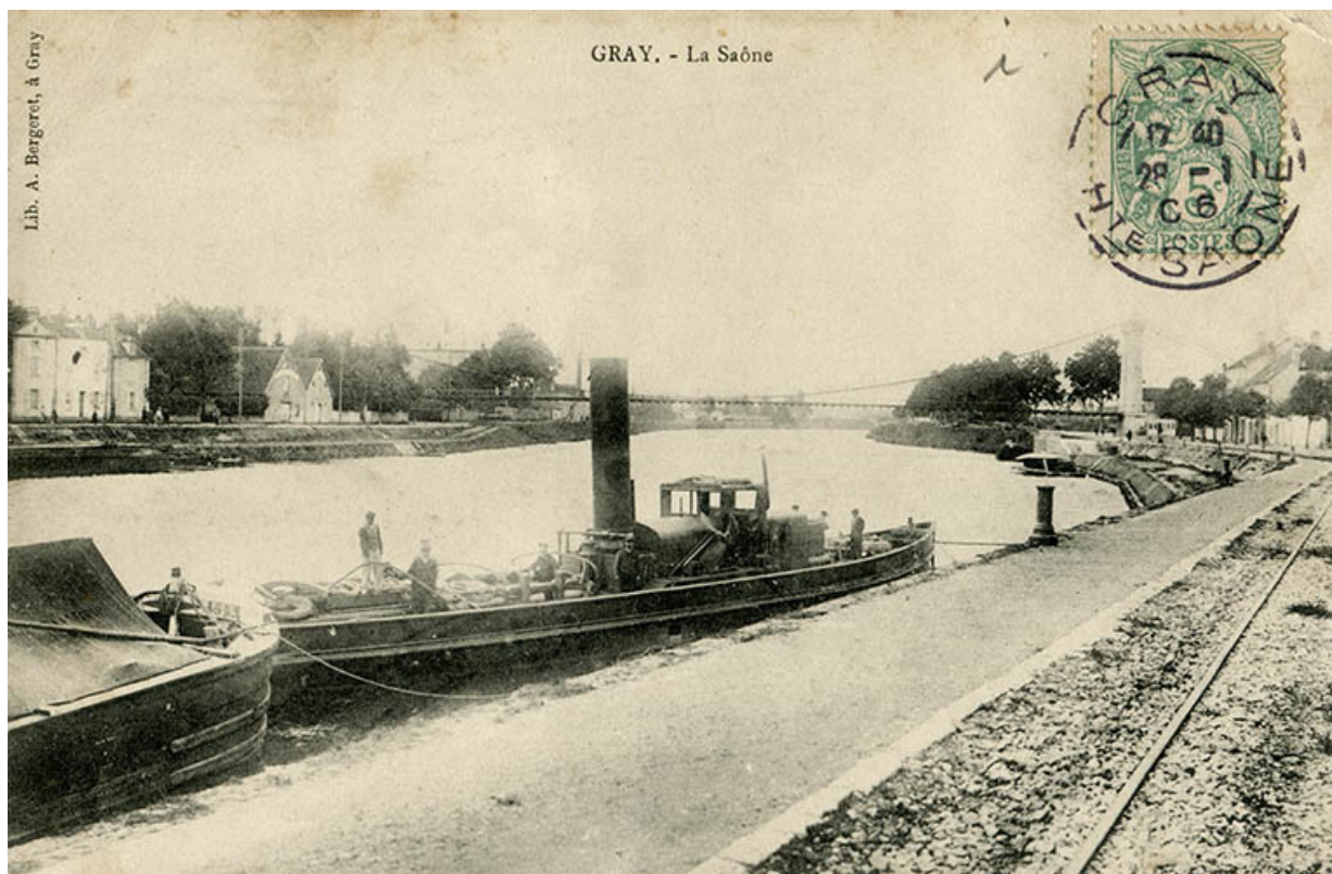
Gray - La Saône, carte postale.