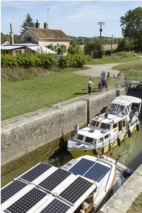
Bateaux en attente de franchir l'écluse.