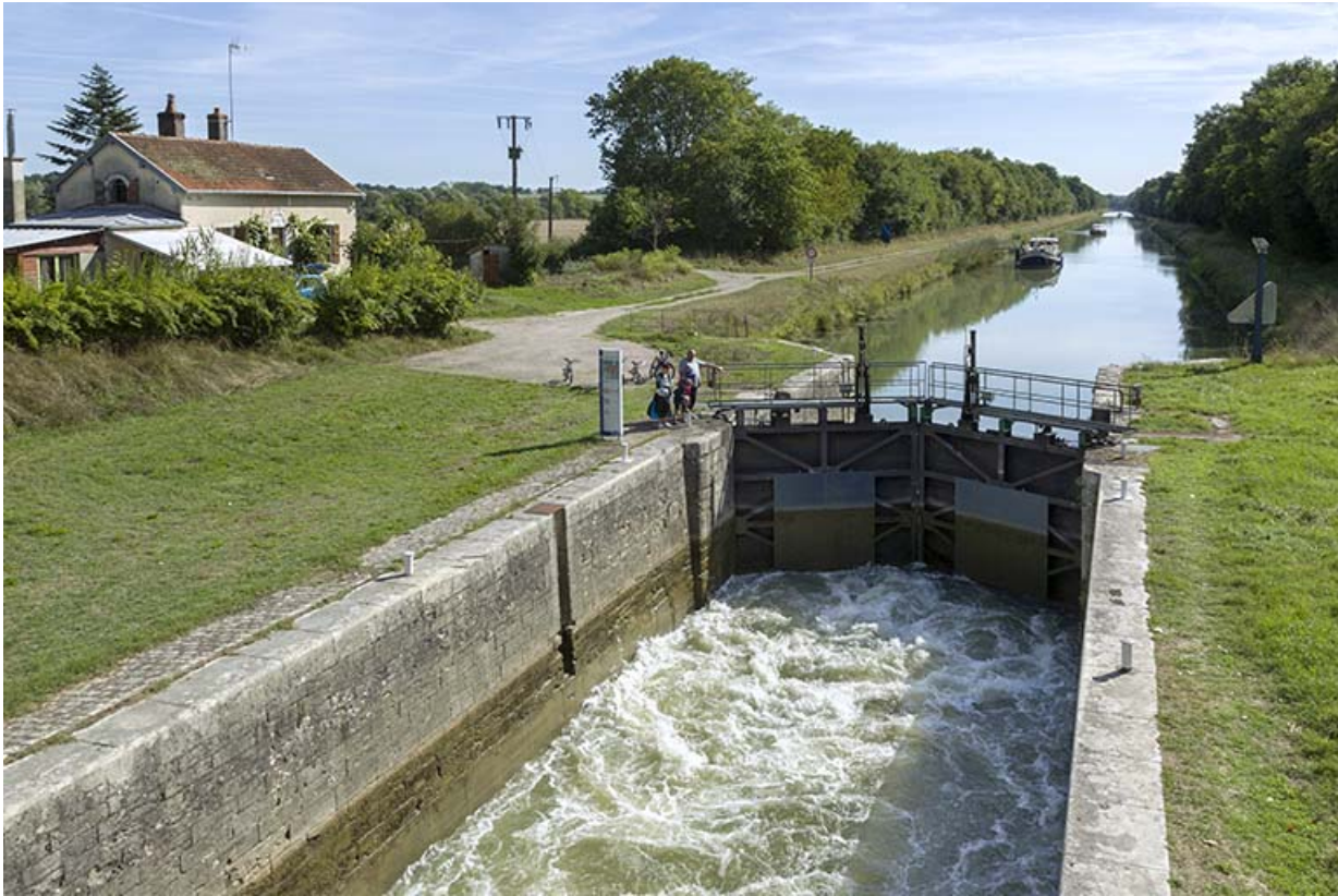
Le sas de l'écluse.