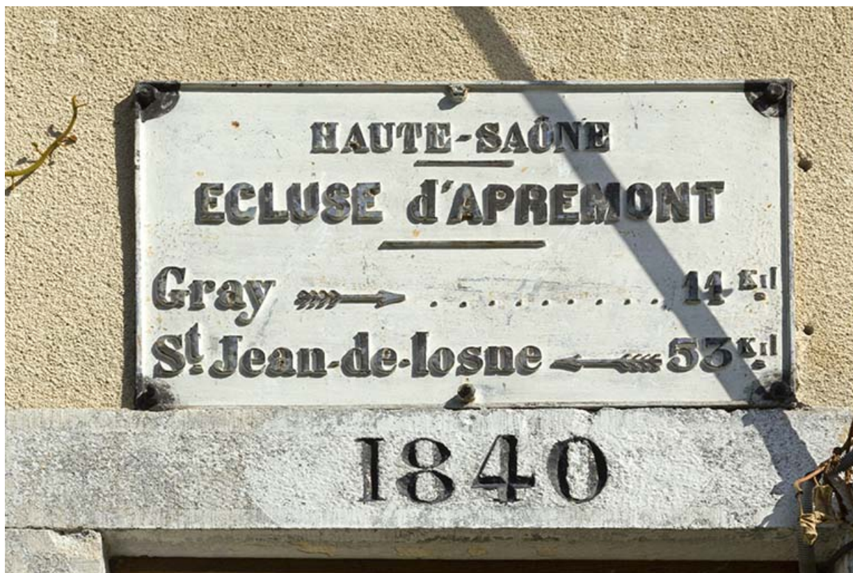
Plaque signalétique de l'écluse.