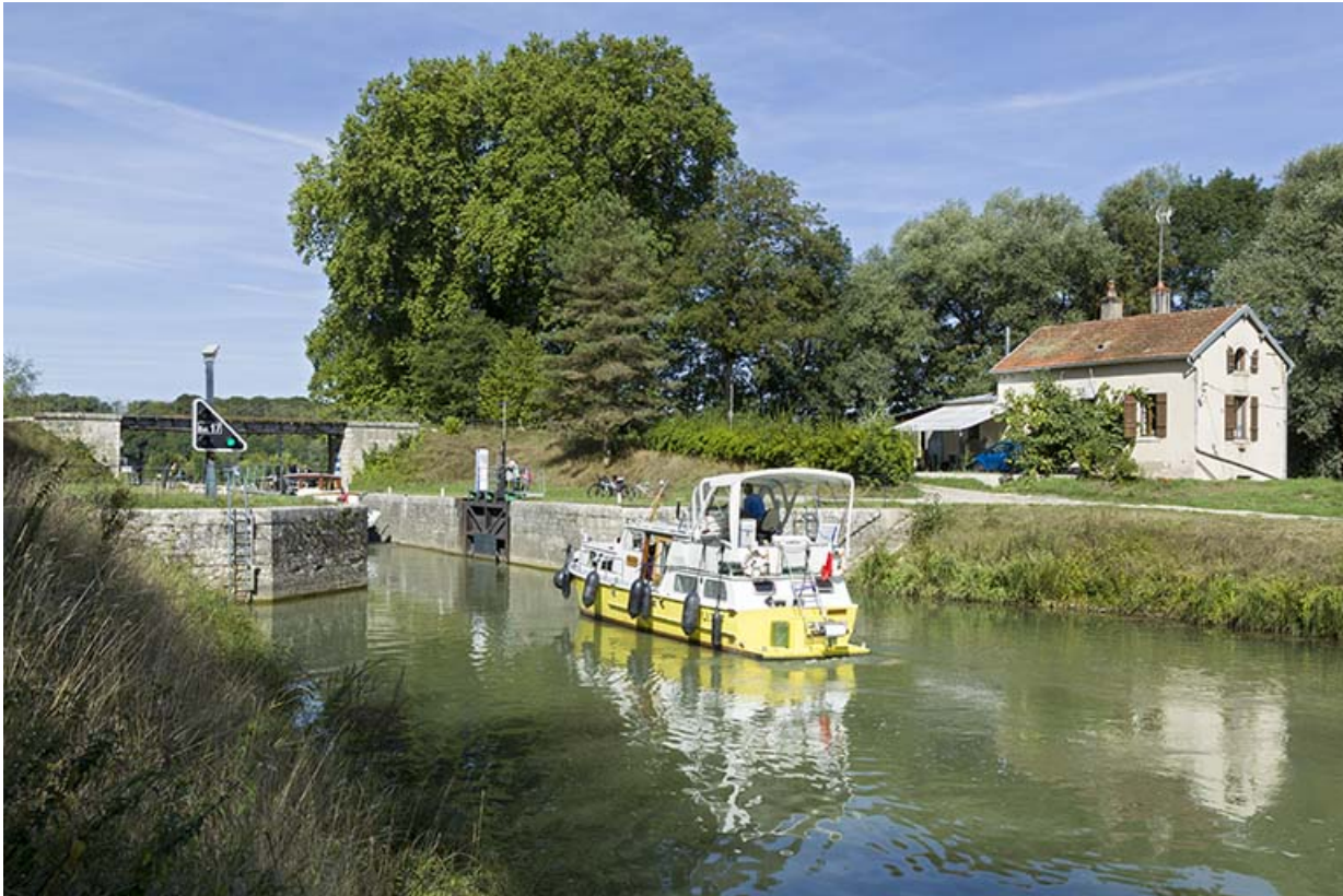
Vue générale depuis l'amont.