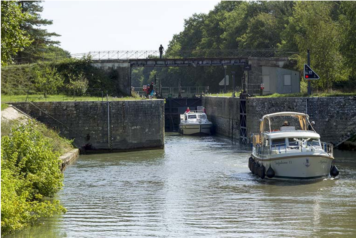
L'écluse depuis l'aval.