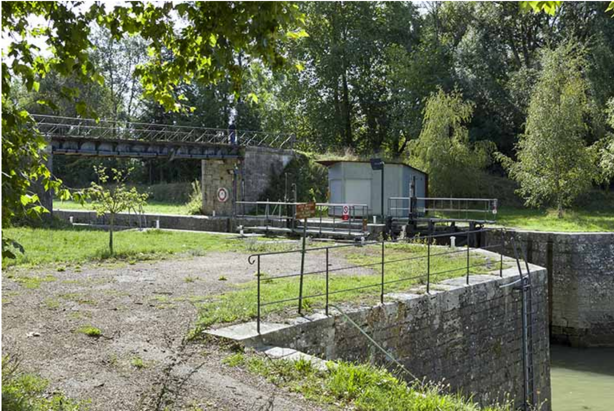
Le poste de commande de l'écluse.