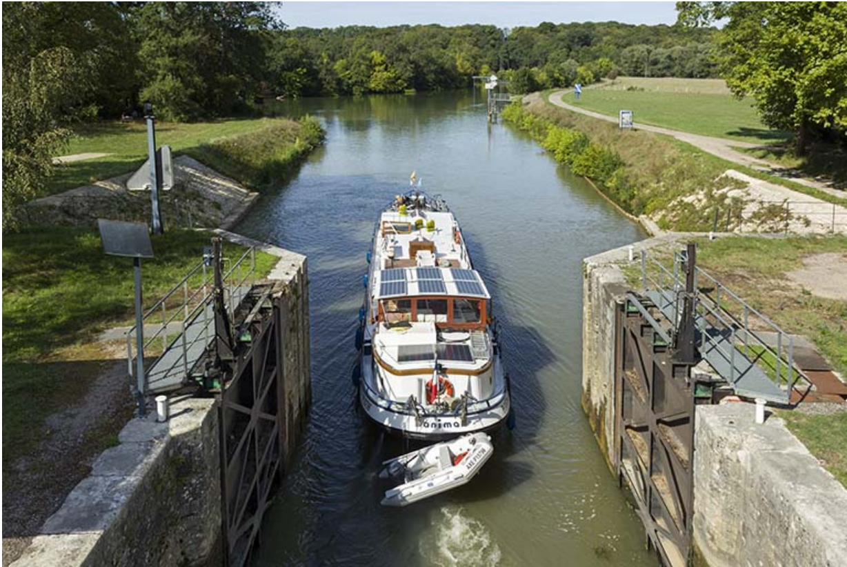
Bateau venant de franchir l'écluse.