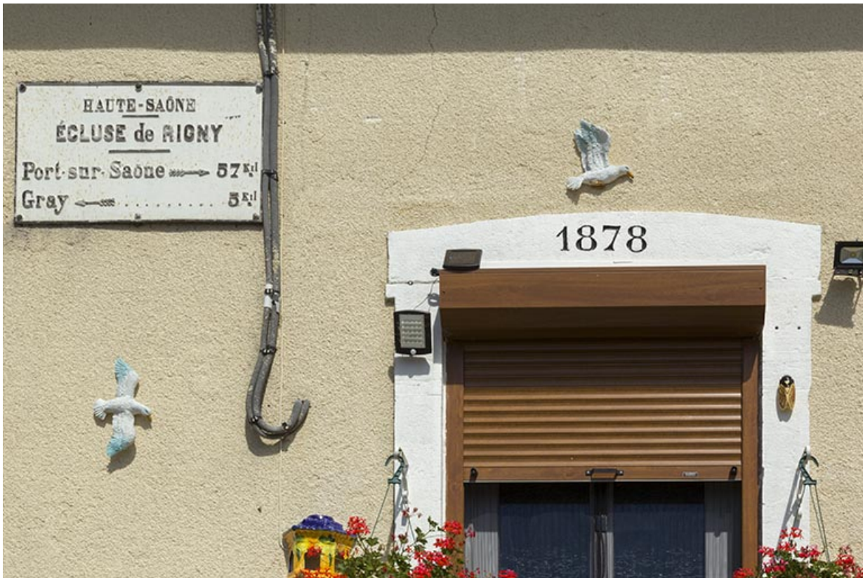
La plaque signalétique de la maison éclusière et la date portée sur le linteau de la porte d'entrée.