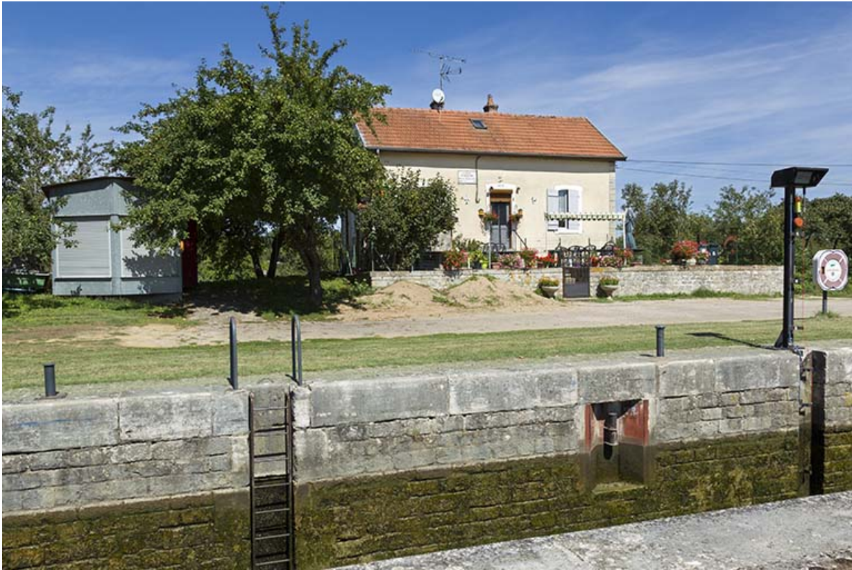
Le sas, la maison et le poste de commande de l'écluse de Rigny.