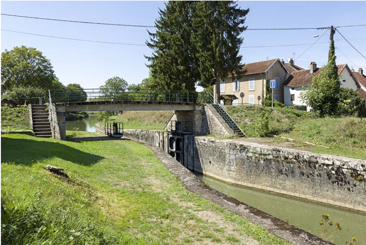
La porte de garde.