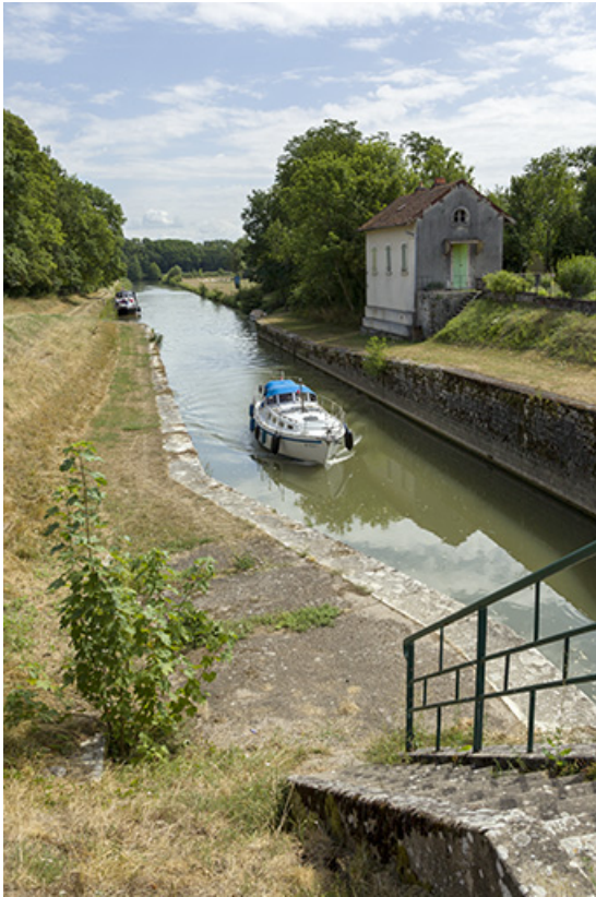
Bateau s'apprêtant à franchir la porte.