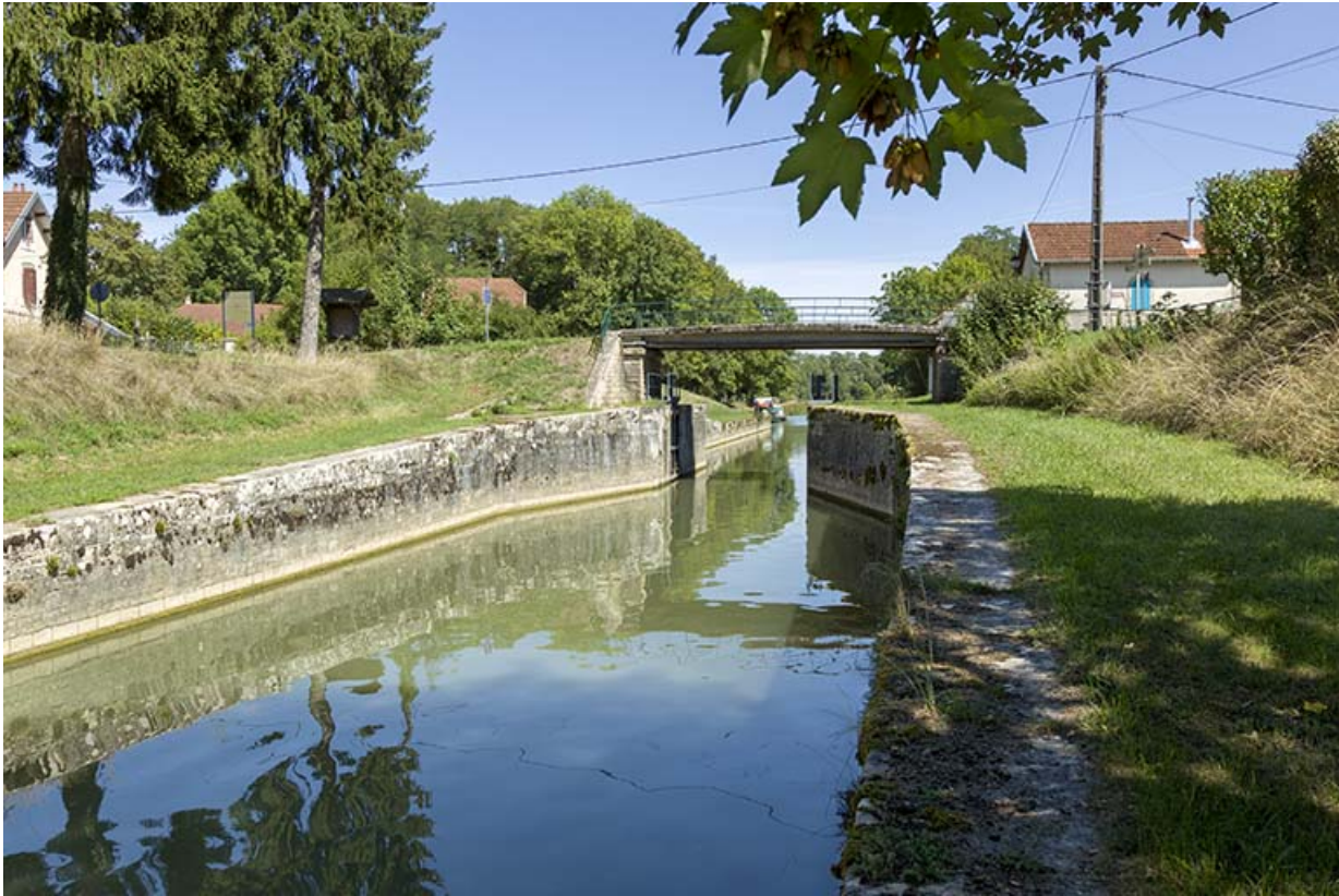
Vue depuis l'aval.