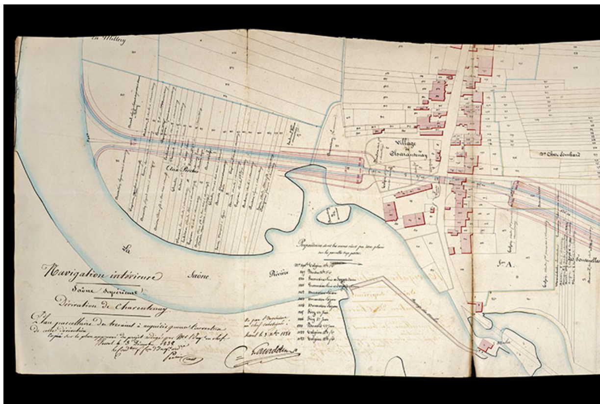
Détail de la dérivation au niveau de la future porte de garde et du pont tournant, 1838.