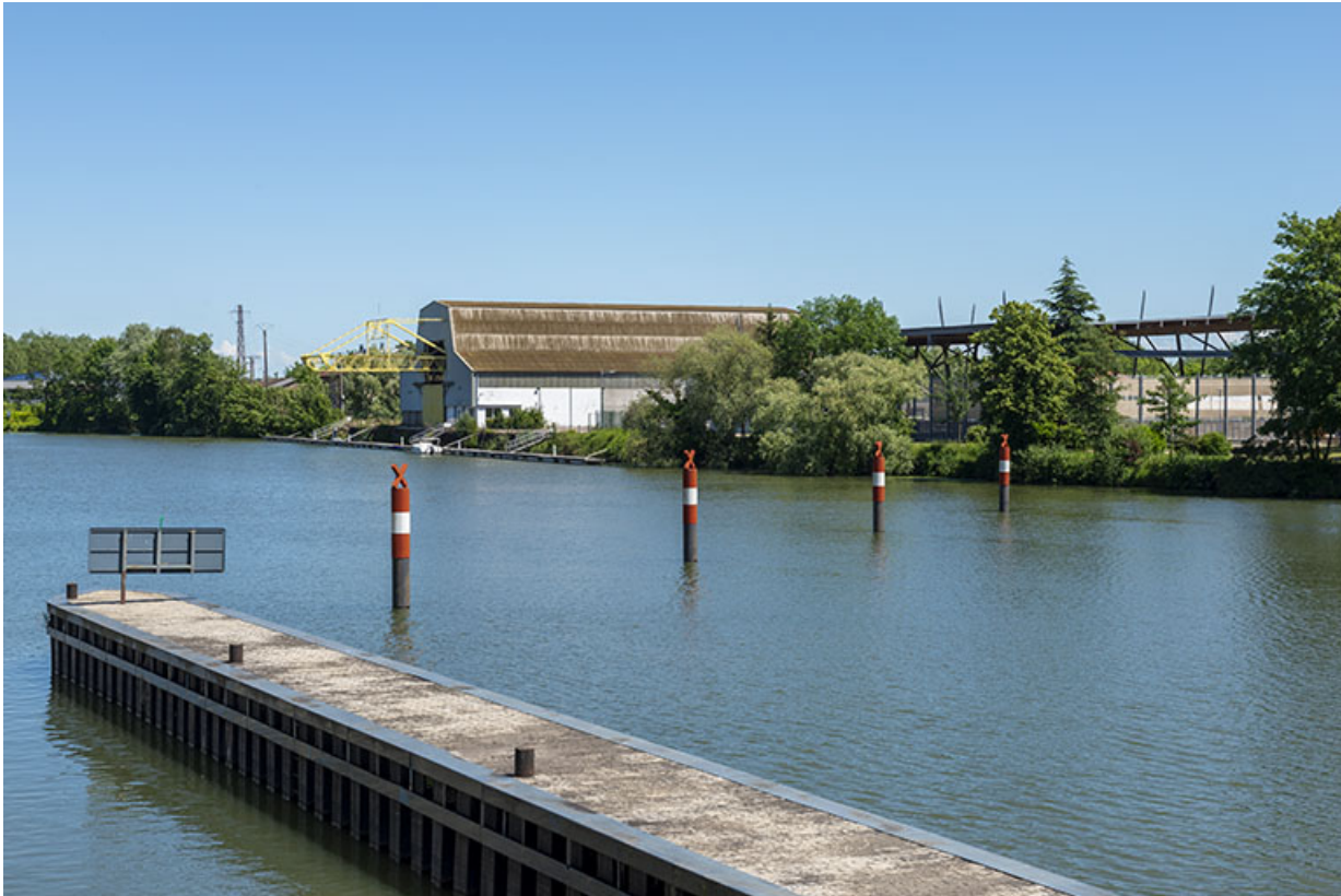
Digue de l'entrée de l'écluse sur la gauche. 70, Gray