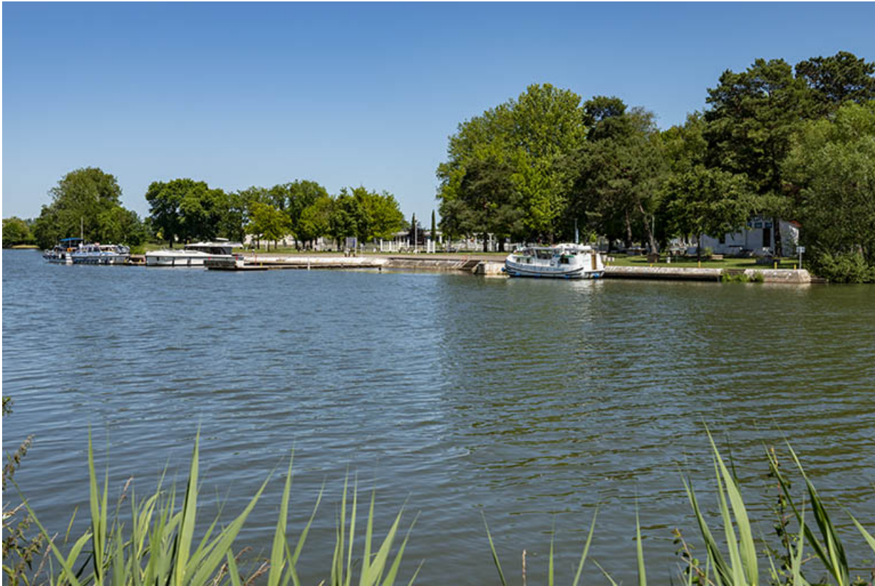
La plage artificielle.