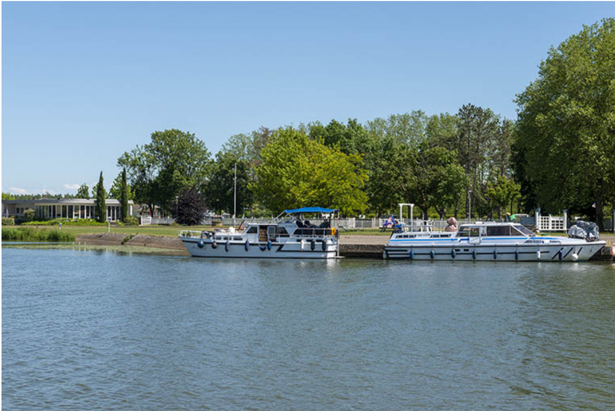
L'embarcadère pour les bateaux de plaisance.