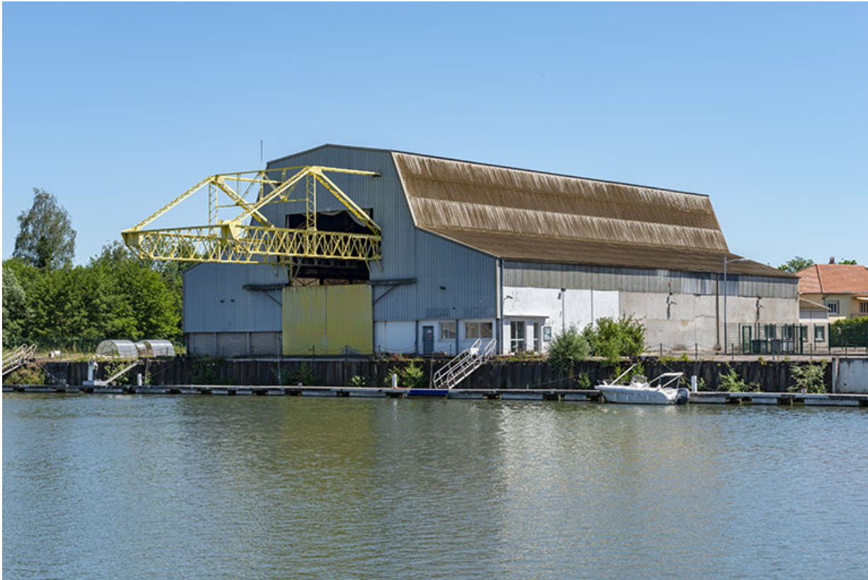
Vue de trois-quart.