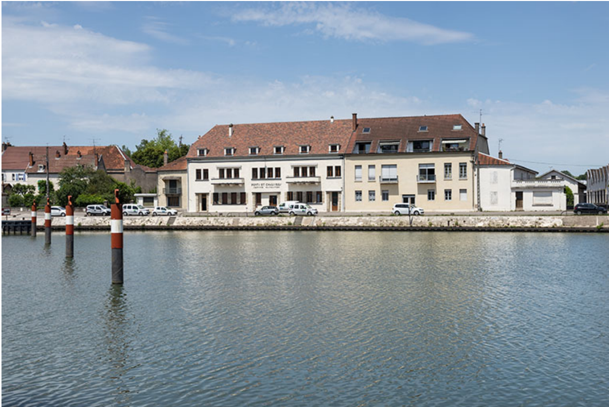
Subdivision de VNF à Gray.