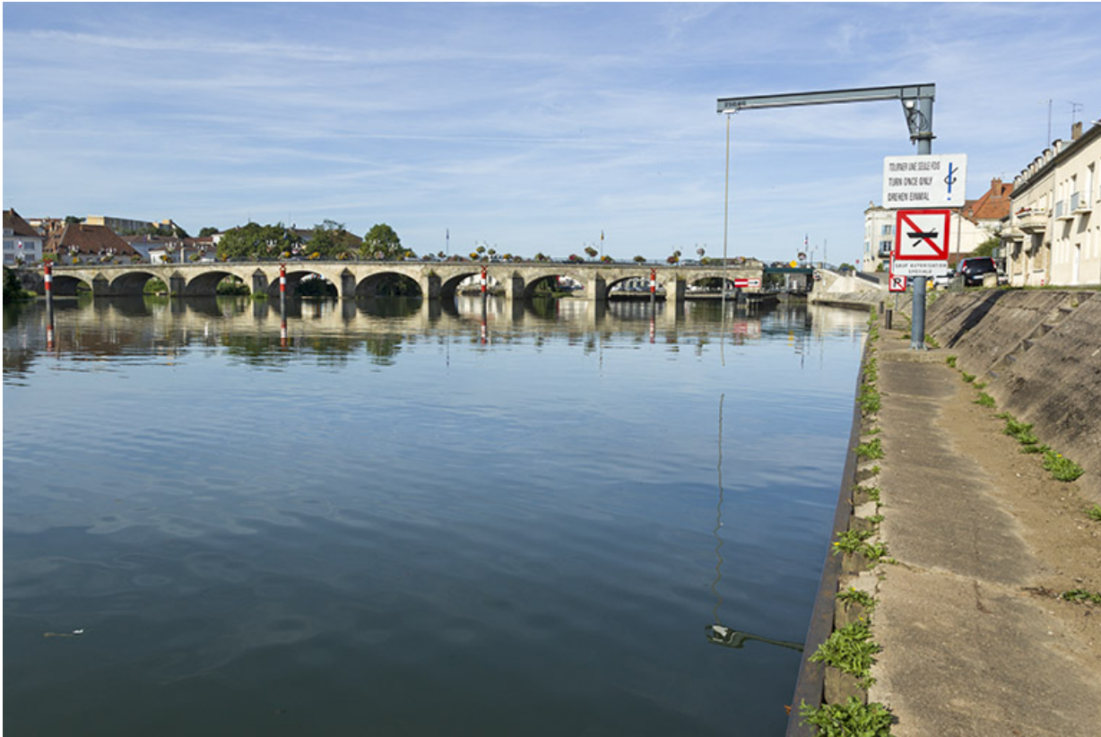
Vue générale du pont et du site d'écluse.