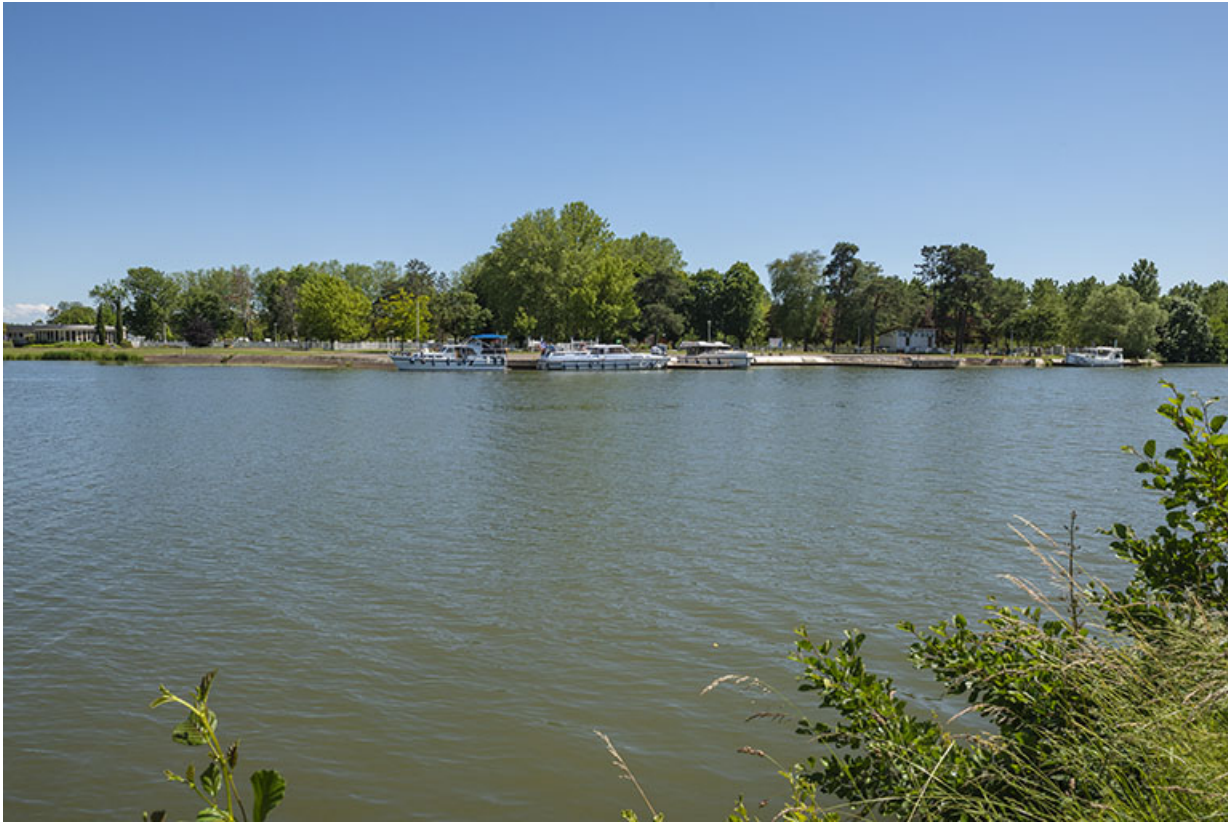
Le complexe de loisirs à Gray.