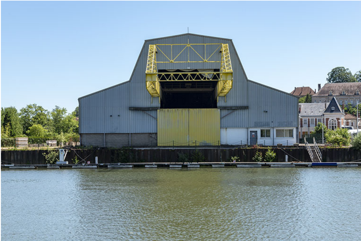
Ancien hangar transformé en société de location de bateaux.