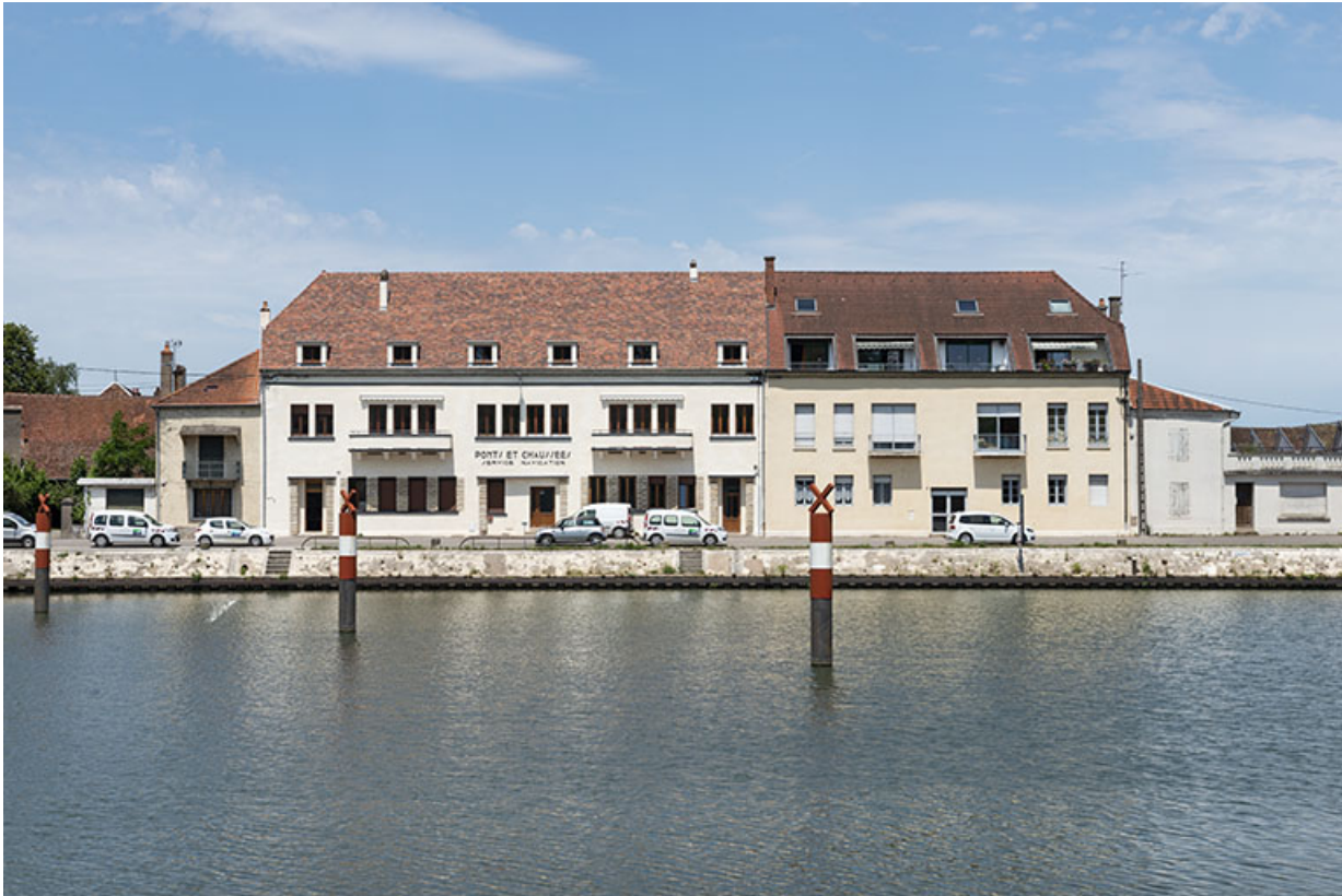
La subdivision, vue de la façade antérieure avec le quai Vergy. 70, Gray