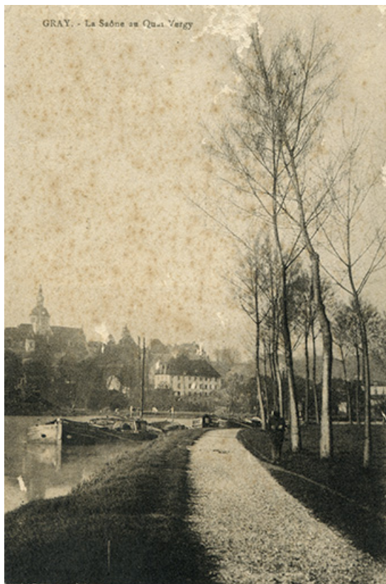
Gray - La Saône au quai Vergy, carte postale.