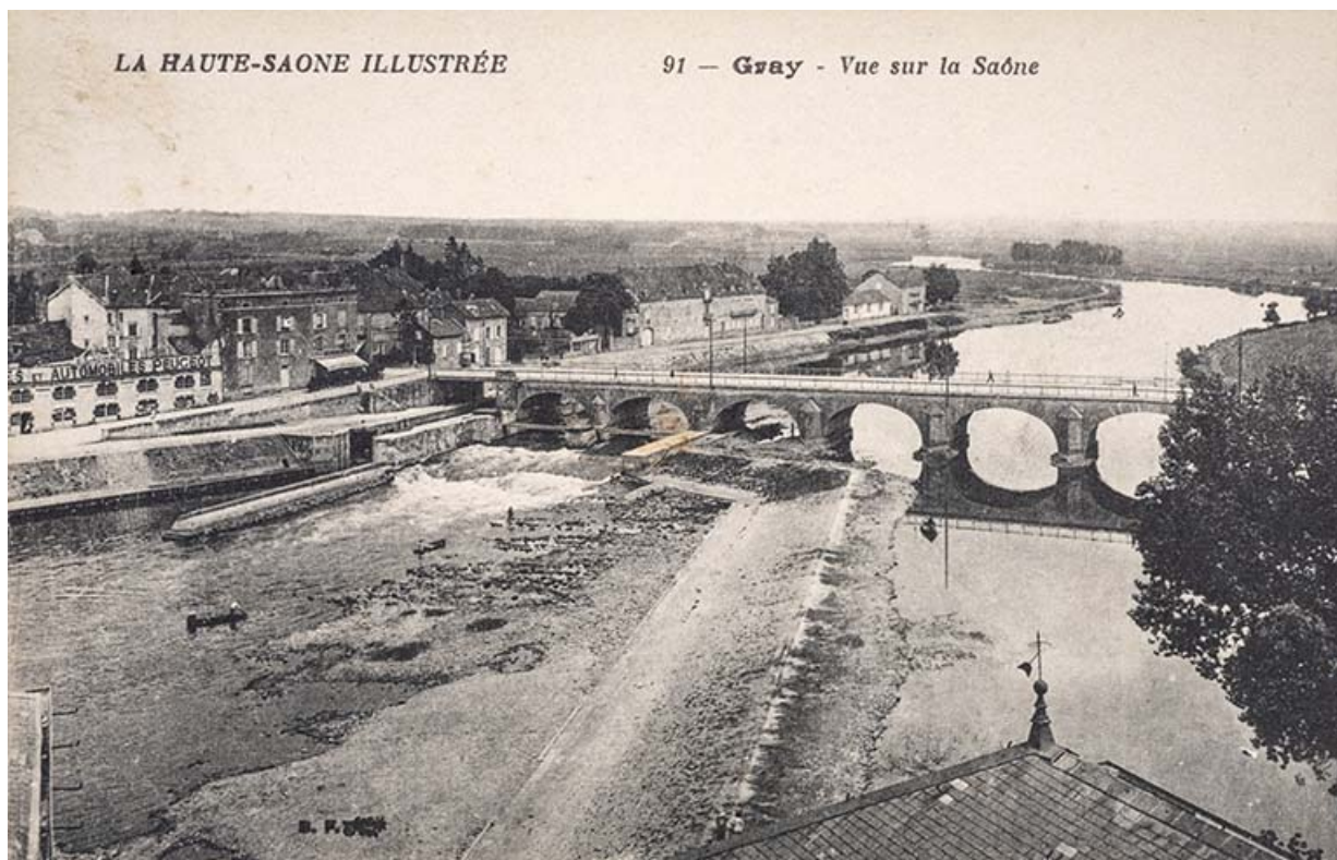
Vue générale du pont de Gray avec l'écluse, le déversoir et le quai Villeneuve, carte postale.