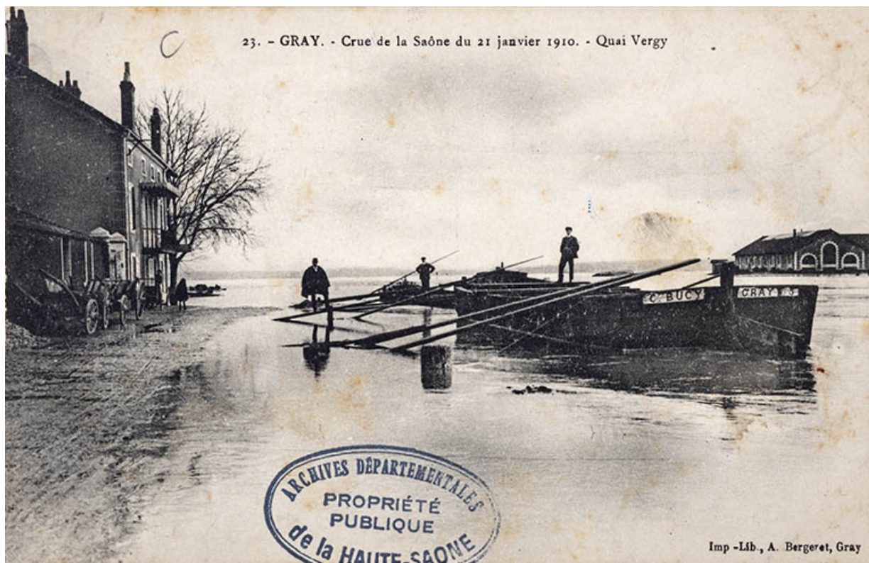
Gray - Crue de la Saône du 21 janvier 1910 - Quai Vergy, carte postale. 70, Gray

23. Gray - Crue de la Saône du 21 janvier 1910 - Quai Vergy. Carte postale éditée par Lib.A Bergeret à Gray, début 20e siècle. Légende indique la photo a été réalisée lors de la crue du janvier 1910.