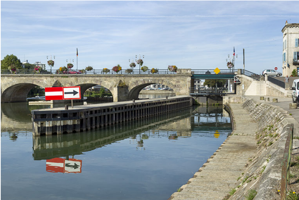
L'écluse, vue depuis l'amont.