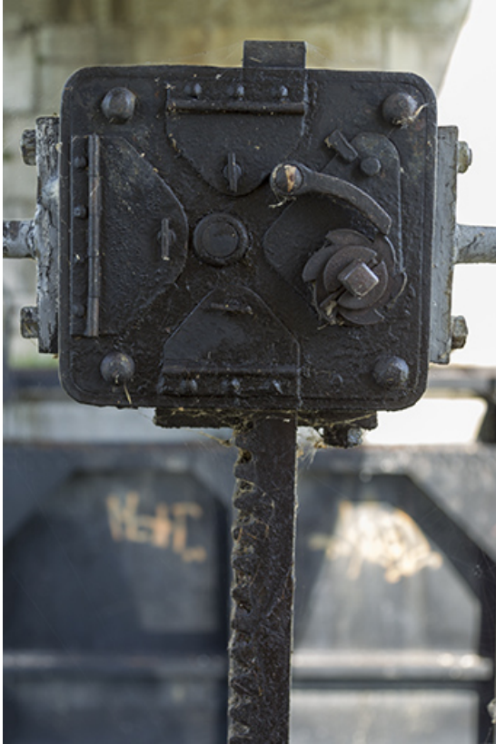
Cric manuel d'une vantelle.