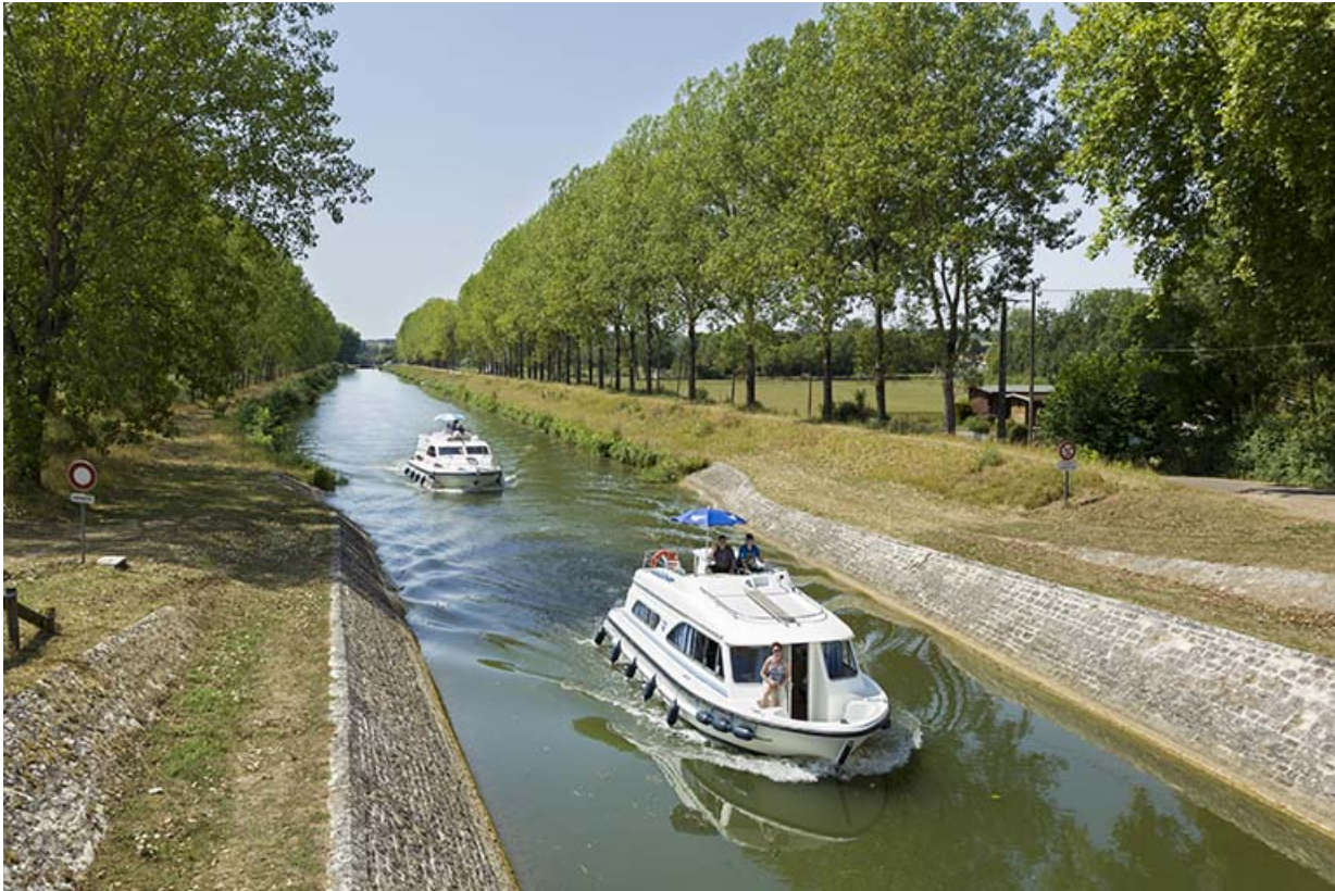
Bateaux de plaisance naviguant dans la dérivation de Rigny.