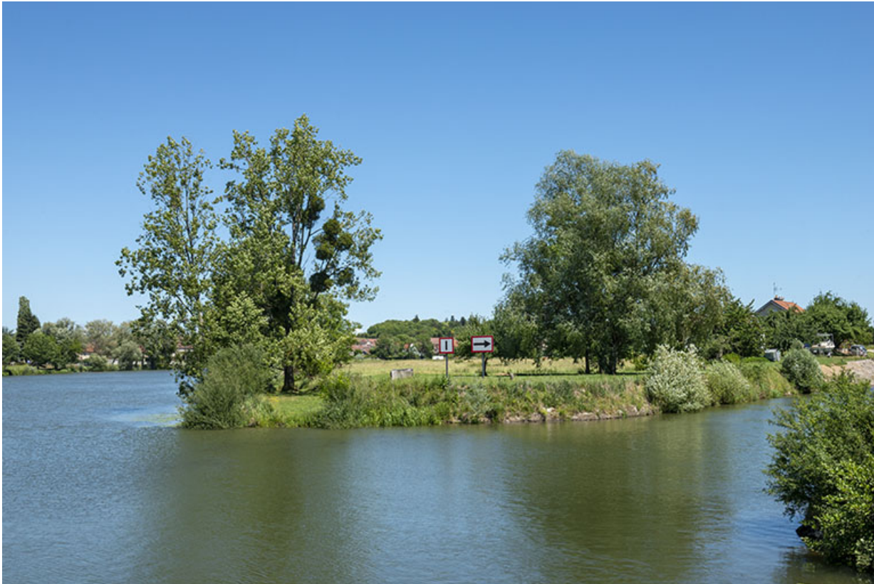
Fin du bief de Rigny et début de celui de Gray.