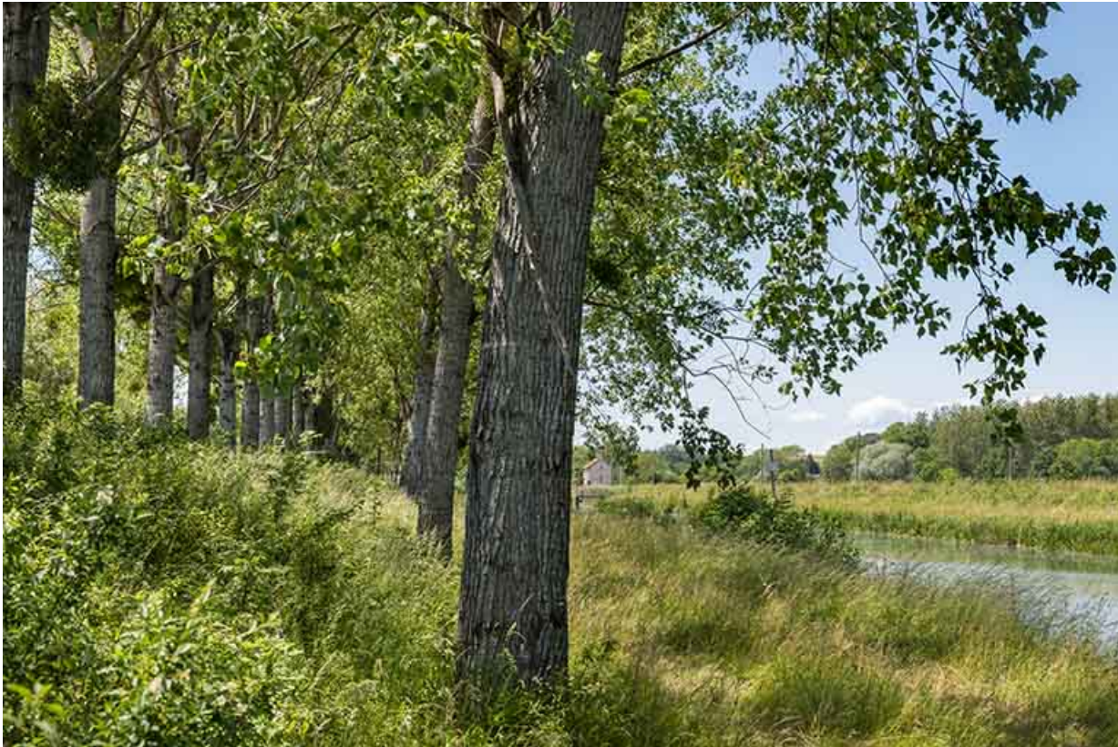
Alignement double d'arbres le long du canal de navigation.