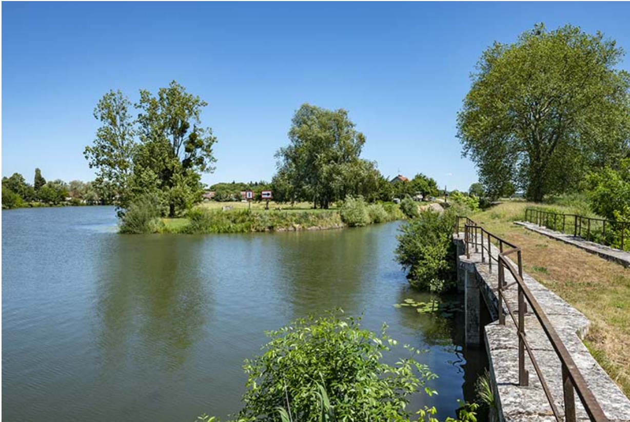
Sortie aval de la dérivation.