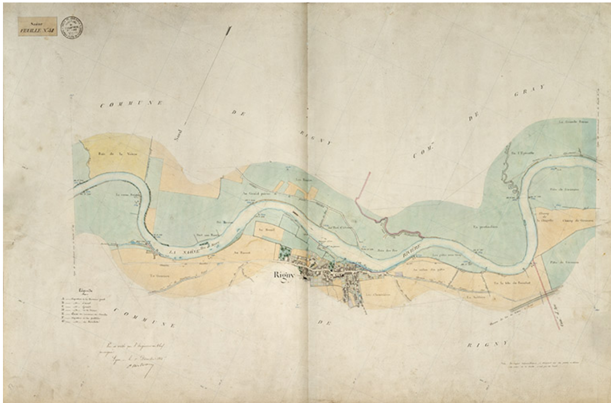
Saône - Feuille n°51.