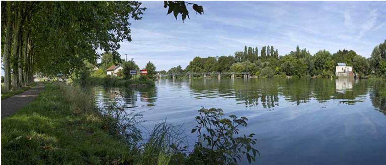
Le bief avec l'entrée de la dérivation sur la gauche et la Saône sur la droite. 70, Rigny