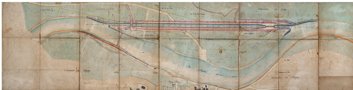
Bief de Rigny. Construction d'une dérivation éclusée, d'un barrage mobile et d'un chemin de halage. Plan général (1876). 70, Rigny

Archives départementales de la Haute-Saône, Vesoul : Bief de Rigny. Construction d'une dérivation éclusée, d'un barrage mobile et d'un chemin de halage. Plan général (1876). 274 S 28. Dessin.