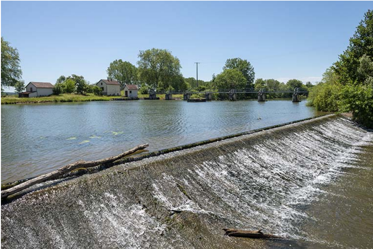
Vue de profil du déversoir et le barrage mobile en arrière-plan. 70, Rigny