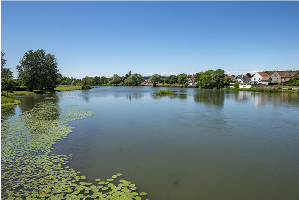
La Saône et le village de Rigny.