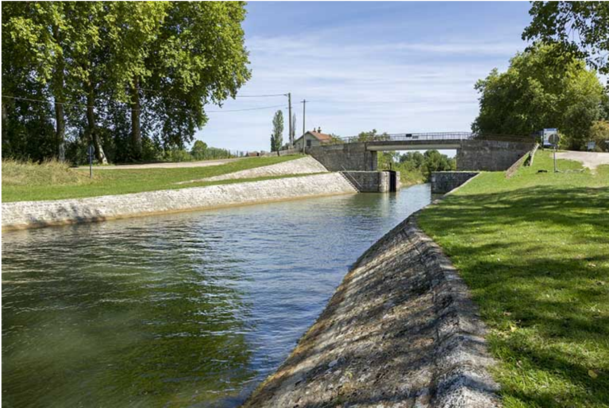
Vue depuis l'aval de la porte de garde et la maison du barragiste en arrière-plan. 70, Rigny