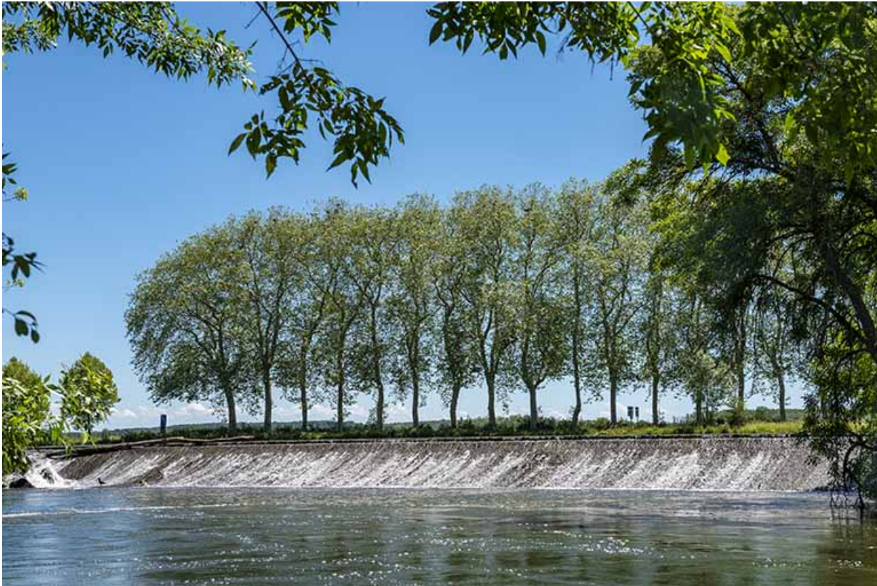
Déversoir en amont du barrage.