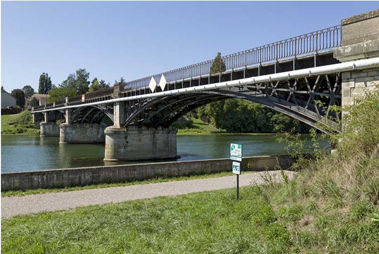
Le pont de Prantigny.