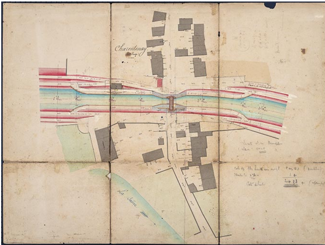
Plan général de la tranchée maçonnée (1876). 70, Soing-Cubry-Charentenay