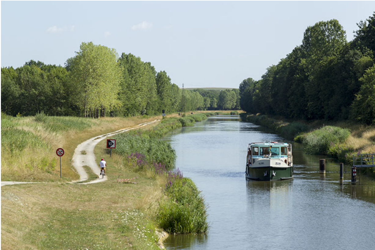
La dérivation au niveau de Ray-sur-Saône avec le chemin de halage.