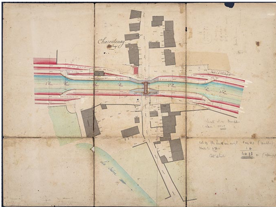
Plan général de la tranchée maçonnée (1876).