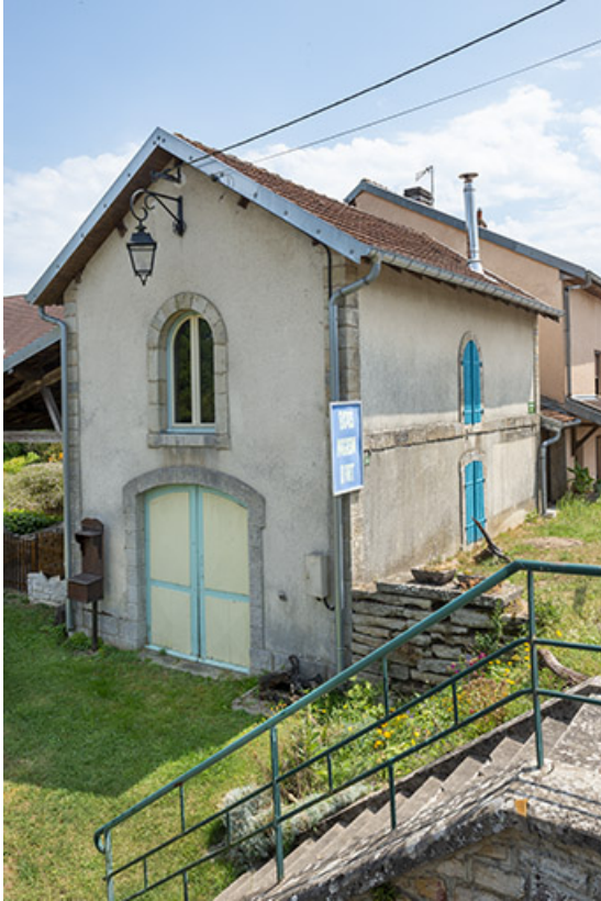
Magasin servant à la maintenance du pont-tournant. 70, Soing-Cubry-Charentenay