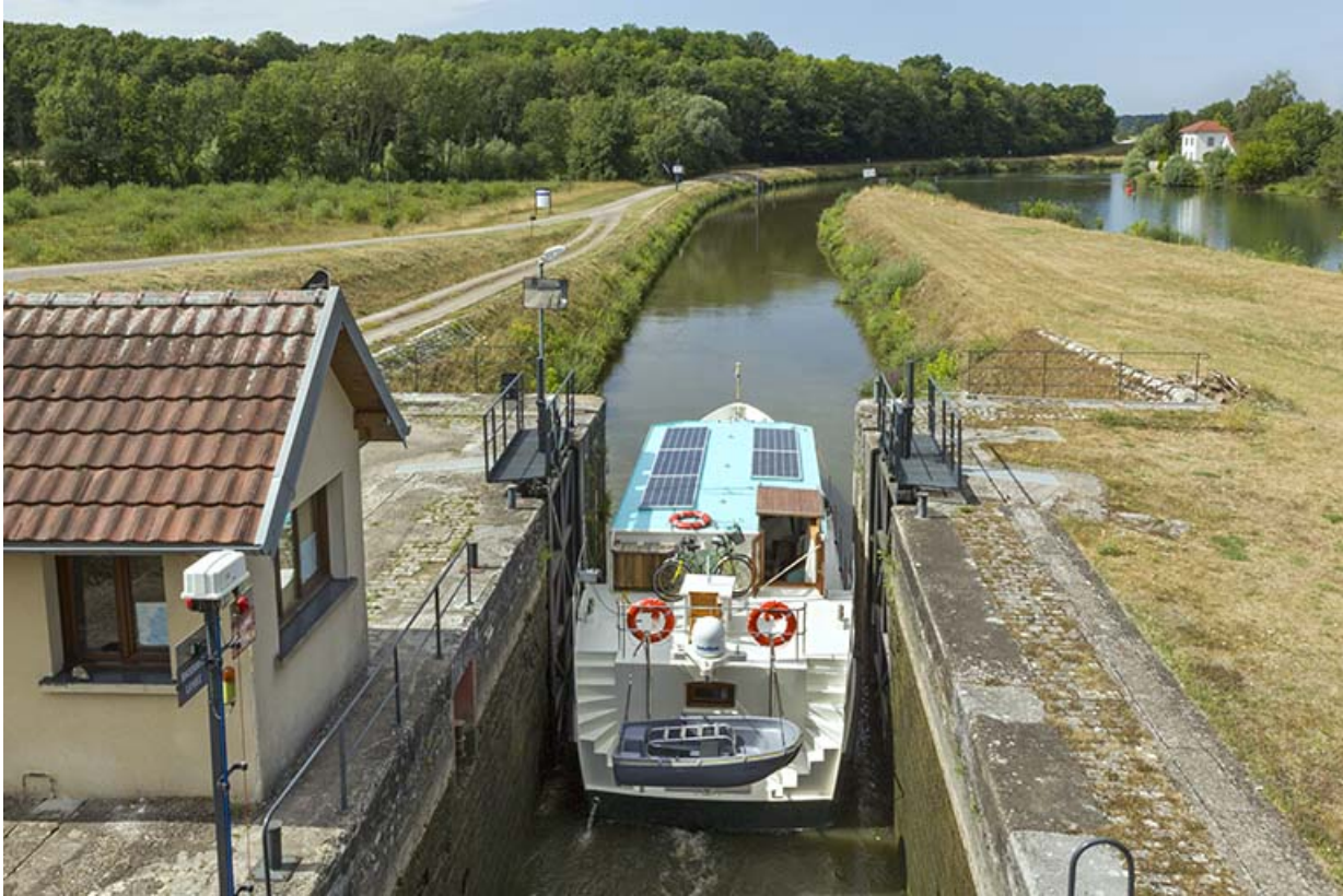
Bateau quittant le sas de l'écluse.