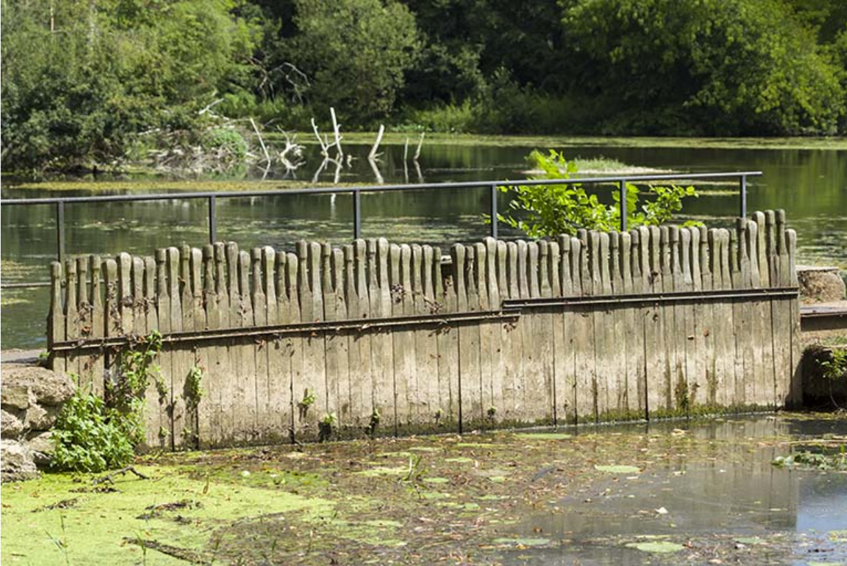
Aiguilles fermant l'ancien pertuis de navigation.