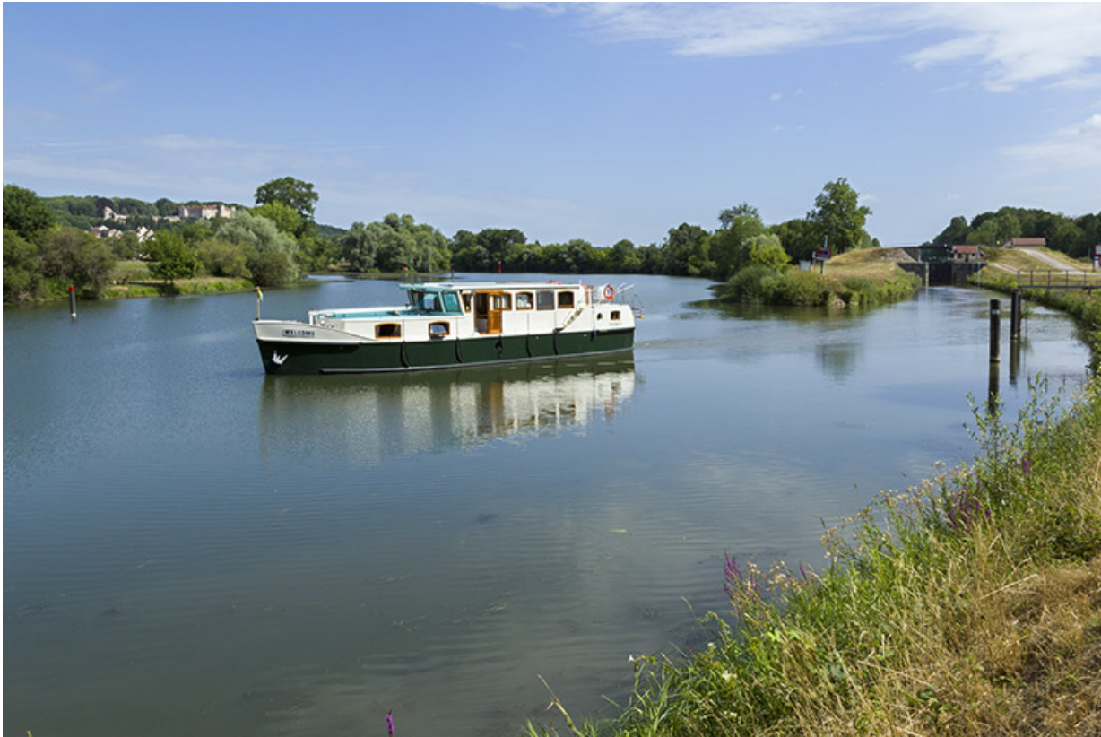
bateau de plaisance sortant de la dérivation de Charentenay.