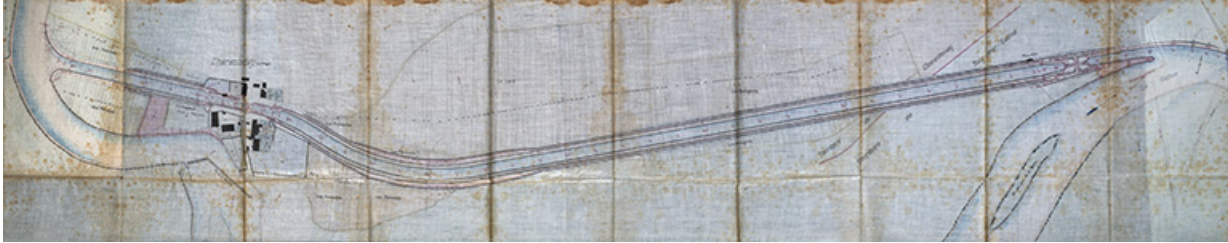
Achèvement de la dérivation de Charentenay - Plan général de la dérivation (1876).