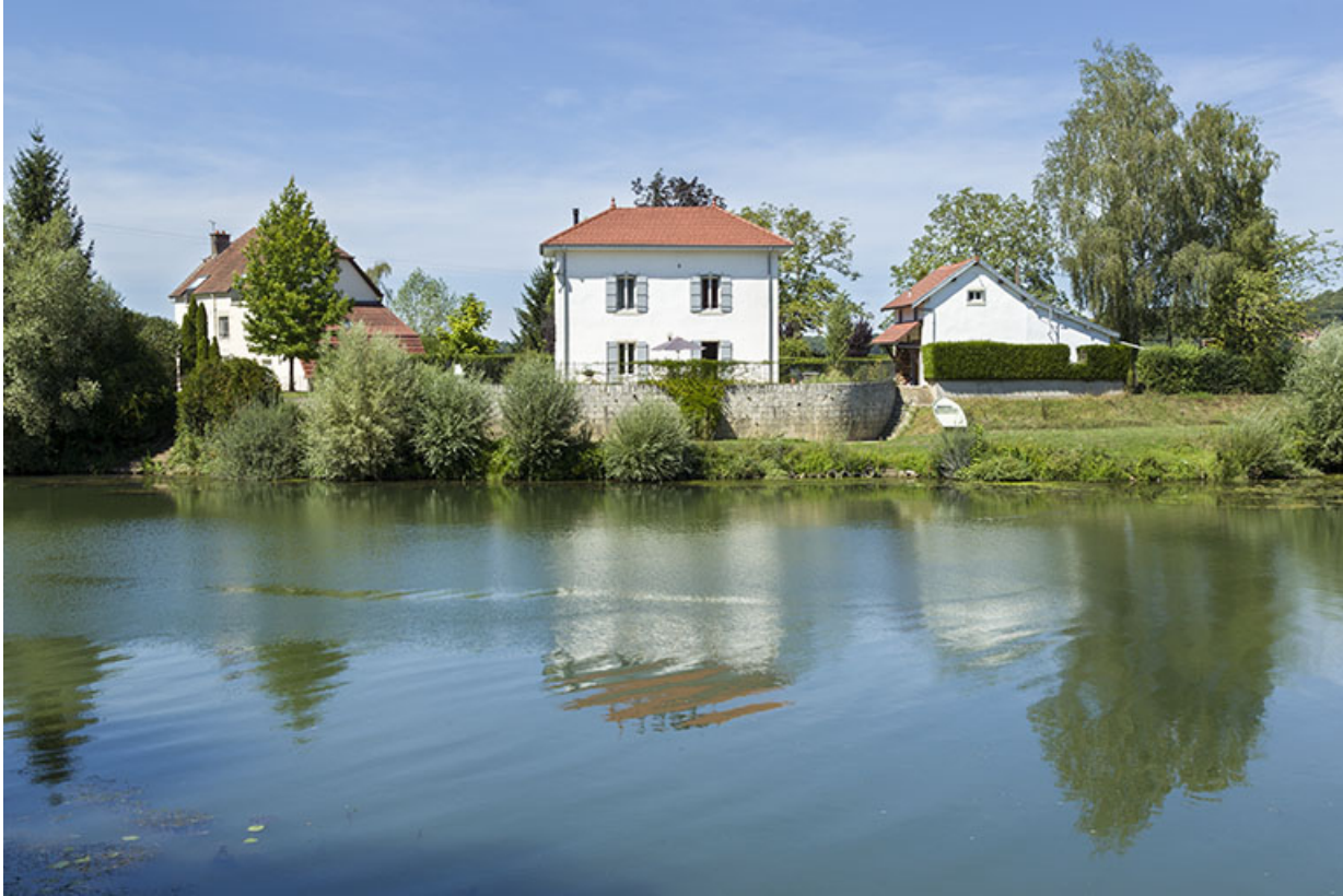
Embarcadère de l'ancien bac de Ray-sur-Saône.