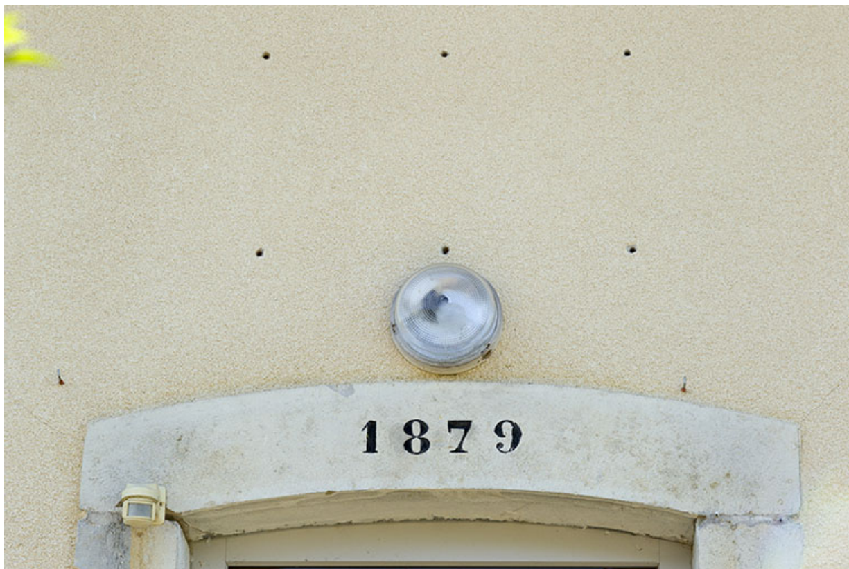
Date portée sur le linteau de la porte de la maison.