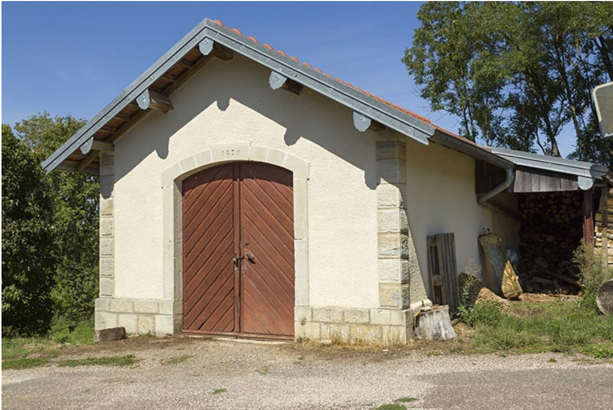
Le magasin attenant au site d'écluse.