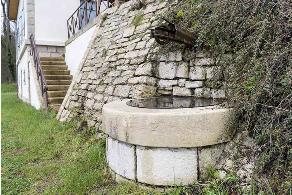
Puits de la maison.