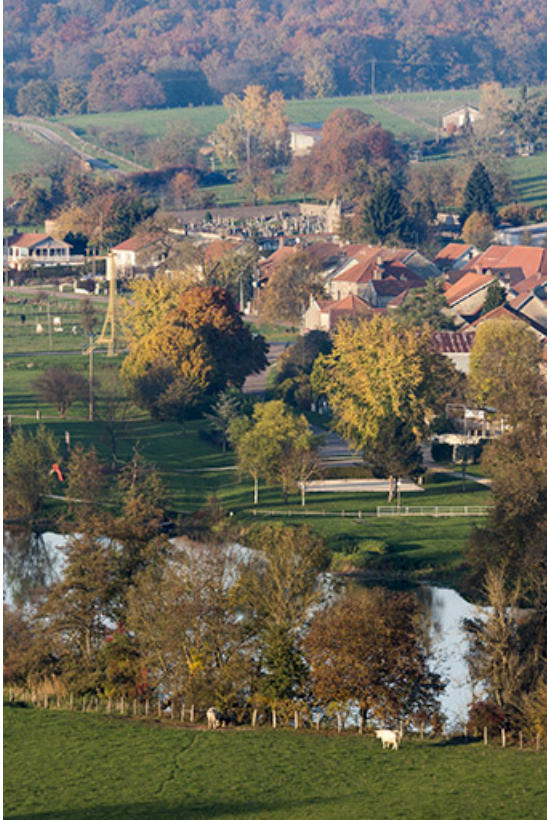
Paysage du val de Saône.