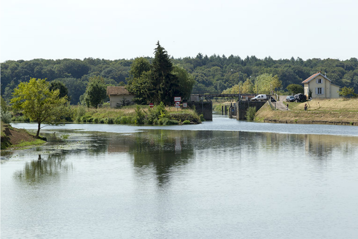
Entrée du canal de navigation de Cubry-lès-Soing.