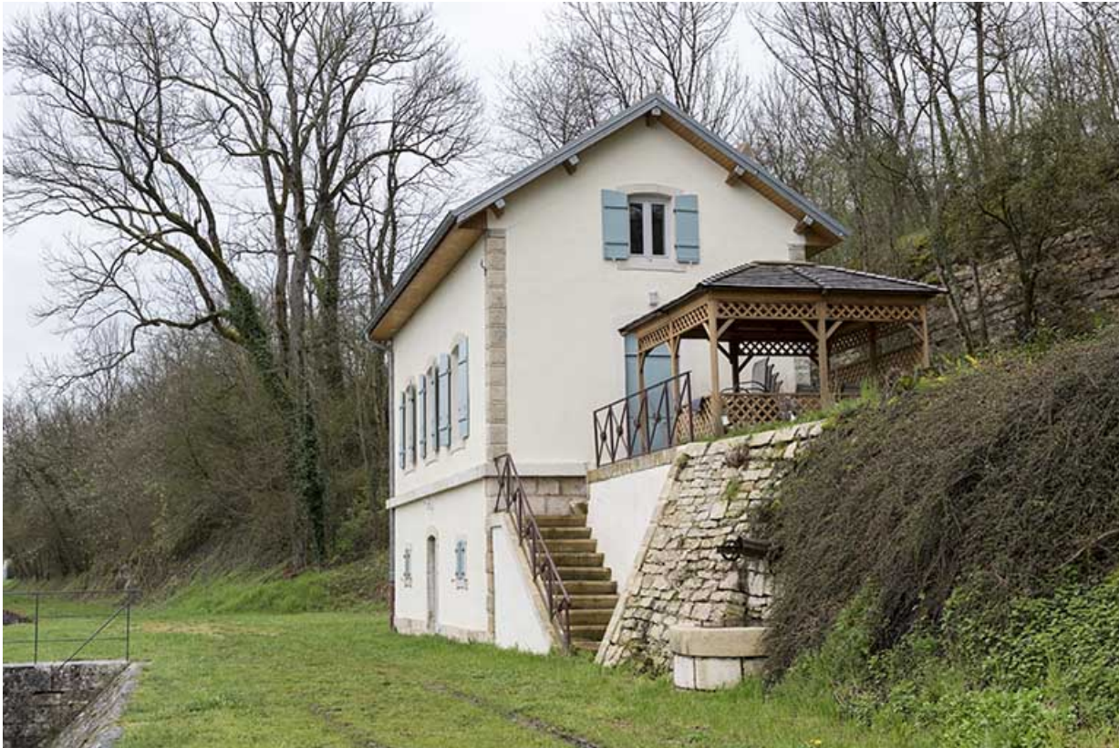
La maison d'éclusier.