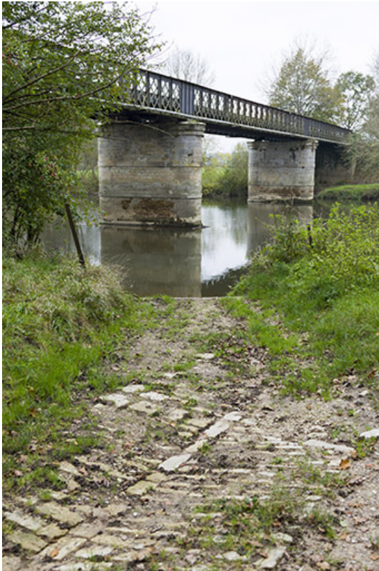
Emplacement de l'ancien bac de Cubry.