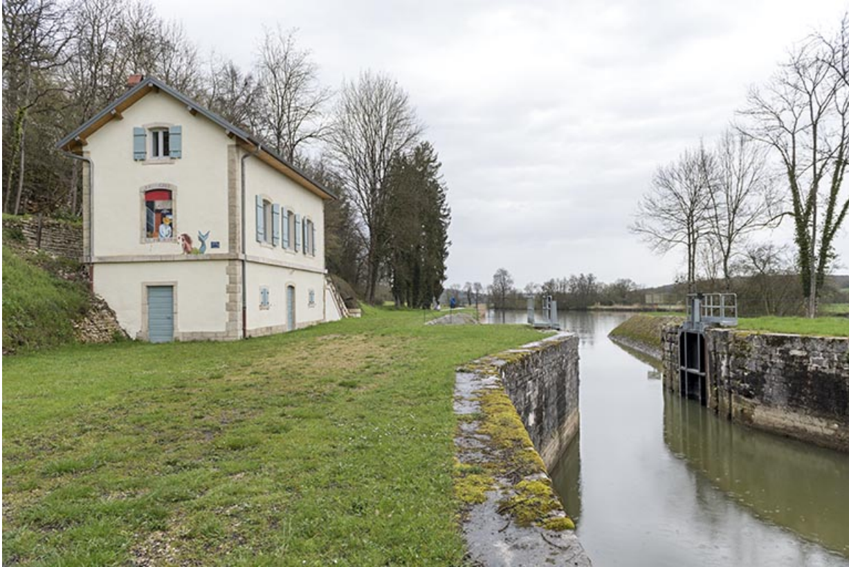
Vue depuis l'aval du site d'écluse.