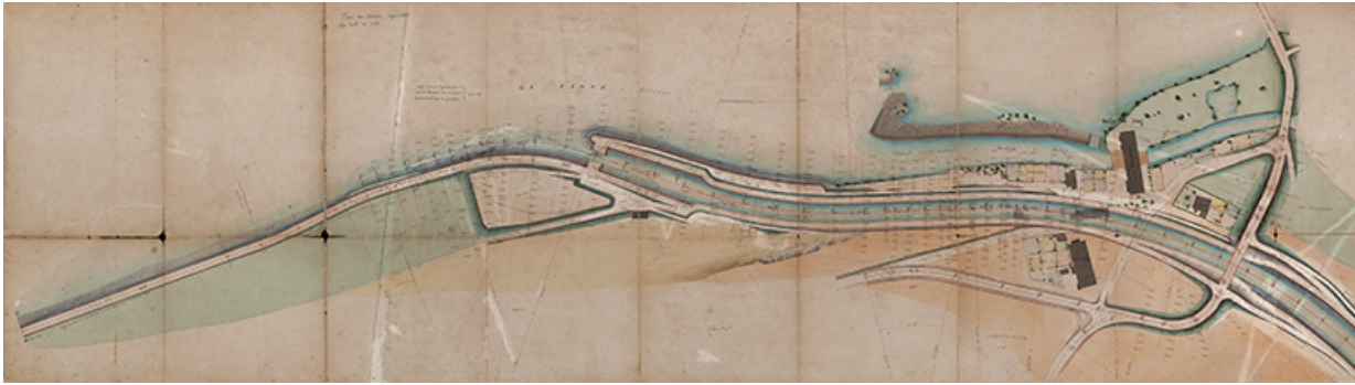
Dérivation de Soing - Plan des abords de la porte de garde et du pont sous le chemin de Morey à Soing (1878). 70, Soing-Cubry-Charentenay

Archives départementales de la Haute-Saône, Vesoul : Dérivation de Soing - Plan des abords de la porte de garde et du pont sous le chemin de Morey à Soing (1878). Vst 1545-27. Dessin.