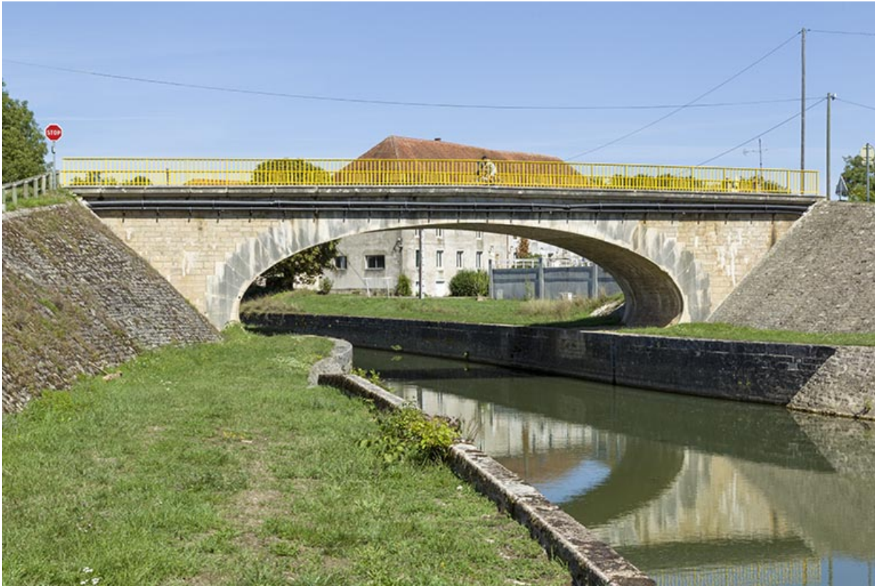
Vue générale de l'édifice depuis l'aval.