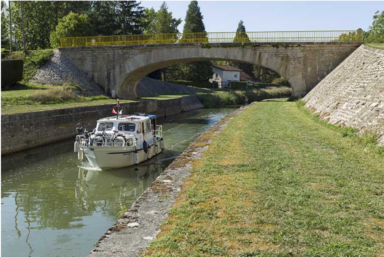
Bateau navigant sur le canal à hauteur de Soing.