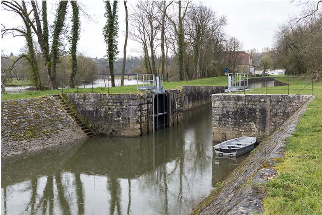
La maçonnerie de la porte de garde.