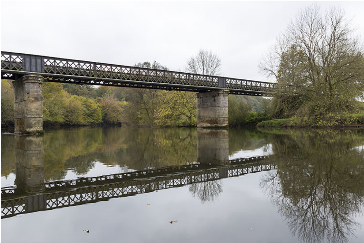
Pont de Cubry et la Saône.