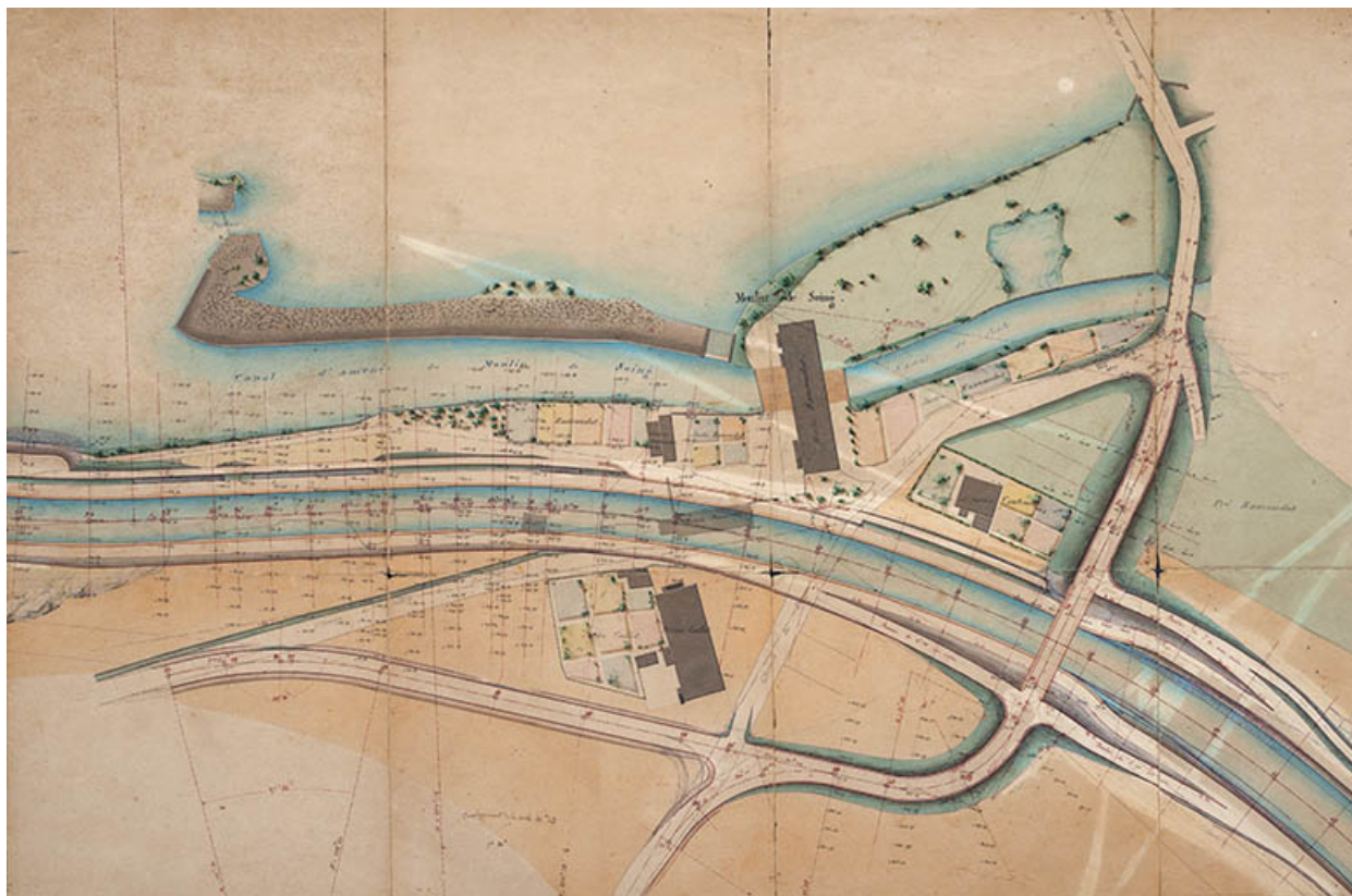
Dérivation de Soing - Plan des abords de la porte de garde et du pont sous le chemin de Morey à Soing (1878) : détail au niveau du moulin de Soing.