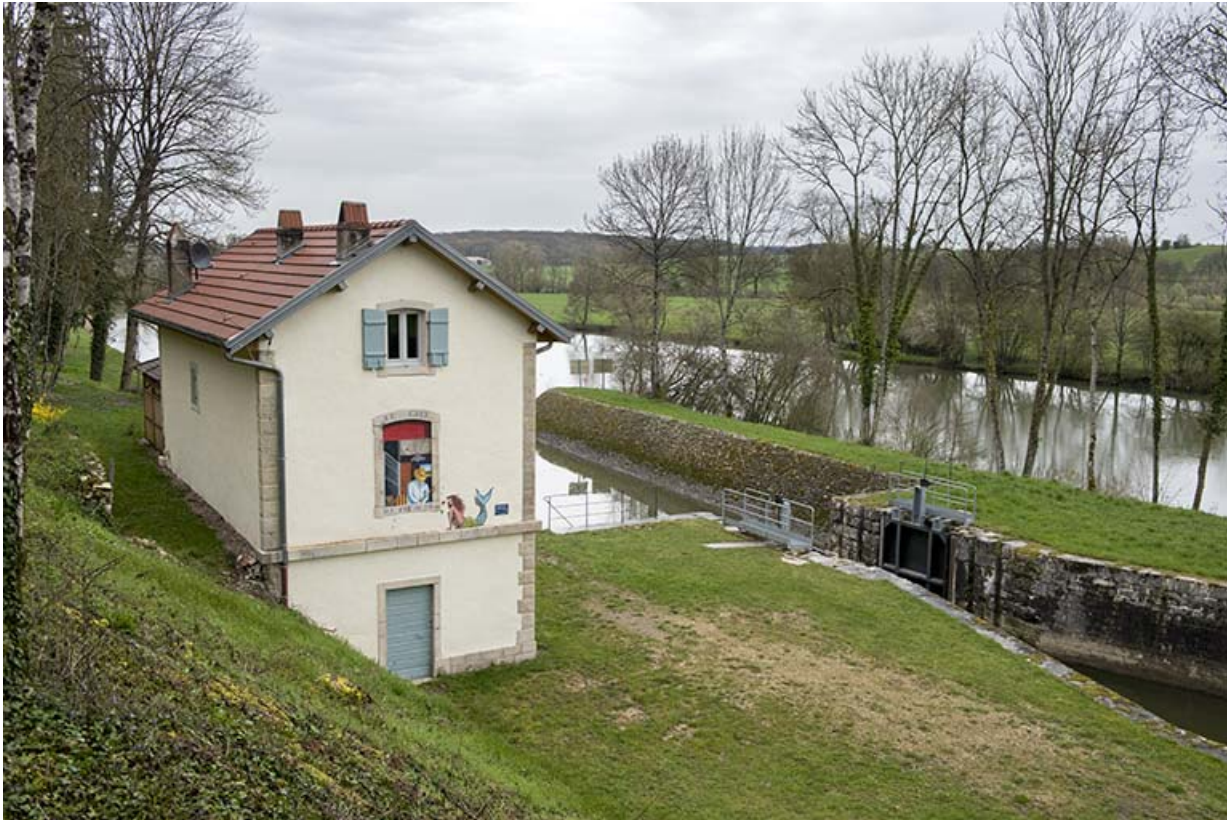
le site d'écluse, vue d'ensemble.