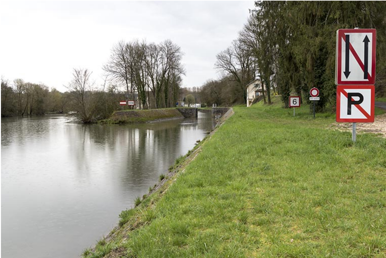
La porte de garde de Soing.