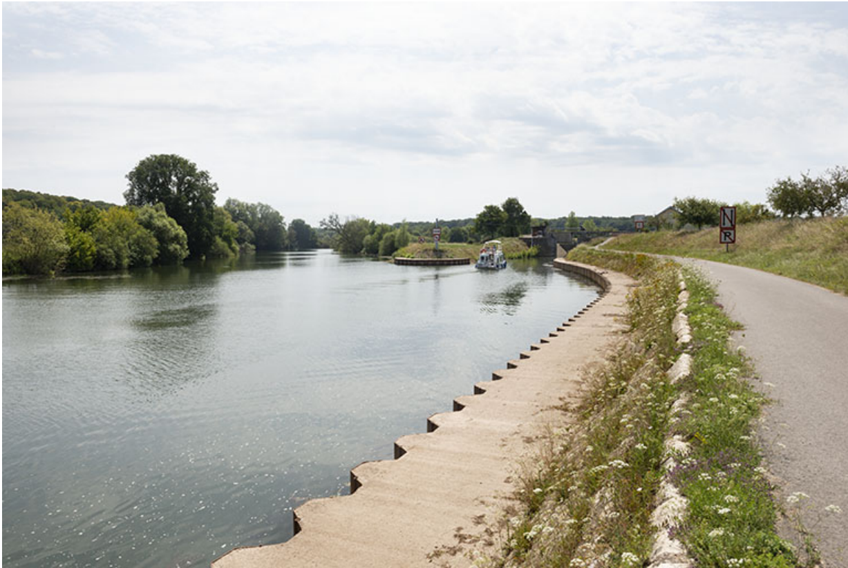
Entrée du canal de navigation de Cubry depuis le chemin de halage.