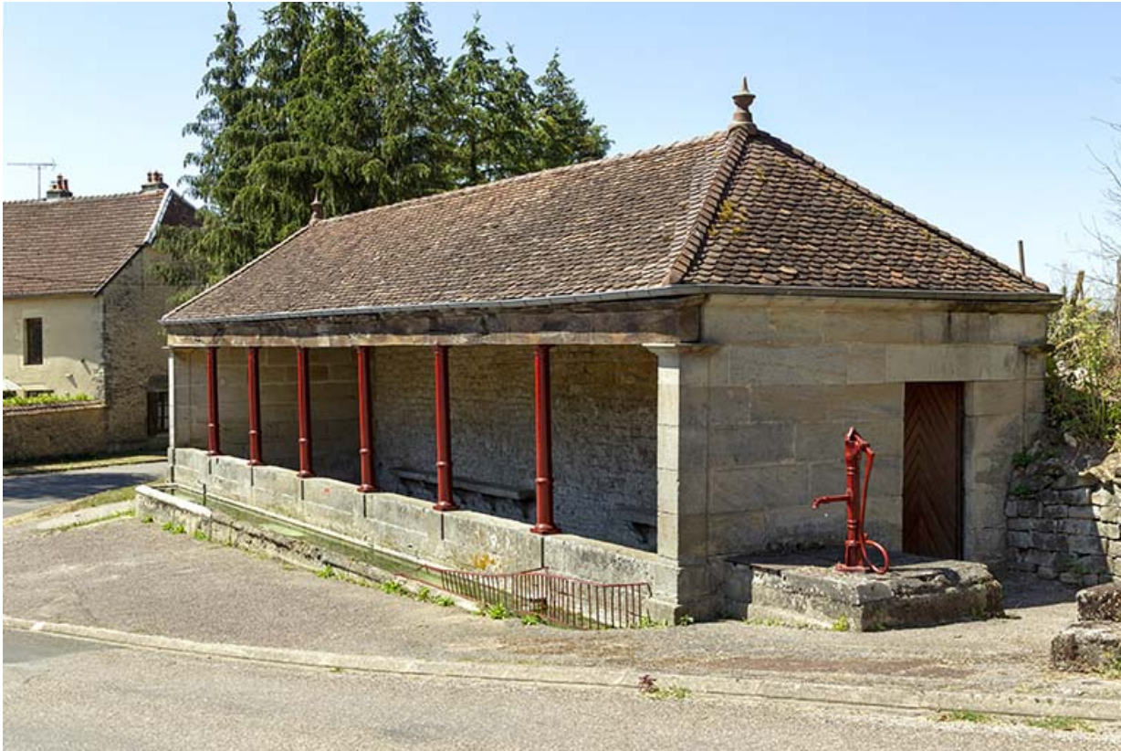
Vue rapprochée de trois-quart nord-est du lavoir à l'entrée sud-ouest du village. 70, Cendrecourt