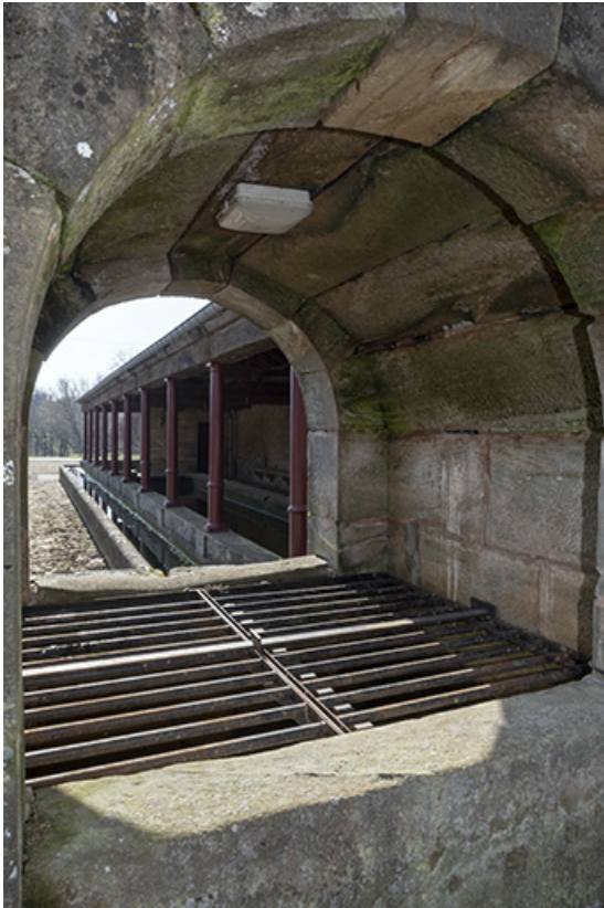
Vue du lavoir depuis l'édicule abritant la source. 70, Cendrecourt