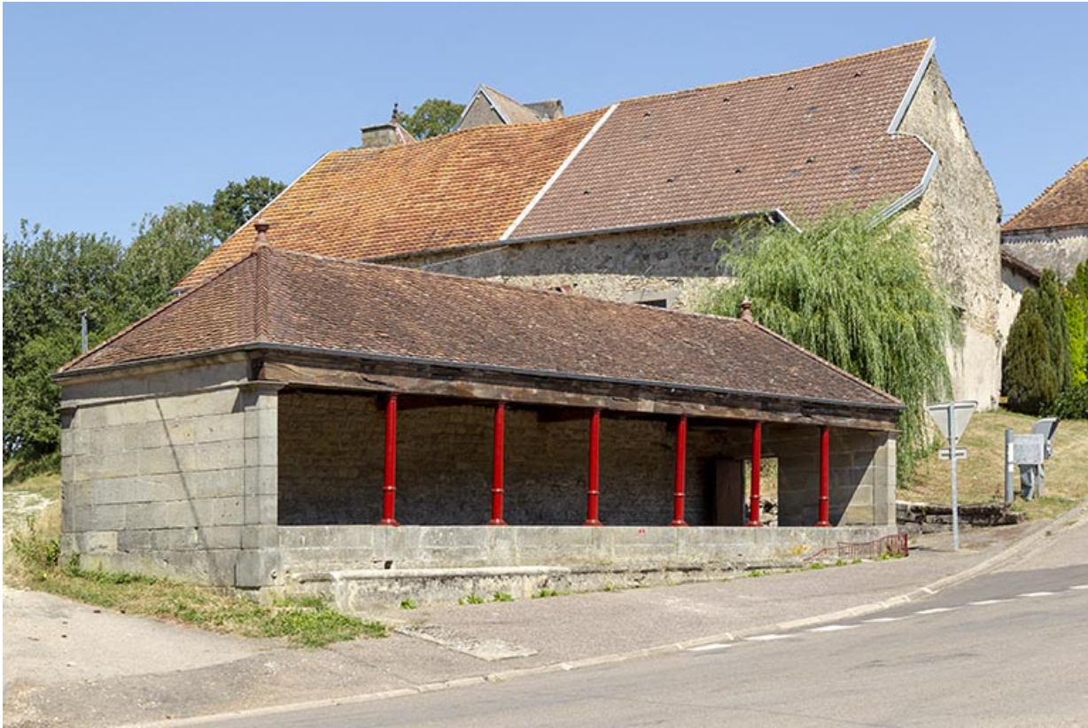
Vue de trois-quart sud du lavoir à l'entrée sud-ouest du village. 70, Cendrecourt