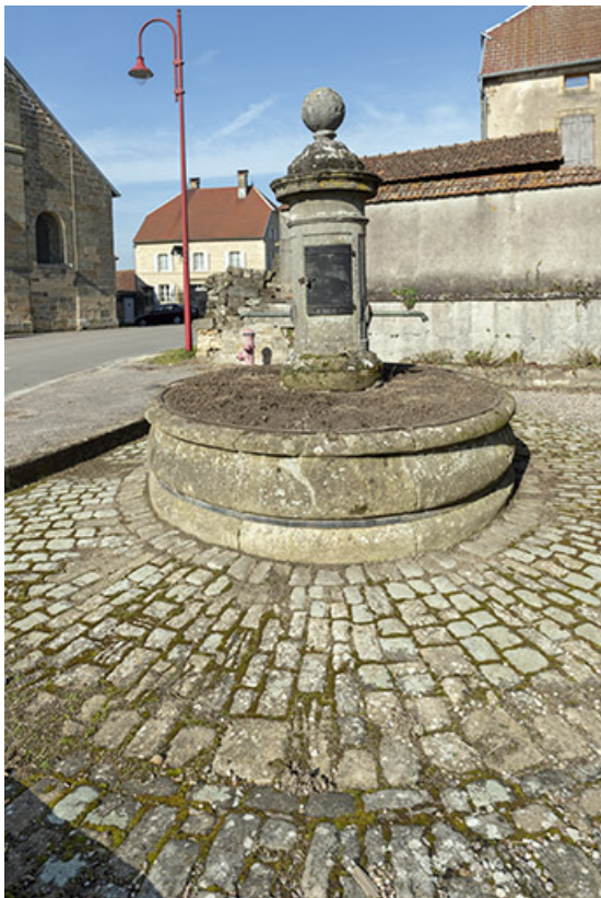
Ancienne fontaine remployée. (au nord-ouest de l'hôtel de ville) Vue du sud-est. 70, Cendrecourt