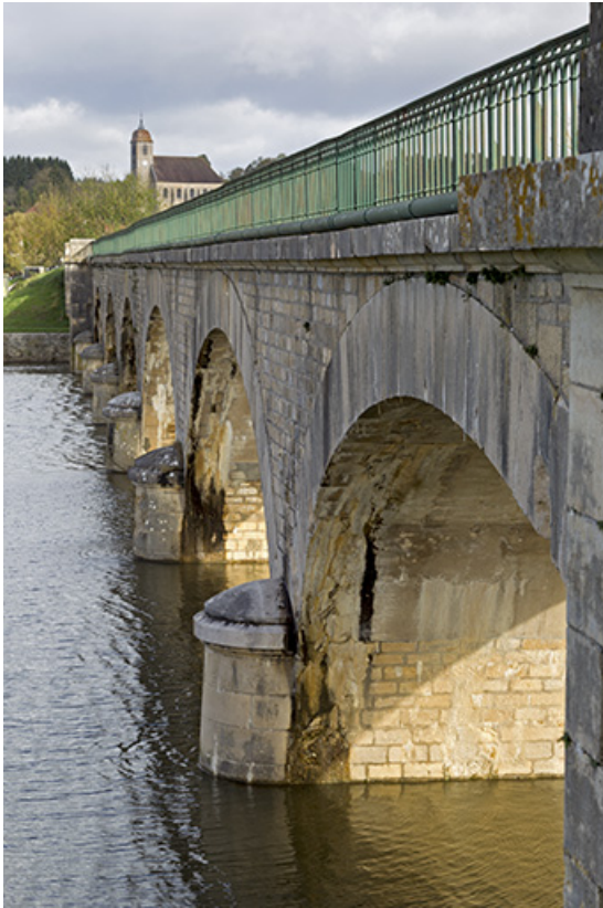
Vue de profil.