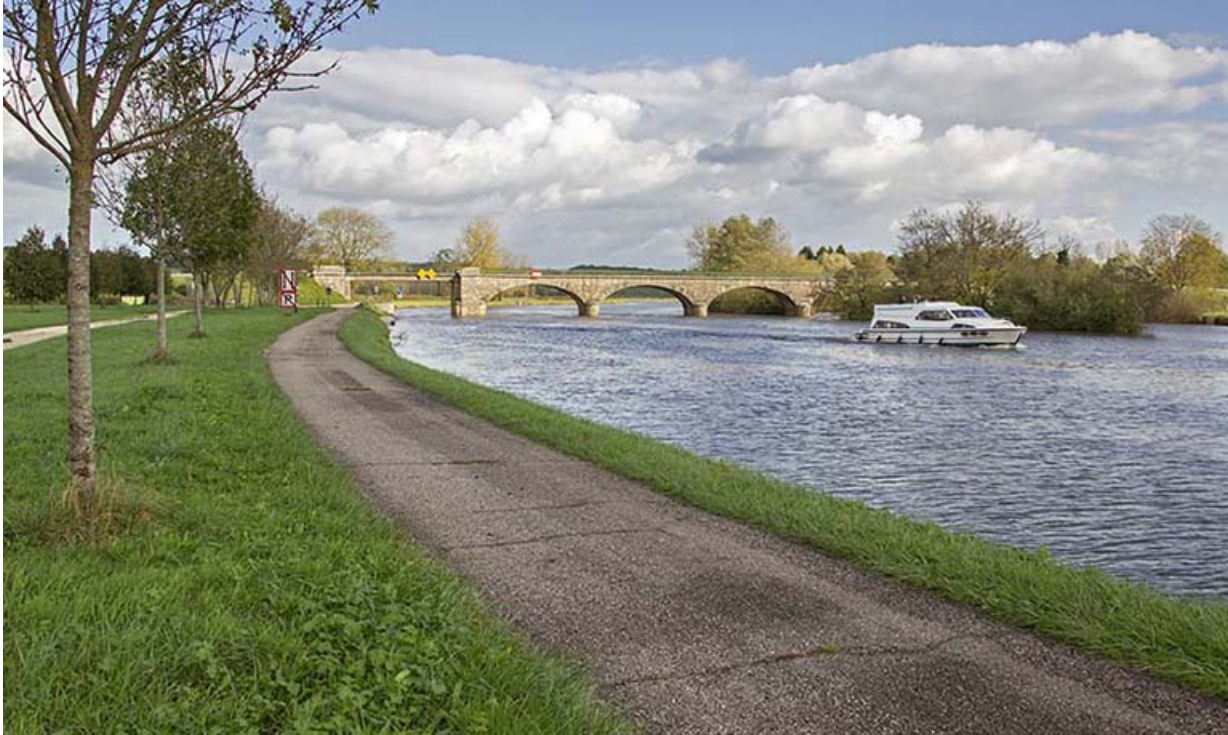
Vue depuis l'aval.