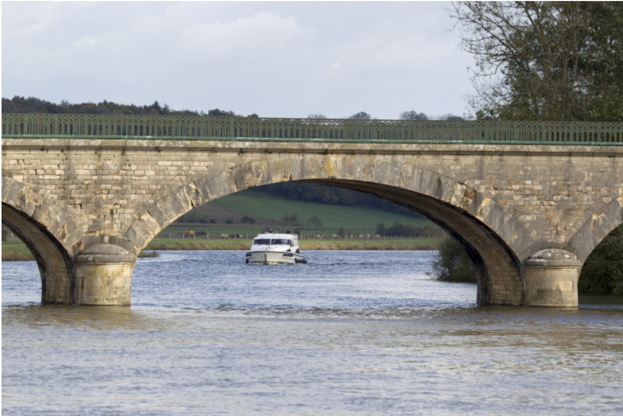
Détail d'une arche maçonnée du pont.