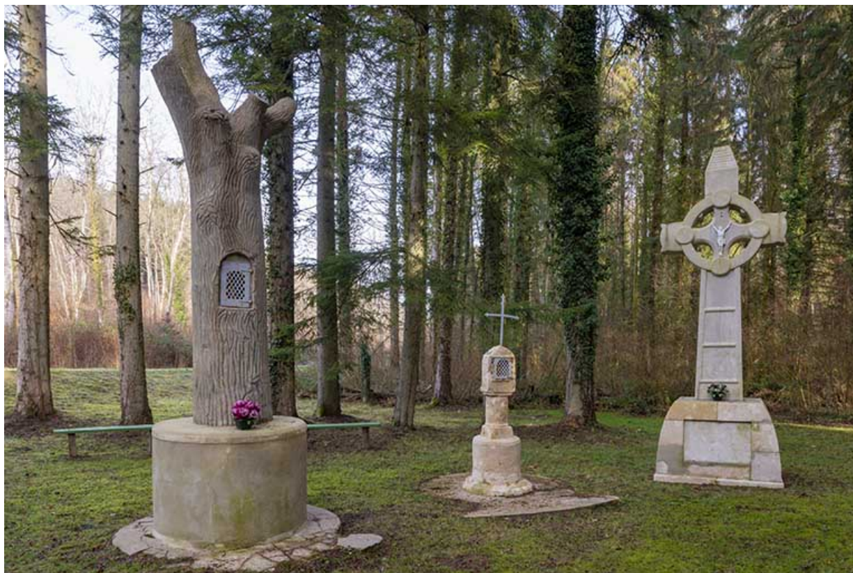
Tronc d'arbre artificiel, édicule à niche et croix monumentale.

70, Scey-sur-Saône-et-Saint-Albin, lieudit : Bois du prince de Bauffremont