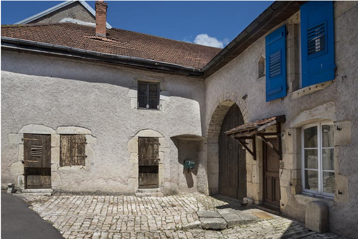
Façade antérieure, partie nord.

70, Sceaux-sur-Saône-et-Saint-Albin, 8 rue de l'Église