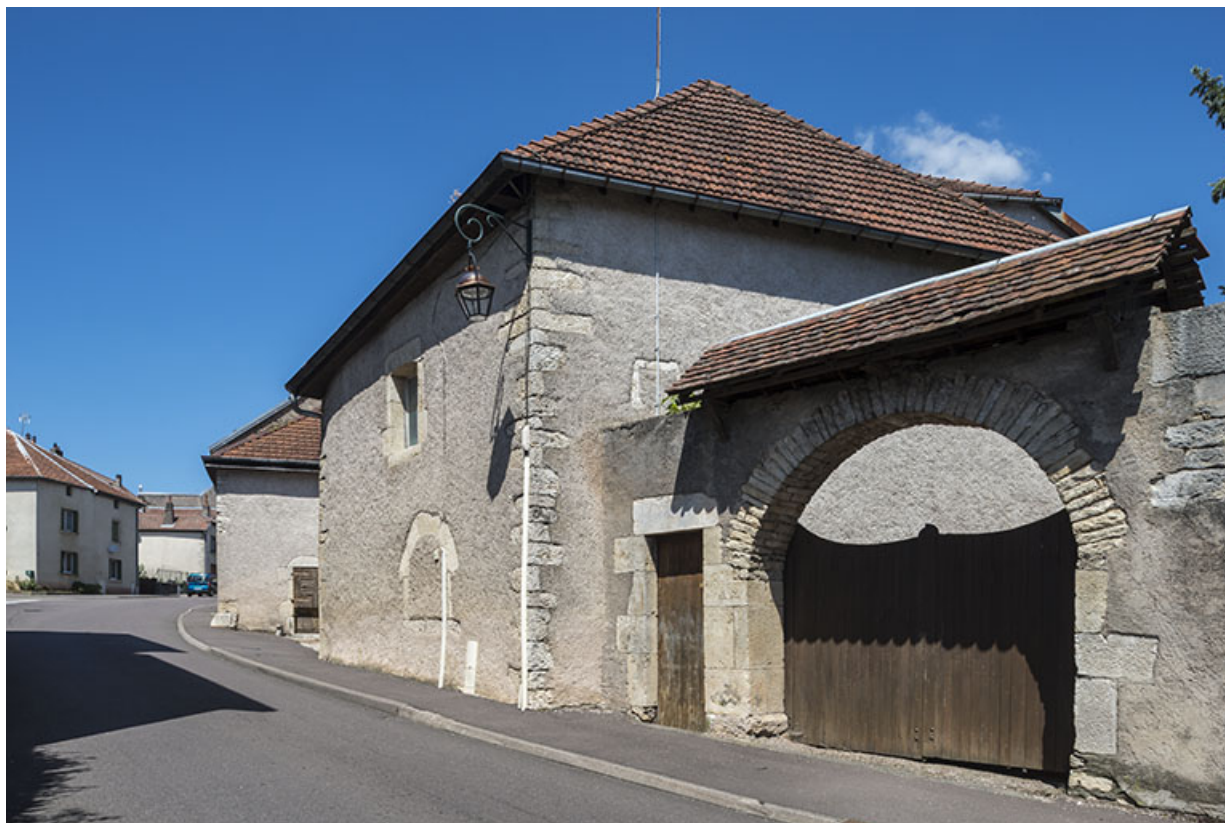
La porte charretière donnant accès au jardin.

70, Sceaux-sur-Saône-et-Saint-Albin, 8 rue de l' Église