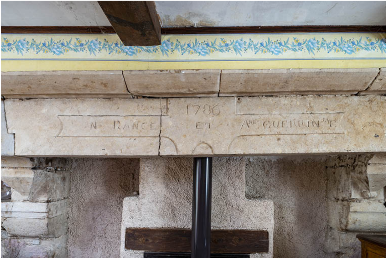
Inscriptions portées sur le manteau de la cheminée.

70, Scey-sur-Saône-et-Saint-Albin, 8 rue de l' Église