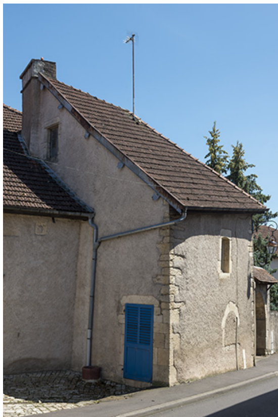
Façade antérieure, partie sud.

70, Scey-sur-Saône-et-Saint-Albin, 8 rue de l' Église