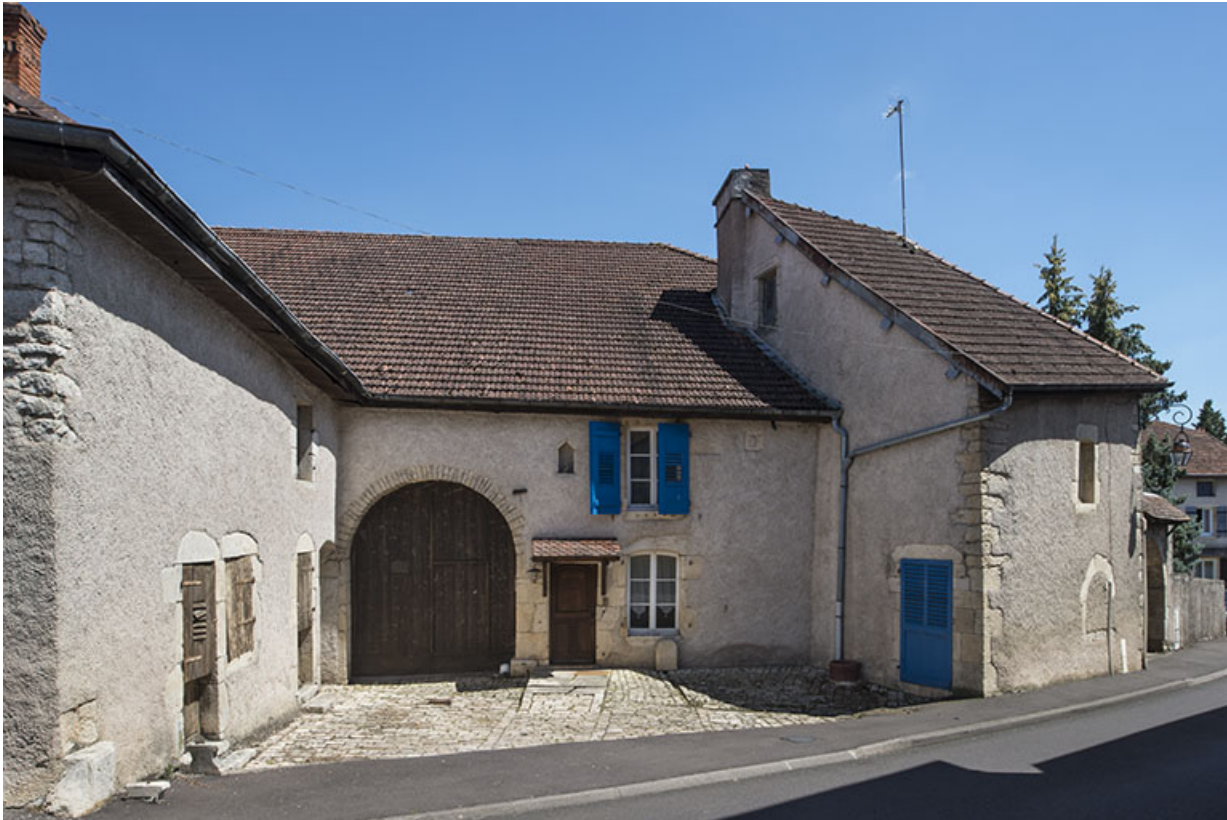
La façade antérieure et la cour.

70, Scey-sur-Saône-et-Saint-Albin, 8 rue de l' Église