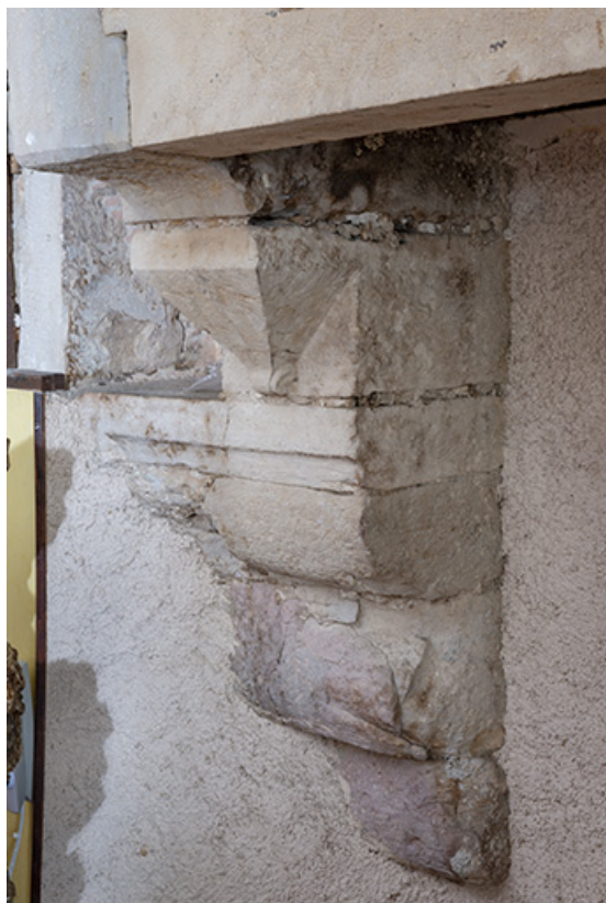
Console supportant la cheminée.

70, Scey-sur-Saône-et-Saint-Albin, 8 rue de l' Église