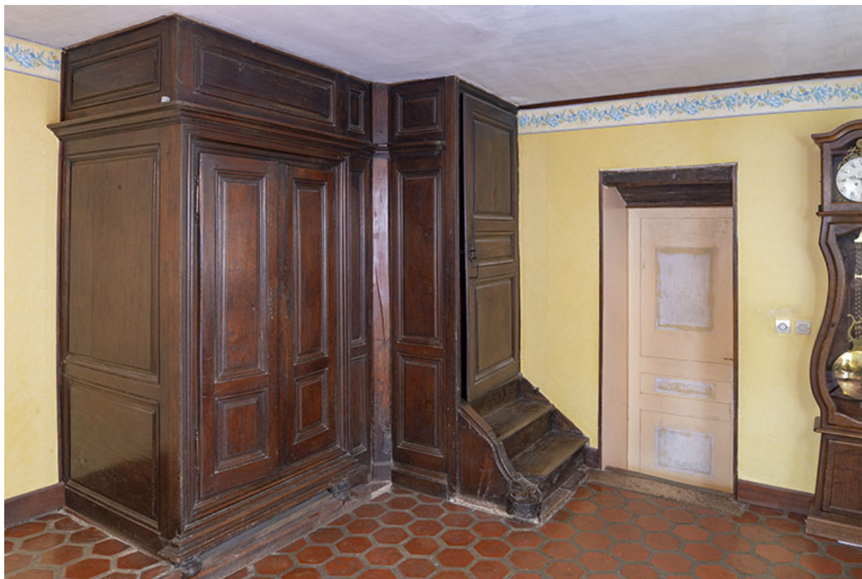
Armoire de la pièce principale.

70, Sceaux-sur-Saône-et-Saint-Albin, 8 rue de l'Église