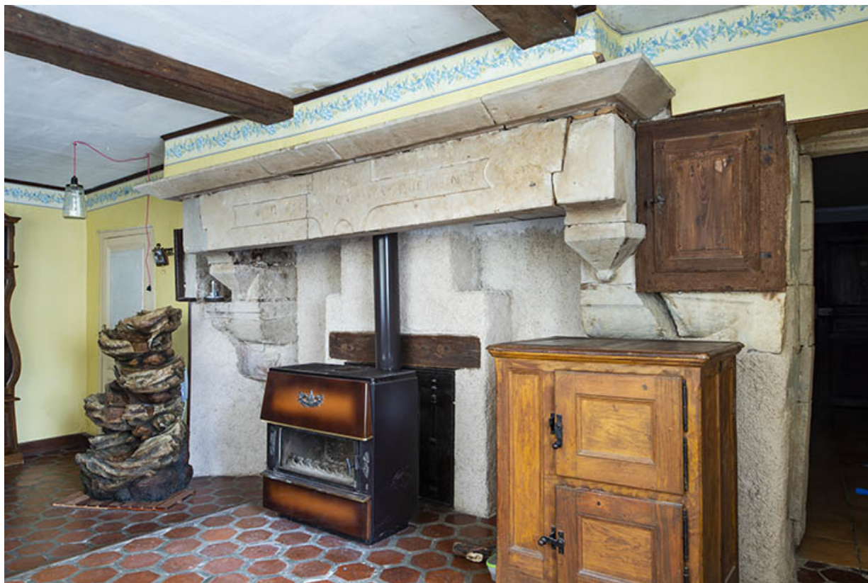
La cheminée de la pièce principale.

70, Scey-sur-Saône-et-Saint-Albin, 8 rue de l' Église