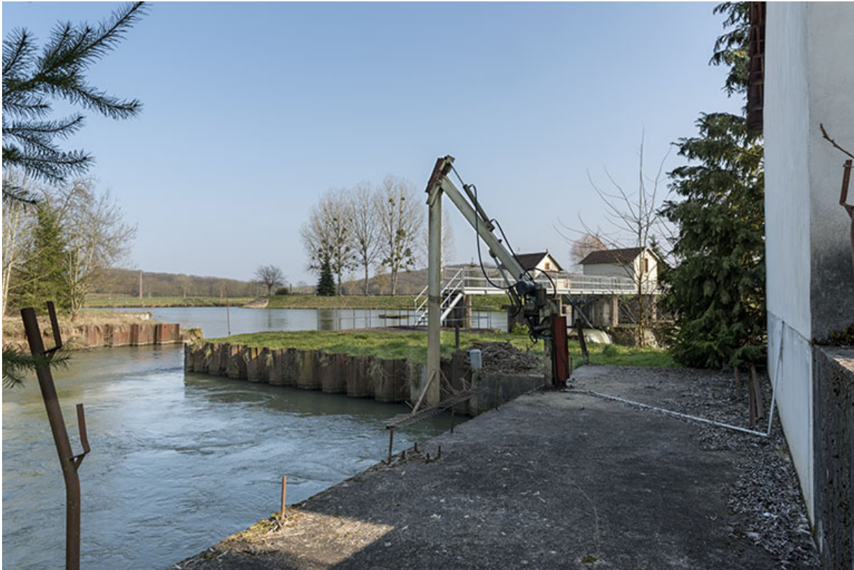
Outil situé au niveau de la centrale hydroélectrique.