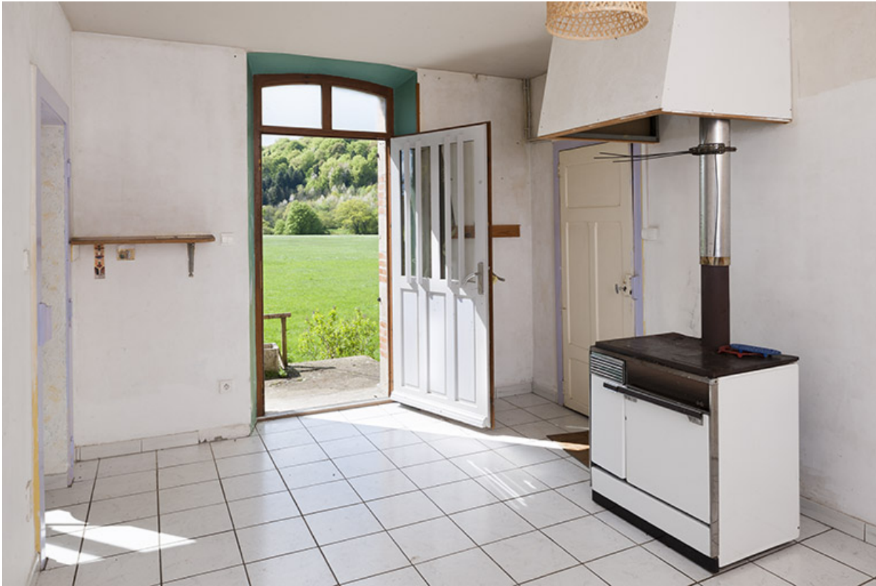
Cuisine et salle à manger, maison du barragiste.