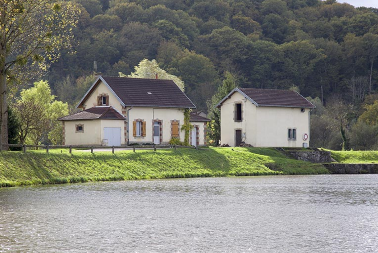
Maison du barragiste et le magasin à aiguilles.