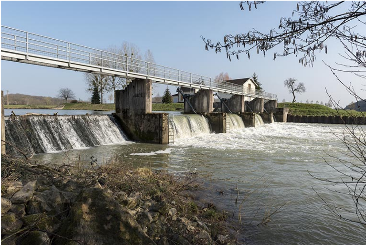
Le barrage mobile de Montureux-lès-Baulay.