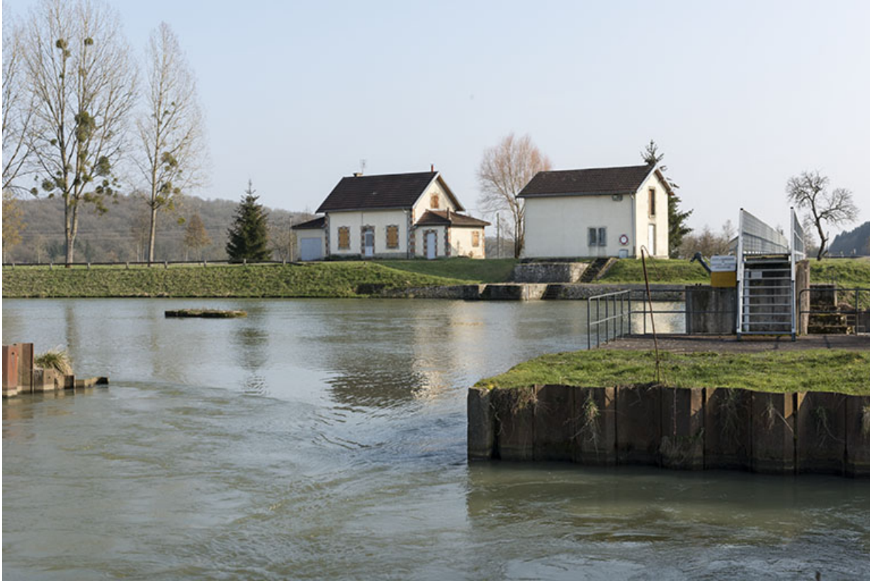
Vue du site du barrage depuis la rive sur la commune de Gevigney-et-Mercey.