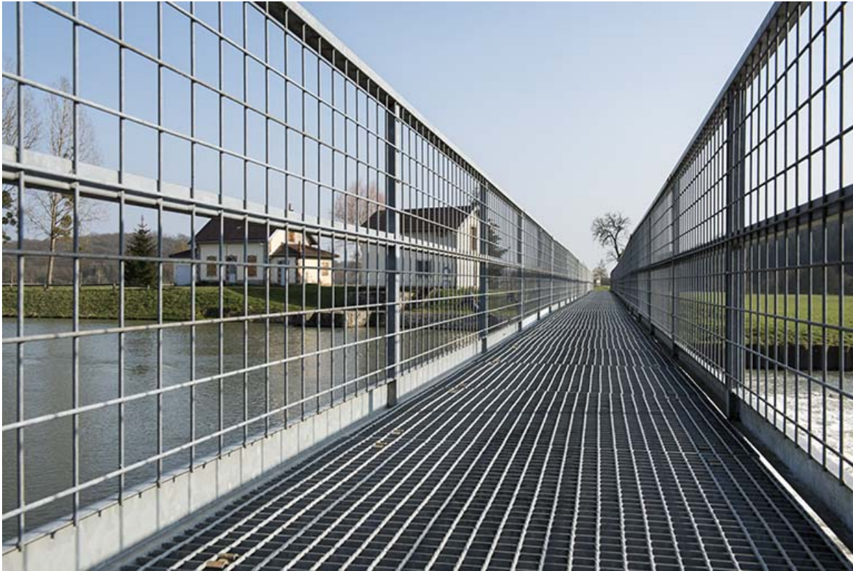
Passerelle du barrage.