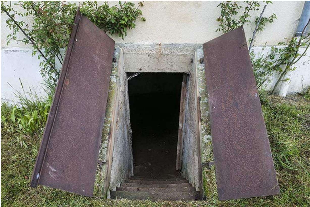
Porte d'accès à la cave, maison du barragiste.