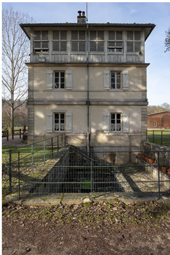
Façade sud-ouest avec le lavoir.

70, Scey-sur-Saône-et-Saint-Albin rue de Saint-Albin, lieudit : Bois du prince de Bauffremont