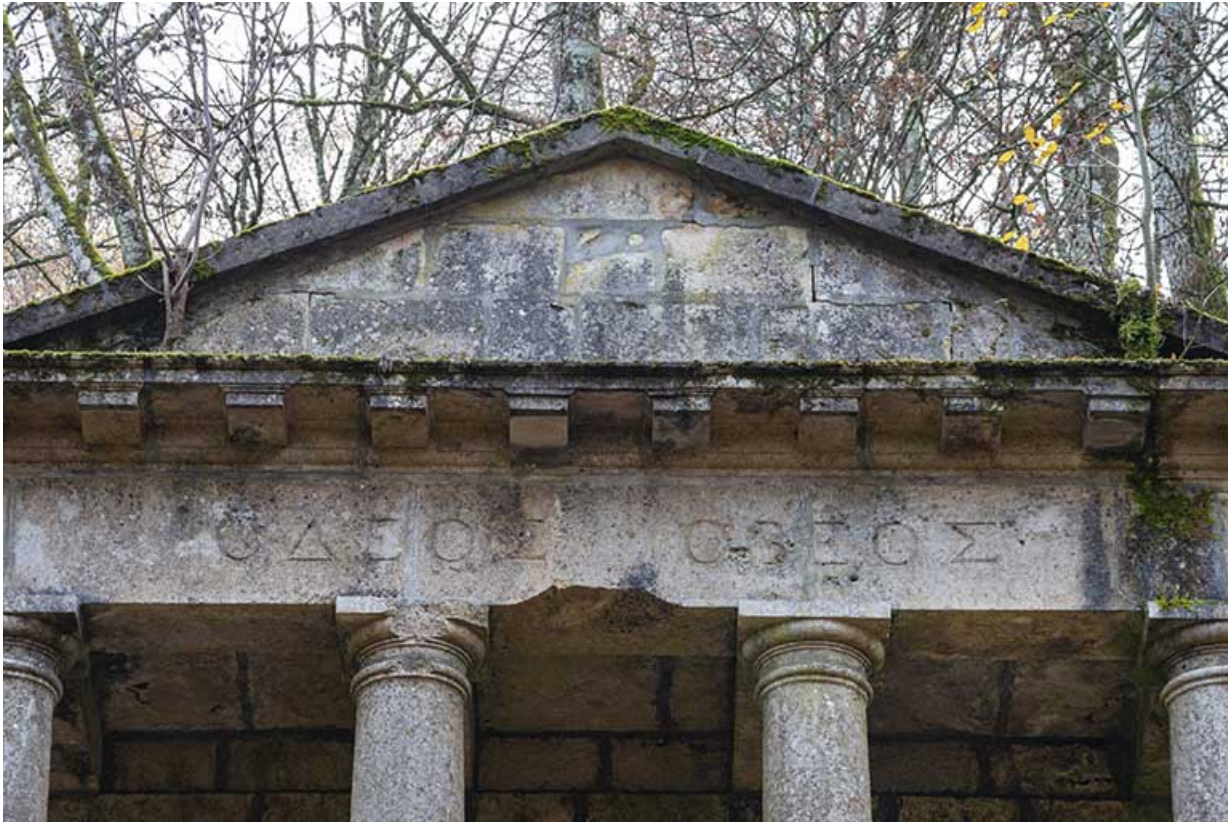
Inscription « ΟΔΕΟΣ ΟΒΕΟΣ » sur la frise.

70, Scey-sur-Saône-et-Saint-Albin rue de Saint-Albin, lieudit : Bois du prince de Bauffremont