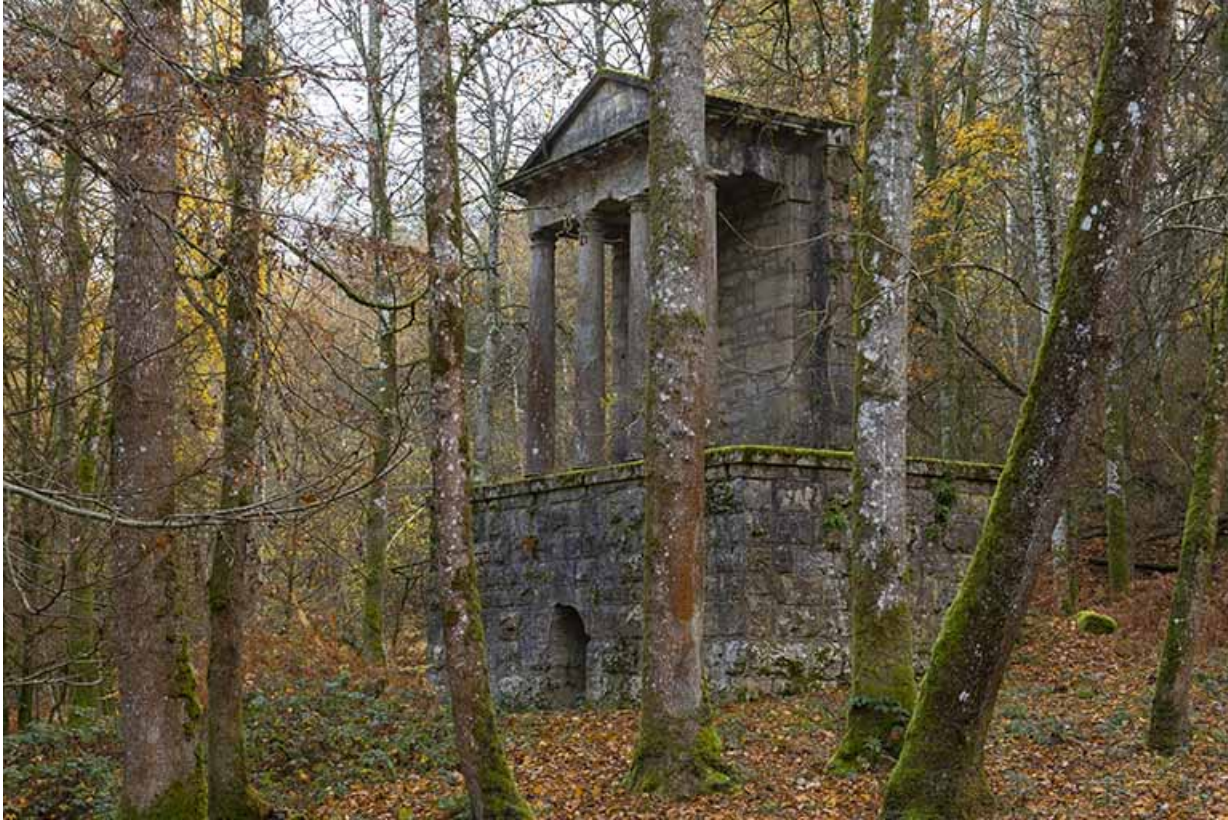
Vue d'ensemble, dans le parc du château.

70, Sceaux-sur-Saône-et-Saint-Albin rue de Saint-Albin, lieudit : Bois du prince de Bauffremont