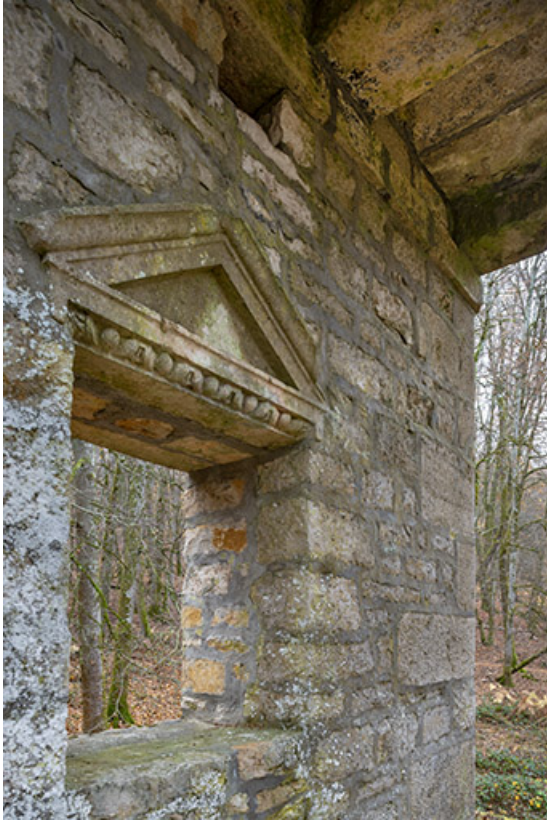
Baie et fronton donnant sur le pronaos.

70, Sceaux-sur-Saône-et-Saint-Albin rue de Saint-Albin, lieudit : Bois du prince de Bauffremont