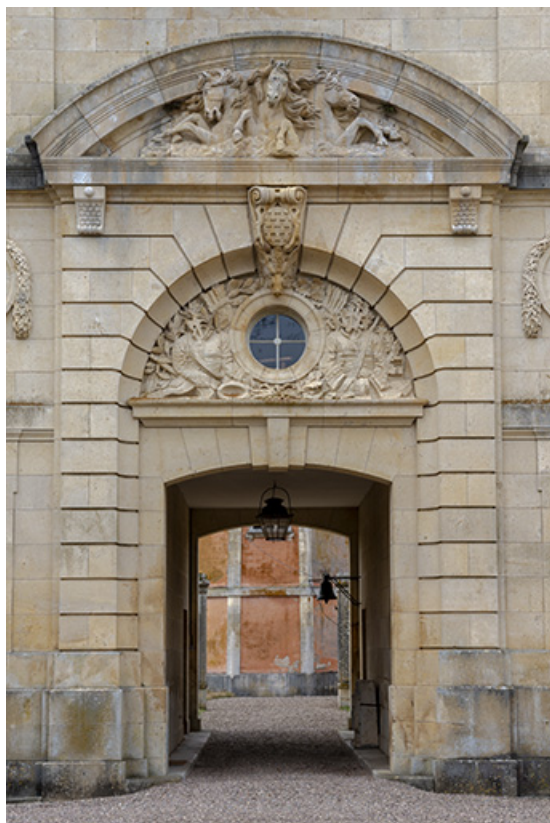
Portail à porte cochère du pavillon central.

70, Scey-sur-Saône-et-Saint-Albin rue de Saint-Albin, lieudit : Bois du prince de Bauffremont