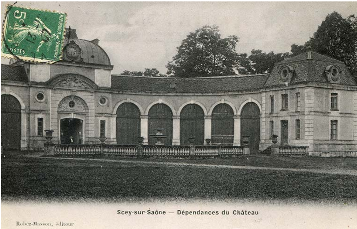
Façade orientale de l'écurie, vue ancienne, avant l'obturation des arcades.

70, Scey-sur-Saône-et-Saint-Albin rue de Saint-Albin, lieudit : Bois du prince de Bauffremont