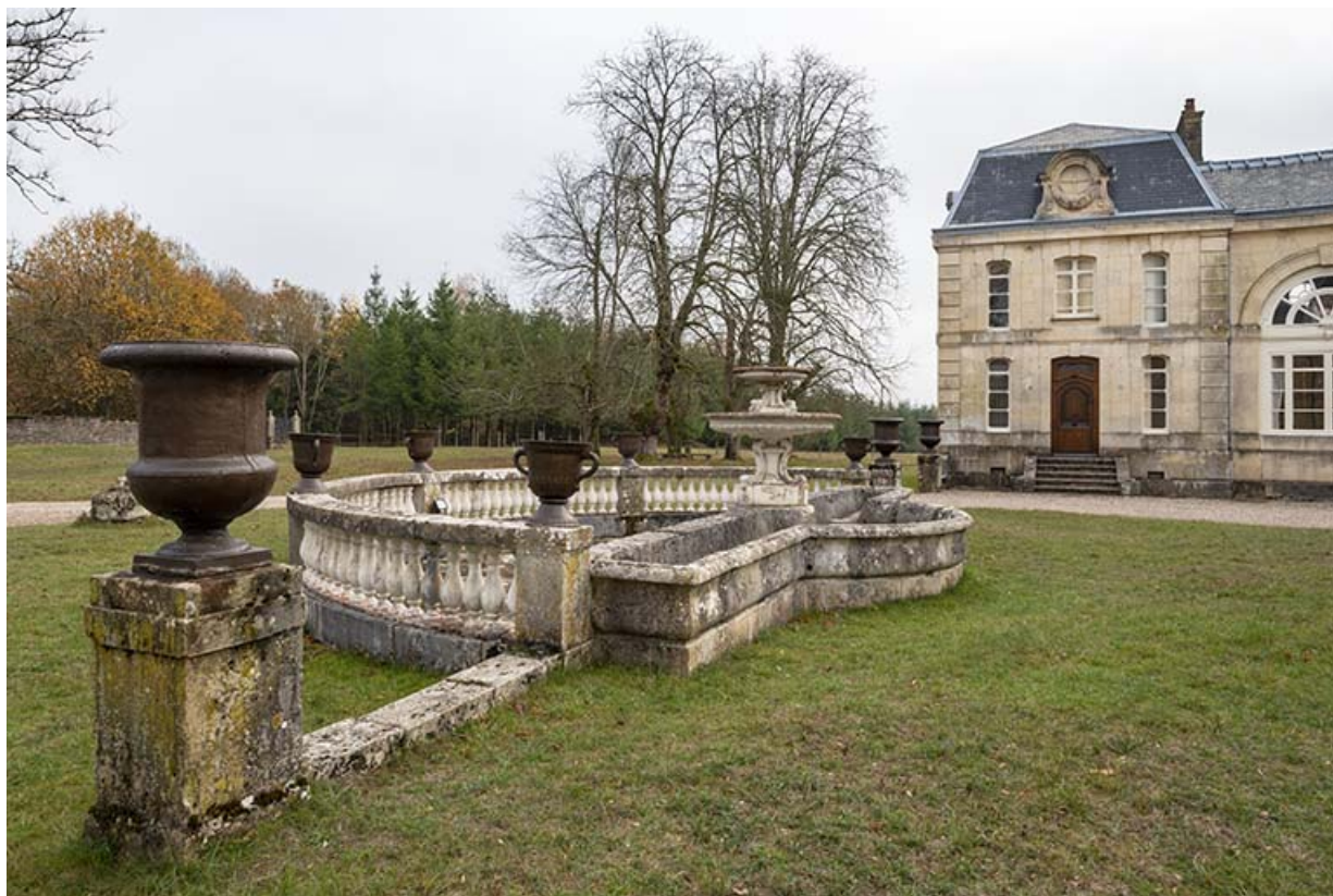
Fontaine et abreuvoir dans la cour de l'écurie, vue depuis le nord.

70, Scey-sur-Saône-et-Saint-Albin rue de Saint-Albin, lieudit : Bois du prince de Bauffremont