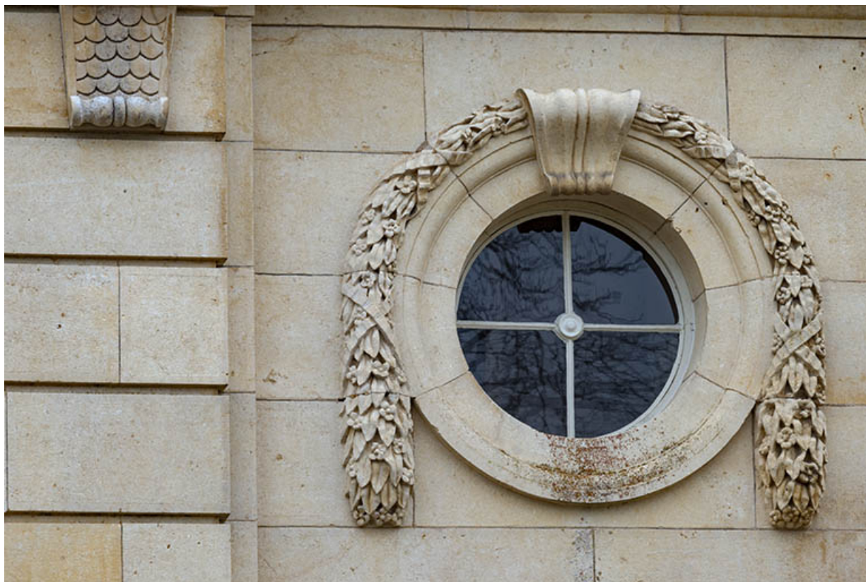
Oculus, agrafe en forme de console et queue de mouton enrubannée.

70, Scey-sur-Saône-et-Saint-Albin rue de Saint-Albin, lieudit : Bois du prince de Bauffremont