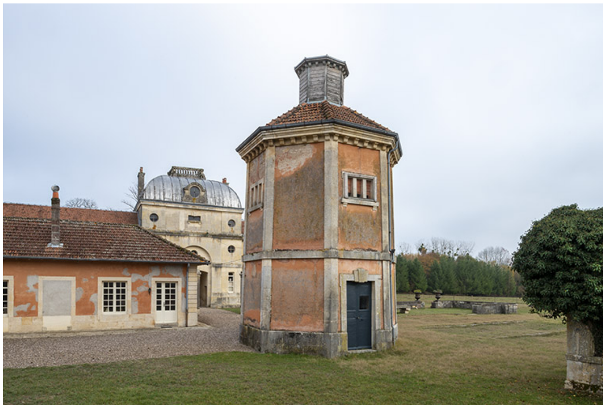
Pigeonnier, vue depuis le nord-ouest.

70, Scey-sur-Saône-et-Saint-Albin rue de Saint-Albin, lieudit : Bois du prince de Bauffremont