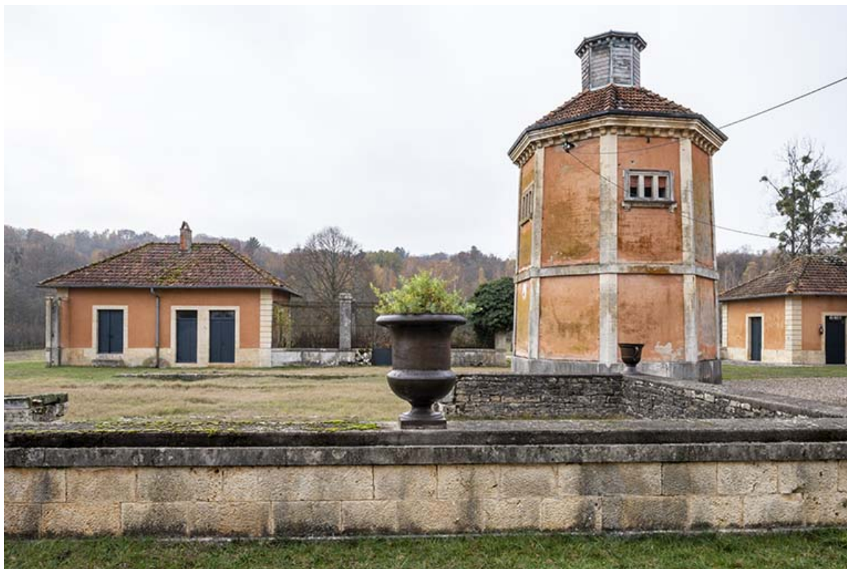
Pigeonnier, vue depuis l'est.

70, Sceaux-sur-Saône-et-Saint-Albin rue de Saint-Albin, lieudit : Bois du prince de Bauffremont