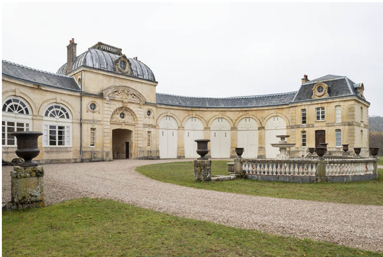
Élévation du pavillon central, de l'aile gauche et du pavillon de droite sur la cour.

70, Sceaux-sur-Saône-et-Saint-Albin rue de Saint-Albin, lieudit : Bois du prince de Bauffremont