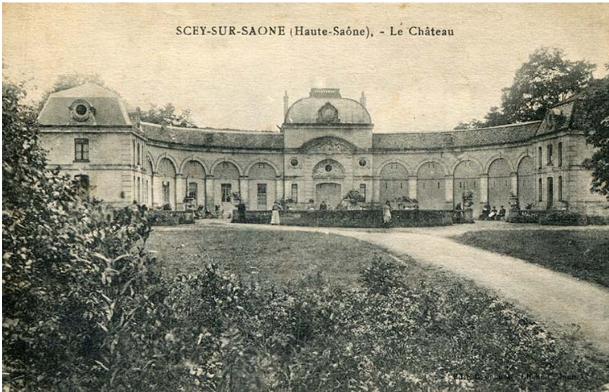
Façade orientale de l'écurie, vue ancienne, après l'obturation des arcades.

70, Scey-sur-Saône-et-Saint-Albin rue de Saint-Albin, lieudit : Bois du prince de Bauffremont