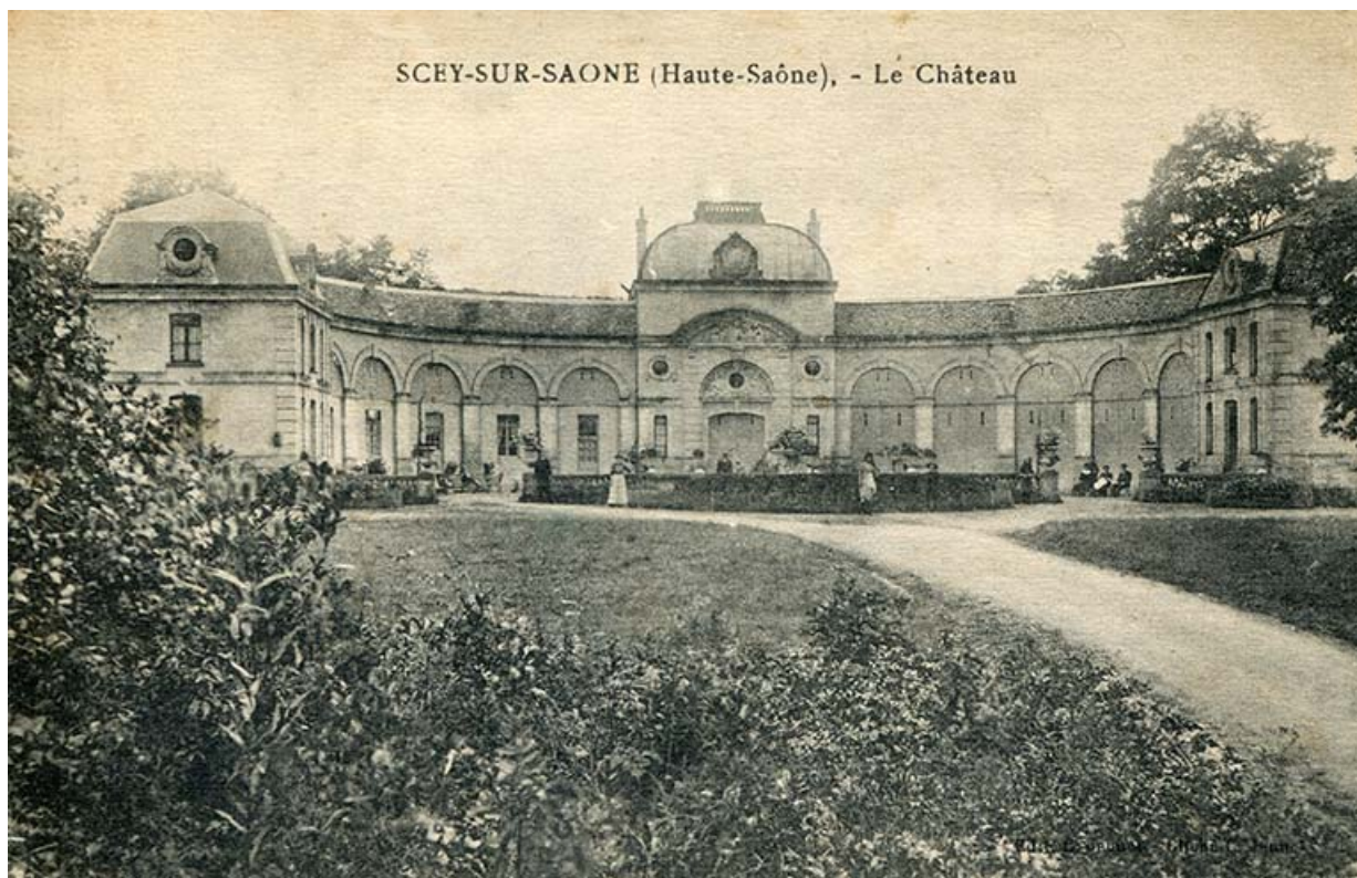
Façade orientale de l'écurie, vue ancienne, après l'obturation des arcades.

70, Scey-sur-Saône-et-Saint-Albin rue de Saint-Albin, lieudit : Bois du prince de Bauffremont