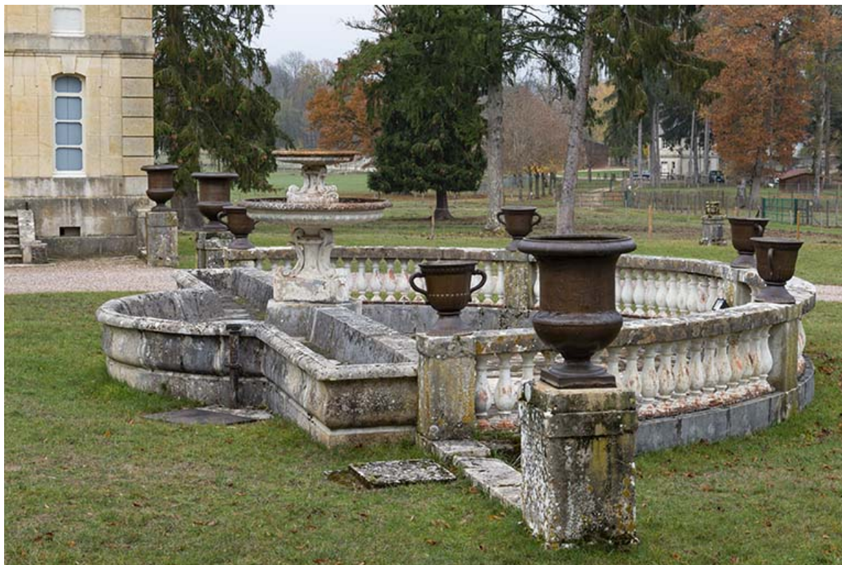
Fontaine et abreuvoir dans la cour de l'écurie, vue depuis le sud.

70, Sceaux-sur-Saône-et-Saint-Albin rue de Saint-Albin, lieudit : Bois du prince de Bauffremont