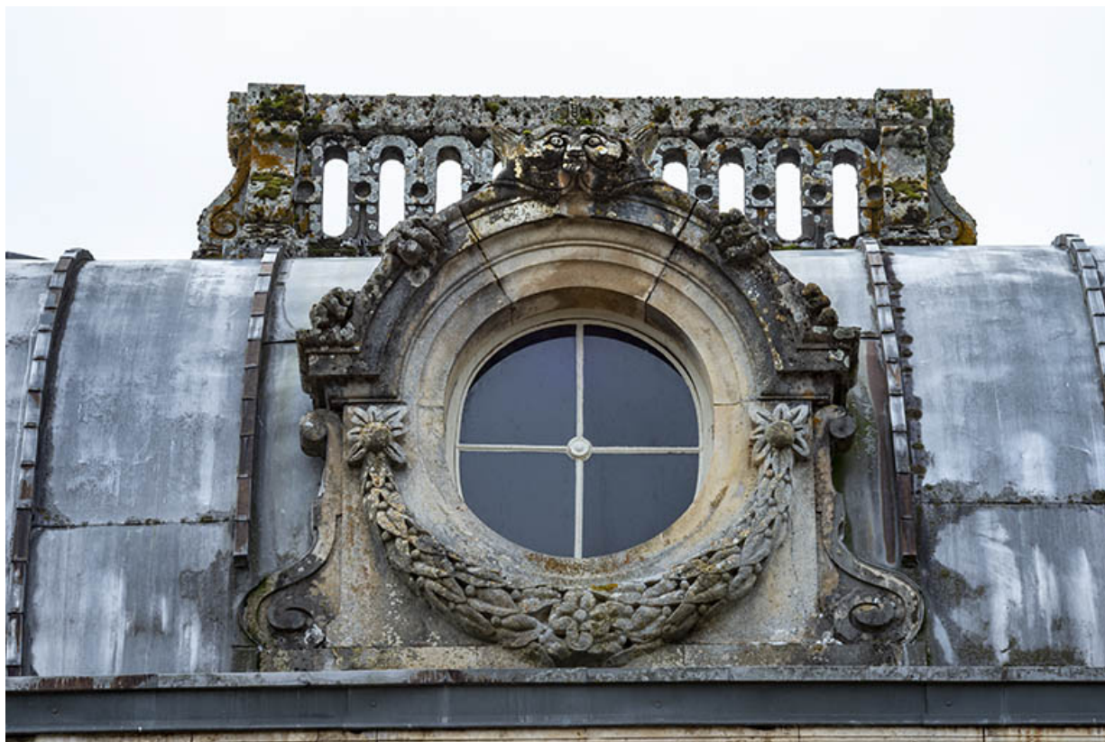
Lucarne percée d'un oculus et ornée de deux volutes, d'une guirlande et d'un félin.

70, Scey-sur-Saône-et-Saint-Albin rue de Saint-Albin, lieudit : Bois du prince de Bauffremont