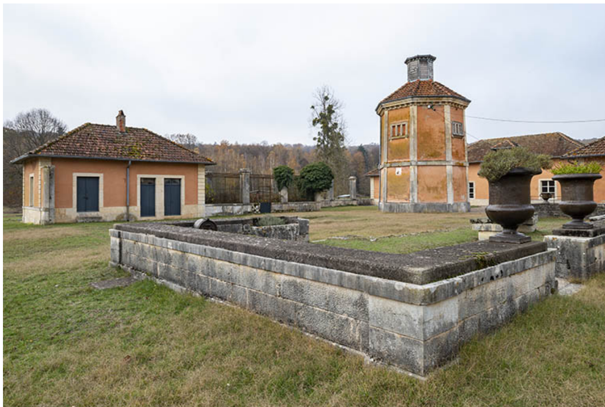
Dépendances et pigeonnier, vue d'ensemble depuis le sud-est.

70, Sceaux-sur-Saône-et-Saint-Albin rue de Saint-Albin, lieudit : Bois du prince de Bauffremont