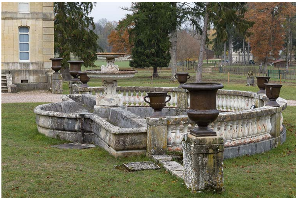
Fontaine et abreuvoir dans la cour de l'écurie, vue depuis le sud.

70, Sceaux-sur-Saône-et-Saint-Albin rue de Saint-Albin, lieudit : Bois du prince de Bauffremont