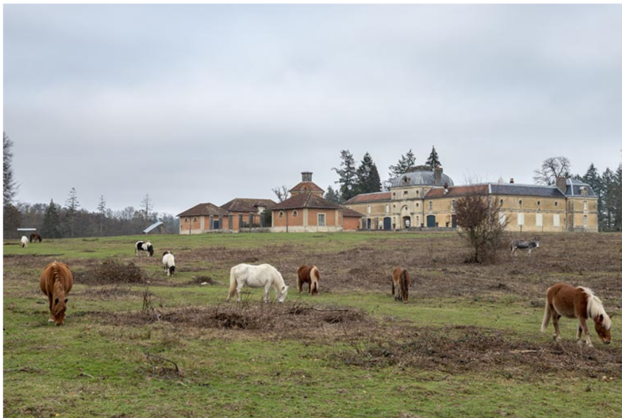
Vue d'ensemble depuis le parc, vers le nord-est.

70, Sceaux-sur-Saône-et-Saint-Albin rue de Saint-Albin, lieudit : Bois du prince de Bauffremont