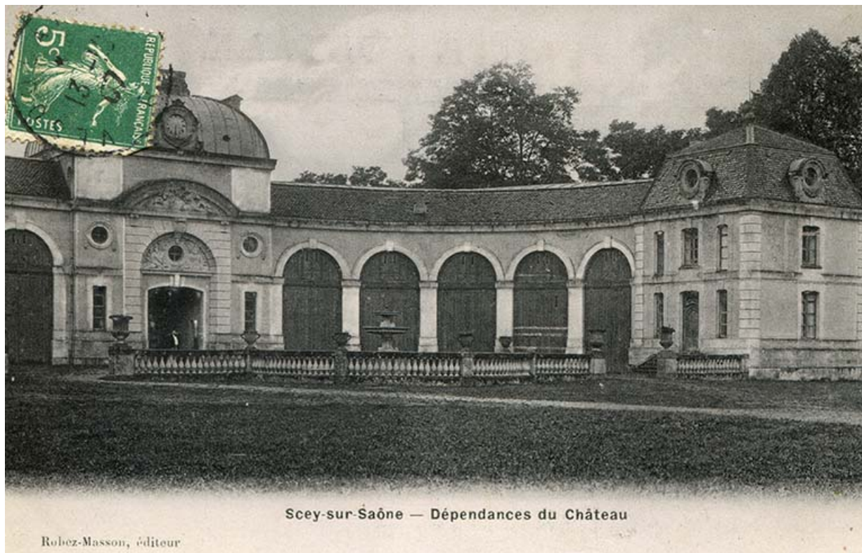
Façade orientale de l'écurie, vue ancienne, avant l'obturation des arcades.

70, Scey-sur-Saône-et-Saint-Albin rue de Saint-Albin, lieudit : Bois du prince de Bauffremont