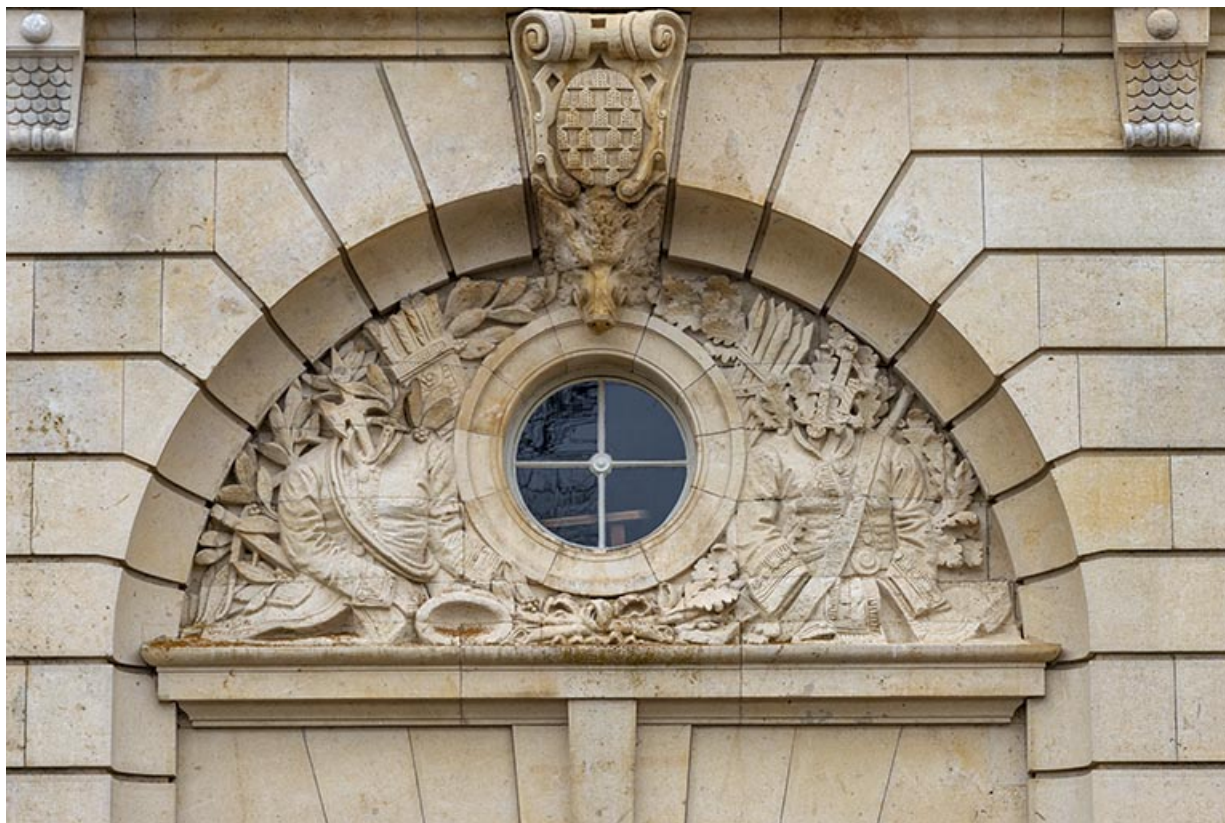
Tympan percé d'un oculus et orné d'un relief représentant un trophée de chasse.

70, Sceaux-sur-Saône-et-Saint-Albin rue de Saint-Albin, lieudit : Bois du prince de Bauffremont