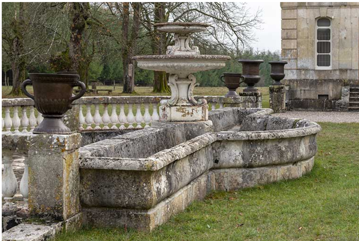
Fontaine et abreuvoir dans la cour de l'écurie, vue depuis le nord.

70, Sceaux-sur-Saône-et-Saint-Albin rue de Saint-Albin, lieudit : Bois du prince de Bauffremont