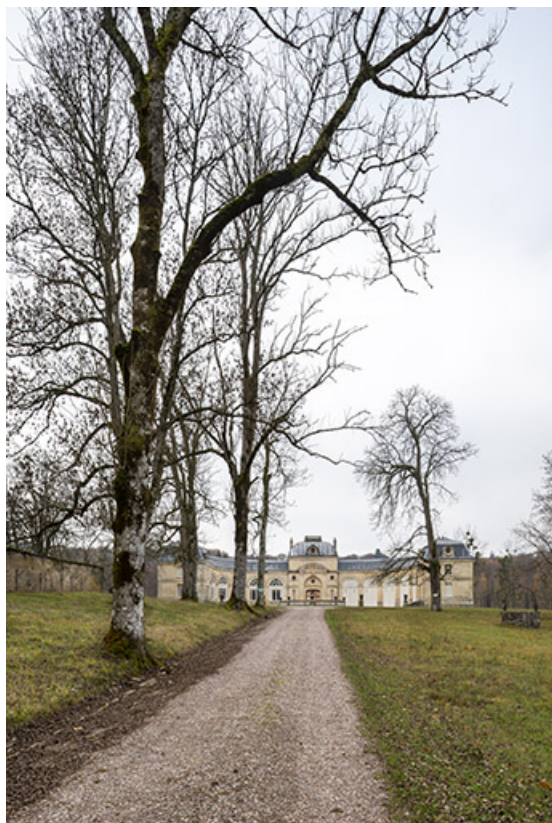
Vue d'ensemble depuis la grille d'entrée, vers l'ouest.

70, Scey-sur-Saône-et-Saint-Albin rue de Saint-Albin, lieudit : Bois du prince de Bauffremont