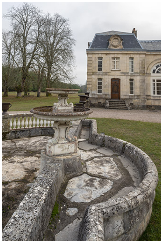
Fontaine et abreuvoir dans la cour de l'écurie, vue depuis le nord.

70, Scey-sur-Saône-et-Saint-Albin rue de Saint-Albin, lieudit : Bois du prince de Bauffremont