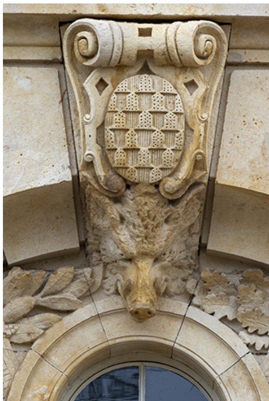
Agrafe à cuir découpé et hure de sanglier, portant les armoiries de la famille de Bauffremont. 70, Scey-sur-Saône-et-Saint-Albin rue de Saint-Albin, lieudit : Bois du prince de Bauffremont