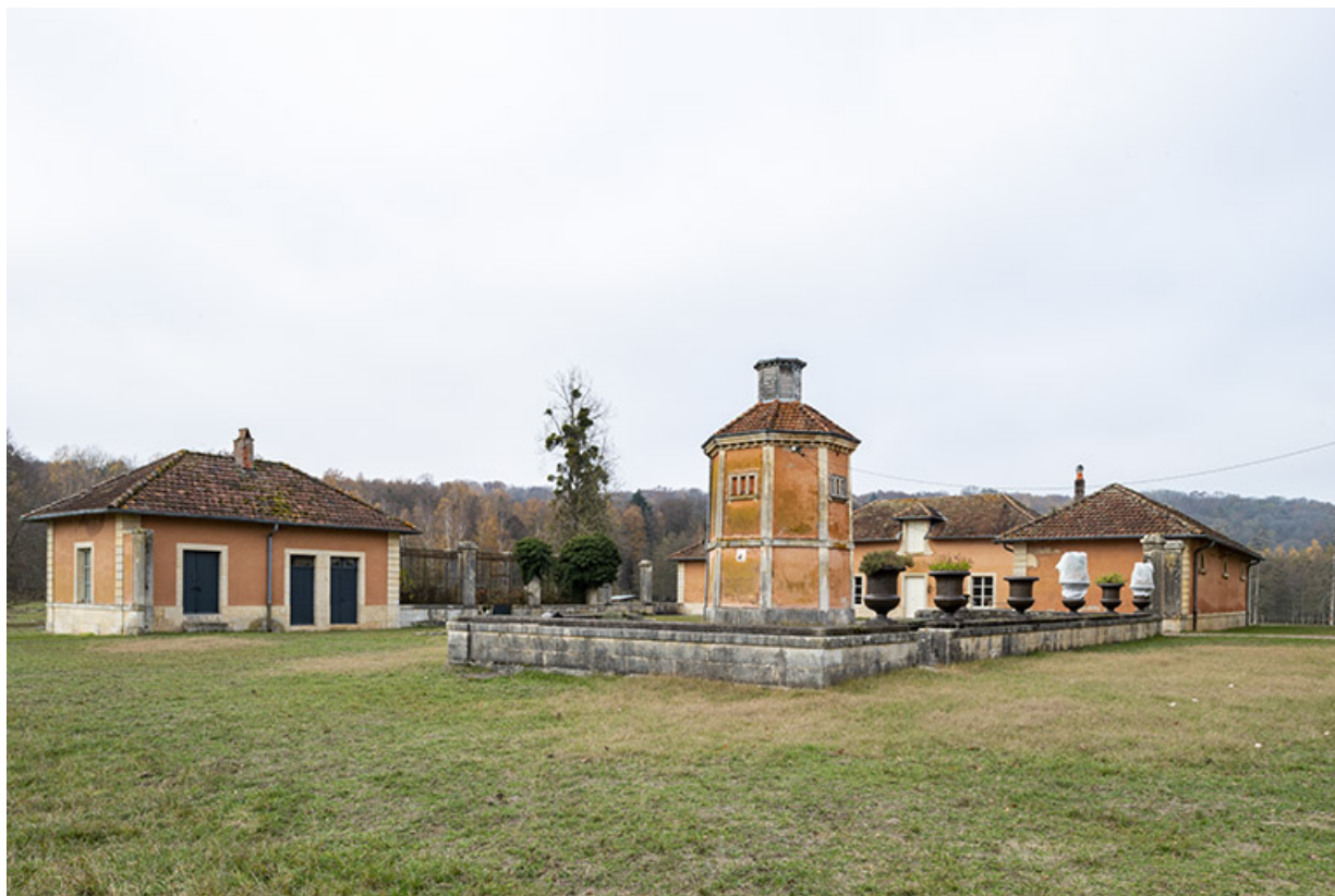
Dépendances et pigeonnier, vue d'ensemble depuis le sud-est.

70, Scey-sur-Saône-et-Saint-Albin rue de Saint-Albin, lieudit : Bois du prince de Bauffremont