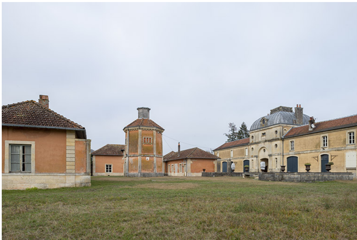
Dépendances et pigeonnier, vue d'ensemble depuis le sud-ouest.

70, Sceaux-sur-Saône-et-Saint-Albin rue de Saint-Albin, lieudit : Bois du prince de Bauffremont