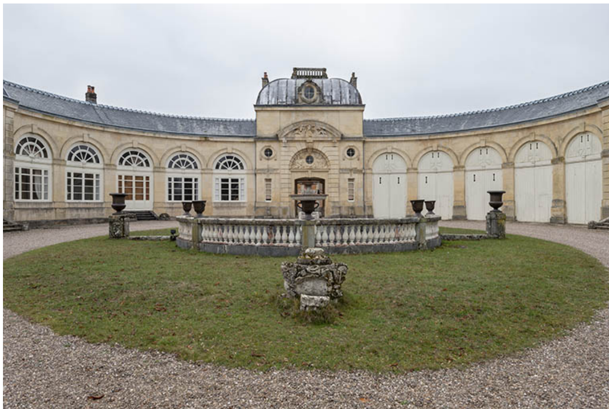
Fontaine et abreuvoir dans la cour de l'écurie, vue d'ensemble.

70, Sceaux-sur-Saône-et-Saint-Albin rue de Saint-Albin, lieudit : Bois du prince de Bauffremont