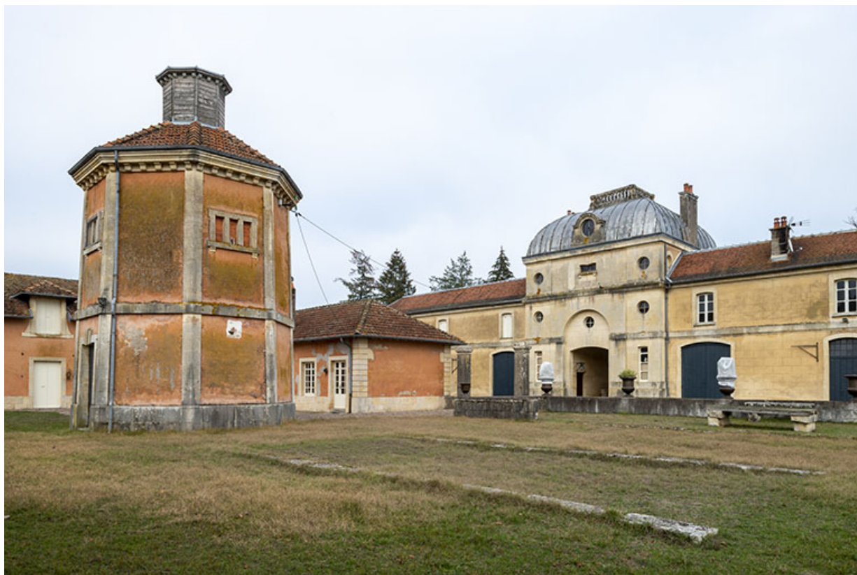
Pigeonnier, vue depuis le sud-ouest.

70, Sceaux-sur-Saône-et-Saint-Albin rue de Saint-Albin, lieudit : Bois du prince de Bauffremont