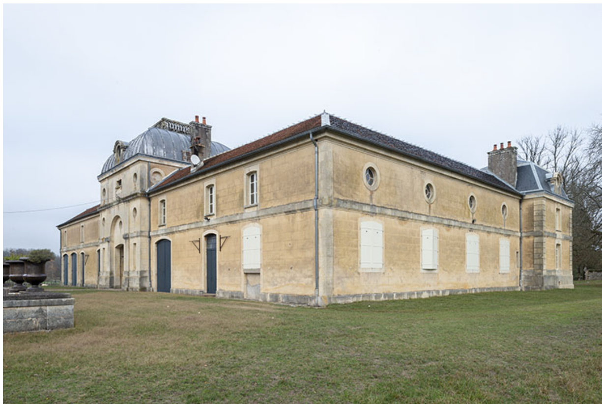
Façade ouest et façade sud de l'écurie.

70, Sceaux-sur-Saône-et-Saint-Albin rue de Saint-Albin, lieudit : Bois du prince de Bauffremont