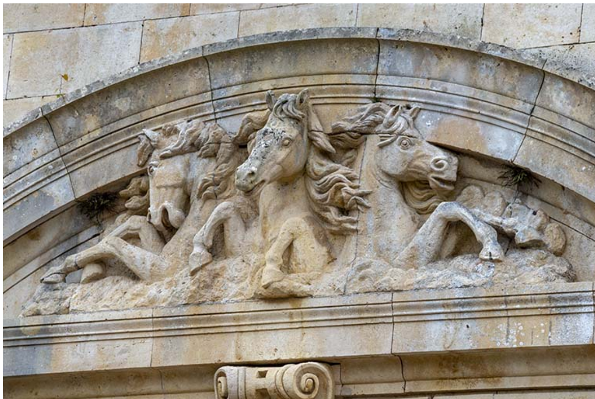
Fronton cintré orné d'un haut-relief représentant trois chevaux, vue de trois-quarts.

70, Sceaux-sur-Saône-et-Saint-Albin rue de Saint-Albin, lieudit : Bois du prince de Bauffremont