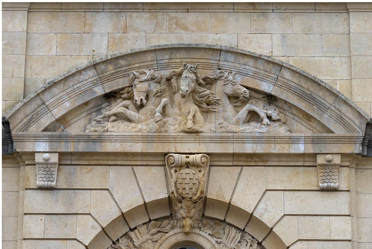
Fronton cintré orné d'un haut-relief représentant trois chevaux, vue de face.

70, Sceaux-sur-Saône-et-Saint-Albin rue de Saint-Albin, lieudit : Bois du prince de Bauffremont