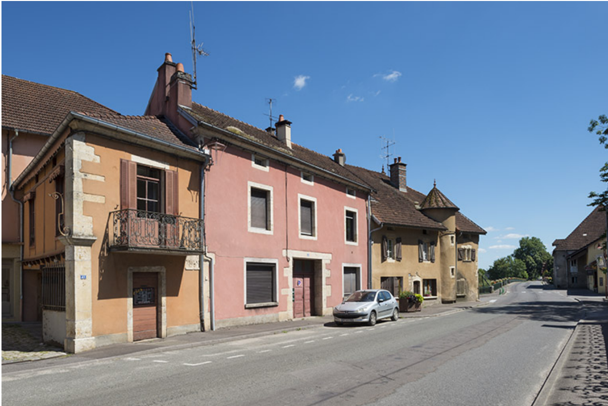
Extrémité sud de la rue Armand Paulmard, en direction du pont sur la Saône. 70, Sceaux-sur-Saône-et-Saint-Albin rue Armand Paulmard, lieudit : le Bourg