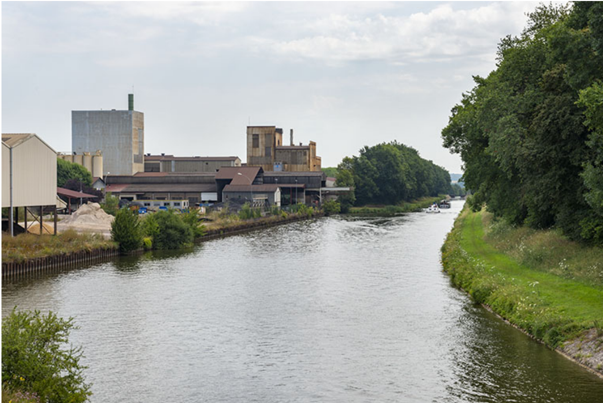
Site industriel situé le long du canal de navigation de Scey-sur-Saône.