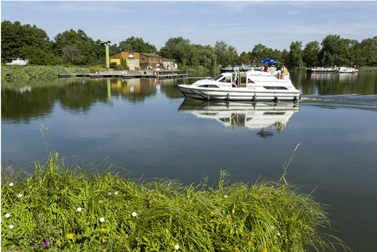
Bateau de plaisance empruntant la dérivation.