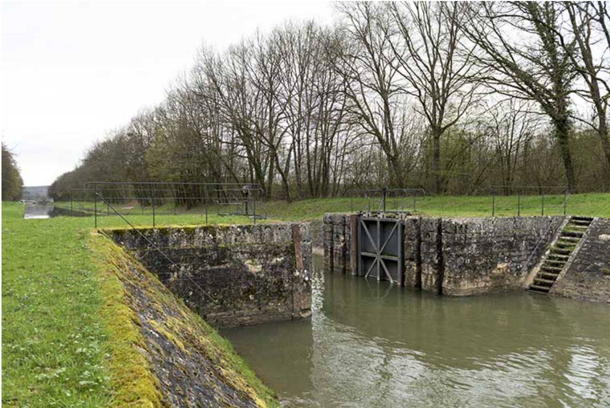
La porte de garde.