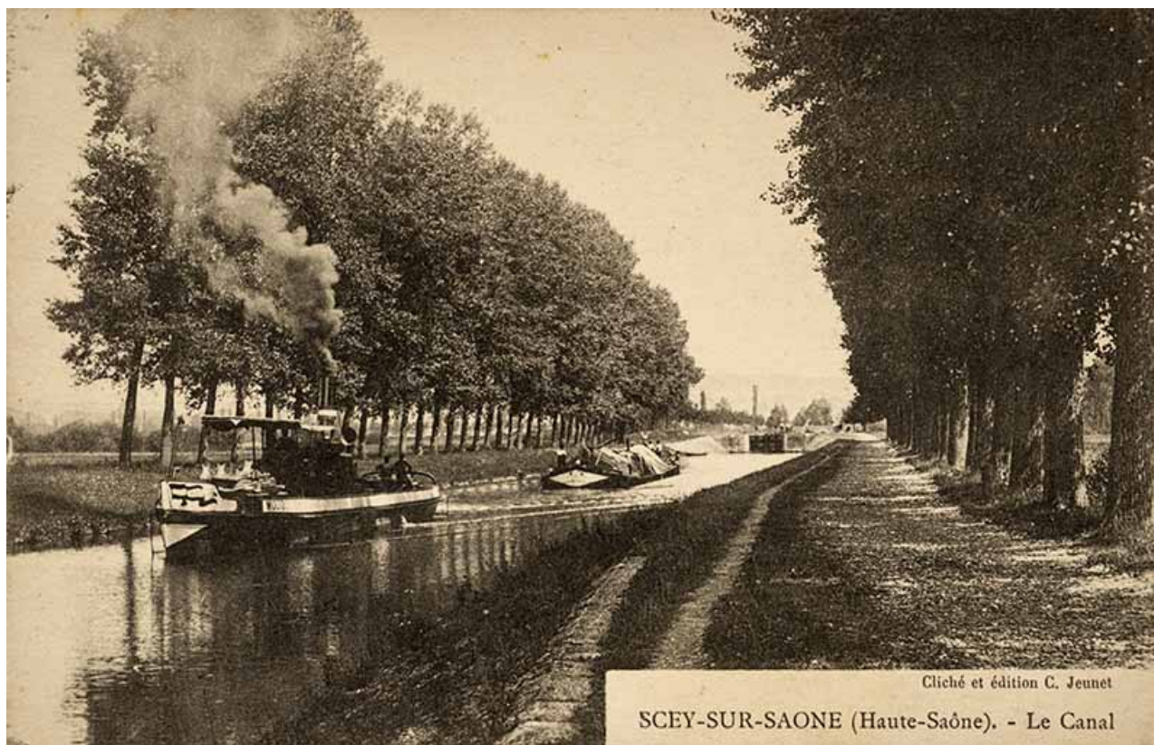
Le canal de navigation, carte postale. 70, Scey-sur-Saône-et-Saint-Albin

Lieu de conservation : Archives départementales de la Haute-Saône, Vesoul - Cote du document : 11Fi482-8