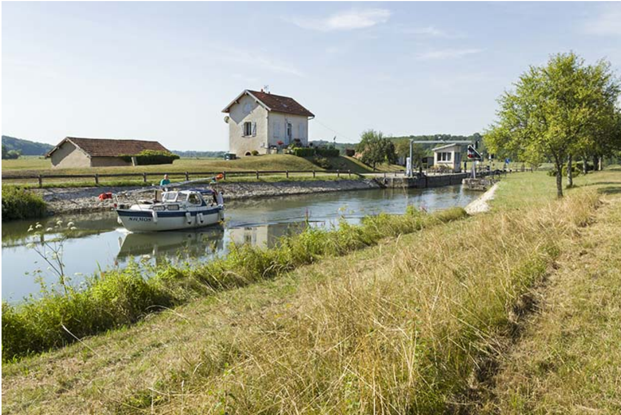
Le site d'écluse de Scey-sur-Saône.