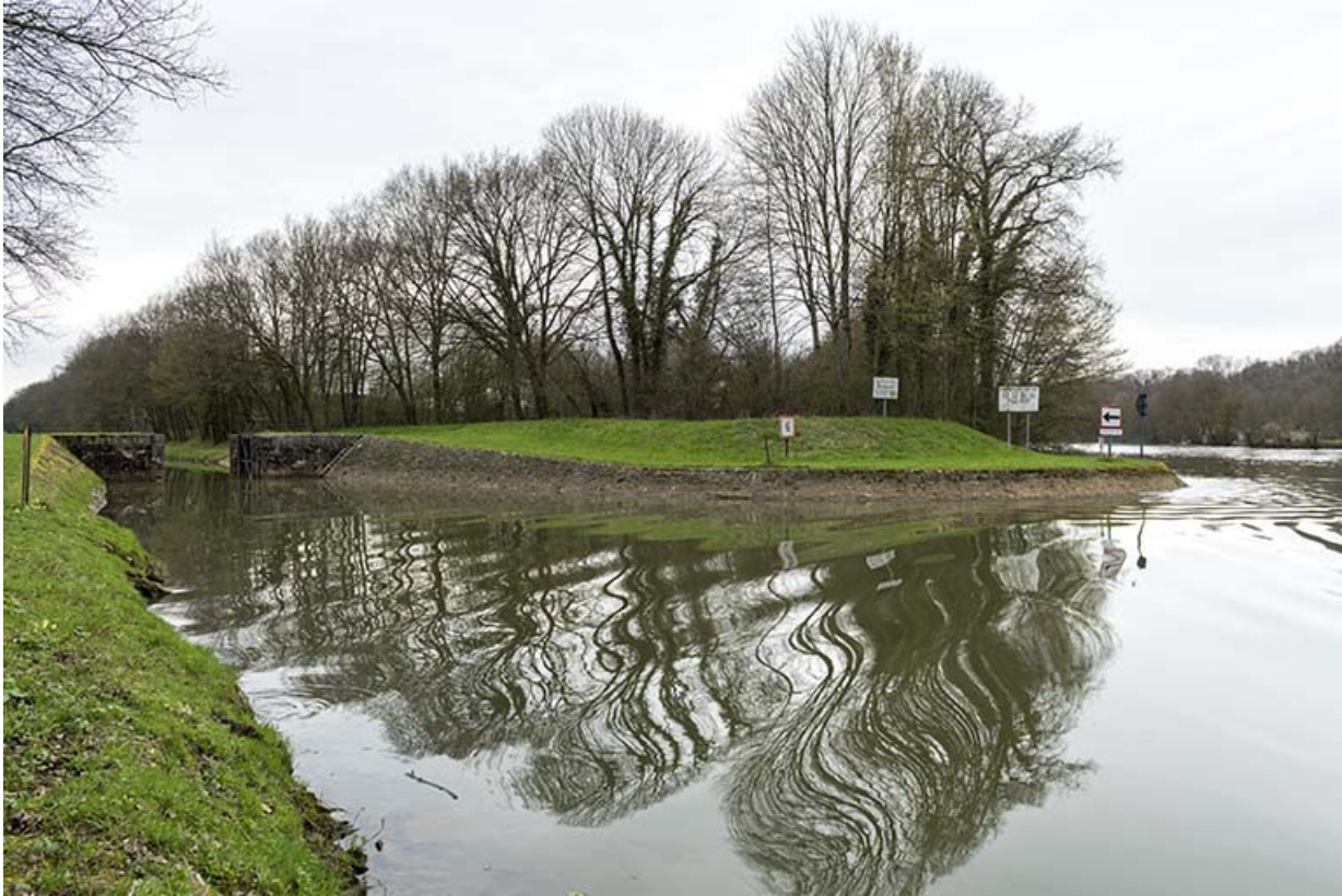
Début de la dérivation éclusée de Sceaux-sur-Saône.