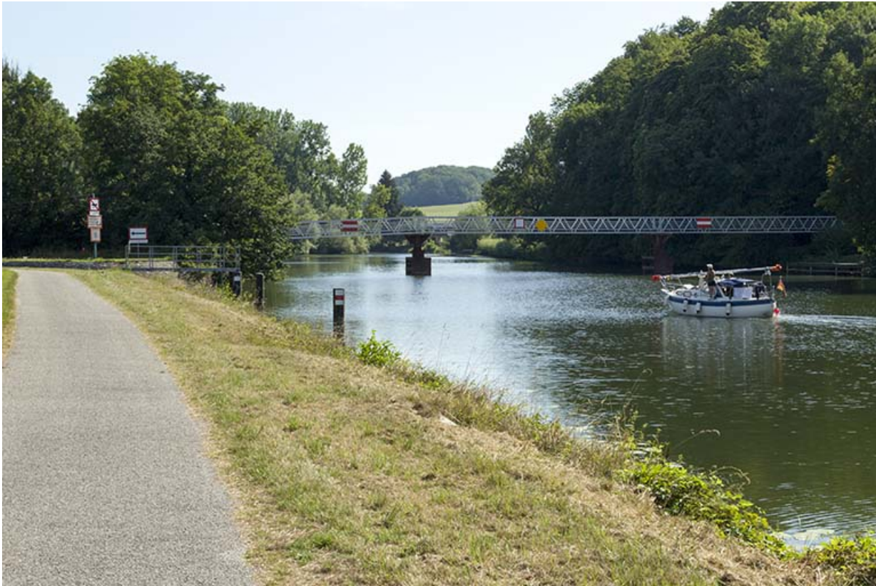
Entrée aval de la dérivation de Chemilly et une passerelle surmontant la Saône. 70, Sceaux-sur-Saône-et-Saint-Albin