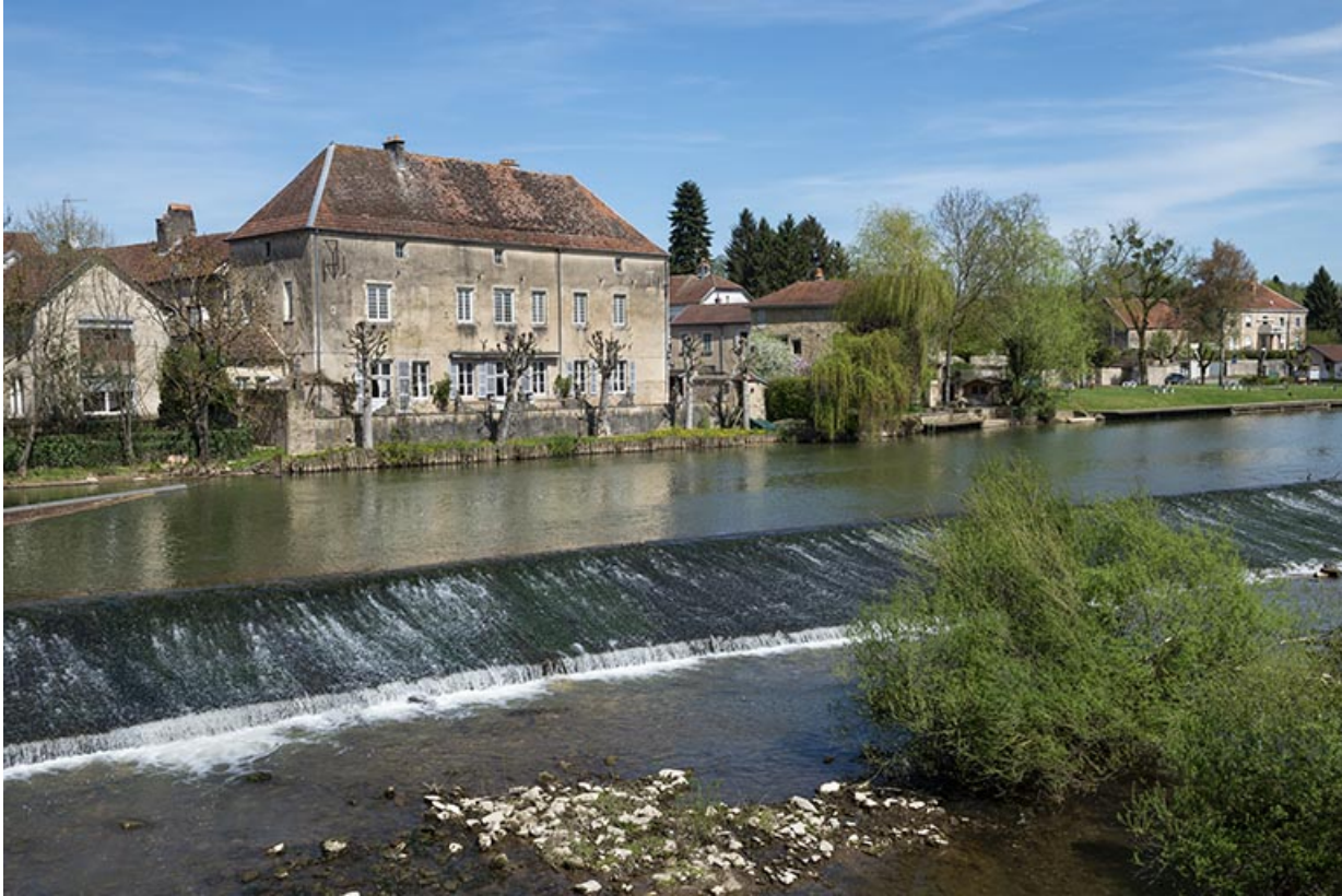
Le barrage dans le méandre de la Saône.

70, Scey-sur-Saône-et-Saint-Albin, 8-10 rue de l' Enfer