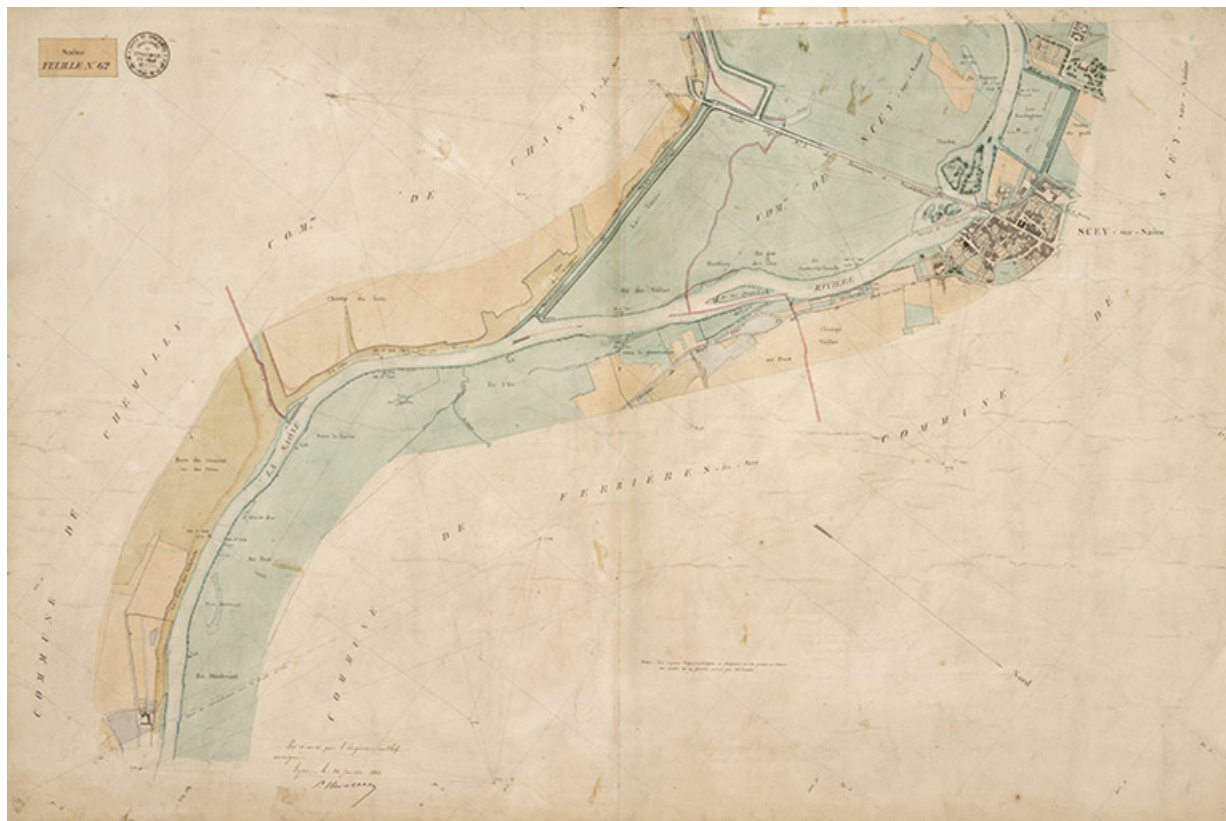
Saône - Feuille n°62.