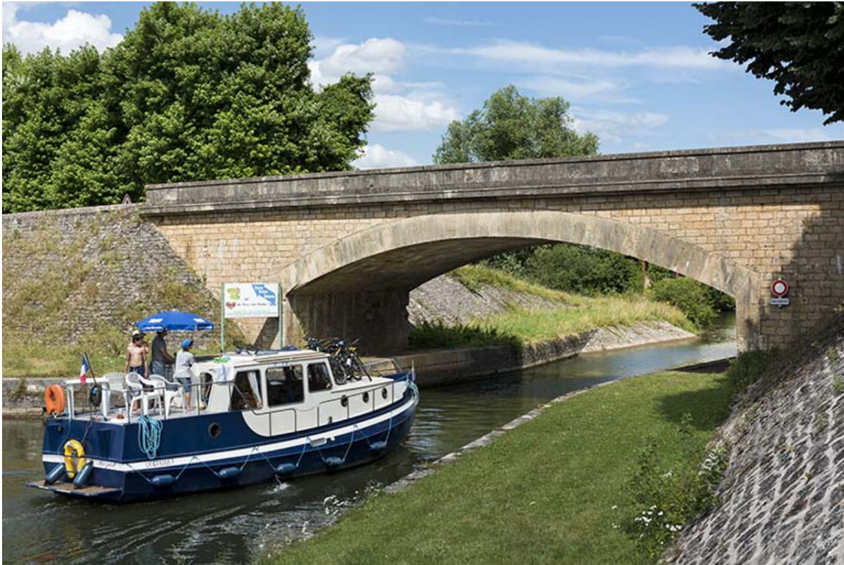
Le pont et son arc surbaissé.