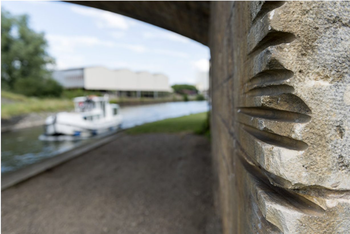
Pile du pont avec l'ancien chemin de halage et un bateau de plaisance remontant la dérivation.