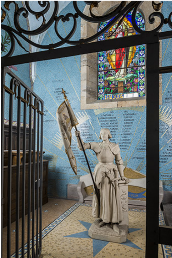
Vue de la statue dans la chapelle.

70, Sceaux-sur-Saône-et-Saint-Albin rue de l' Église