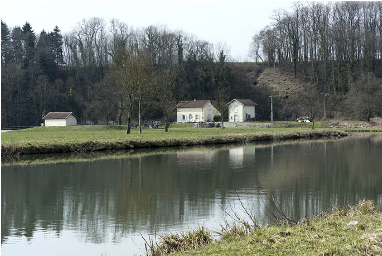
La saône et le site du barrage mobile.