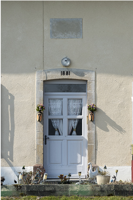
La porte d'entrée de la maison avec sa plaque signalétique. 70, Ormoy