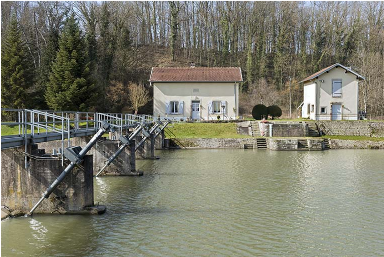
Le barrage et la maison du barragiste.