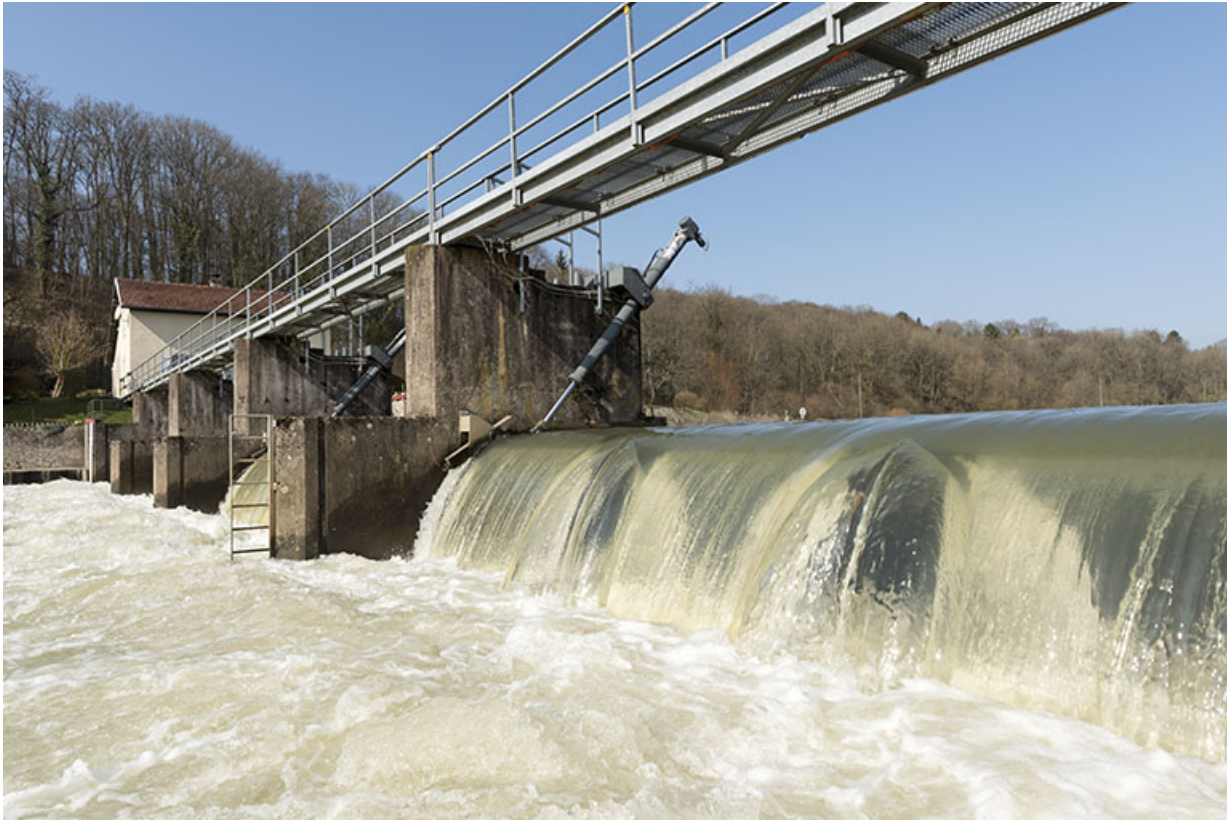
La passerelle du barrage.