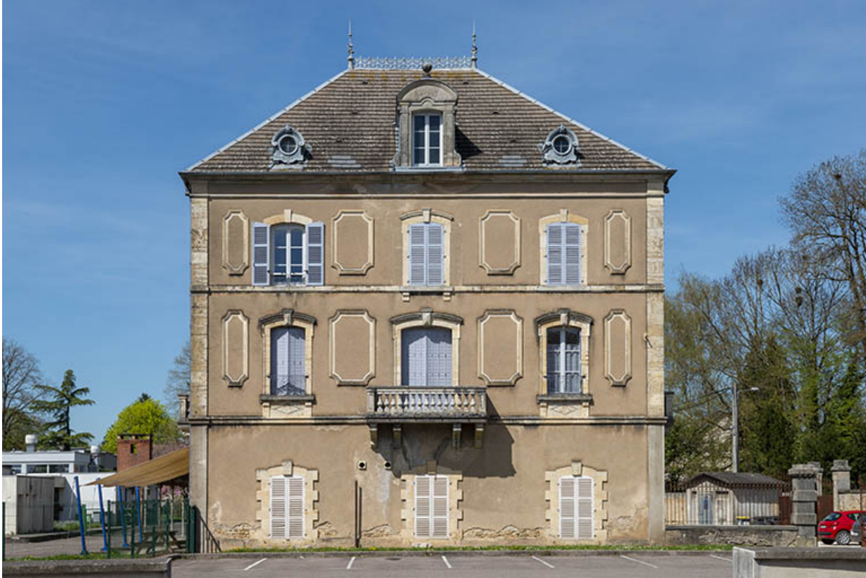
Corps de bâtiment sud, vue de face.

70, Scey-sur-Saône-et-Saint-Albin, 1 rue de Duez