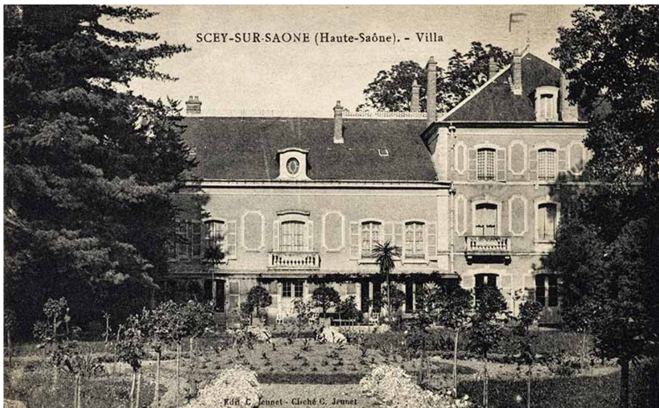
Façade sur le jardin.

70, Sceaux-sur-Saône-et-Saint-Albin, 1 rue de Duez