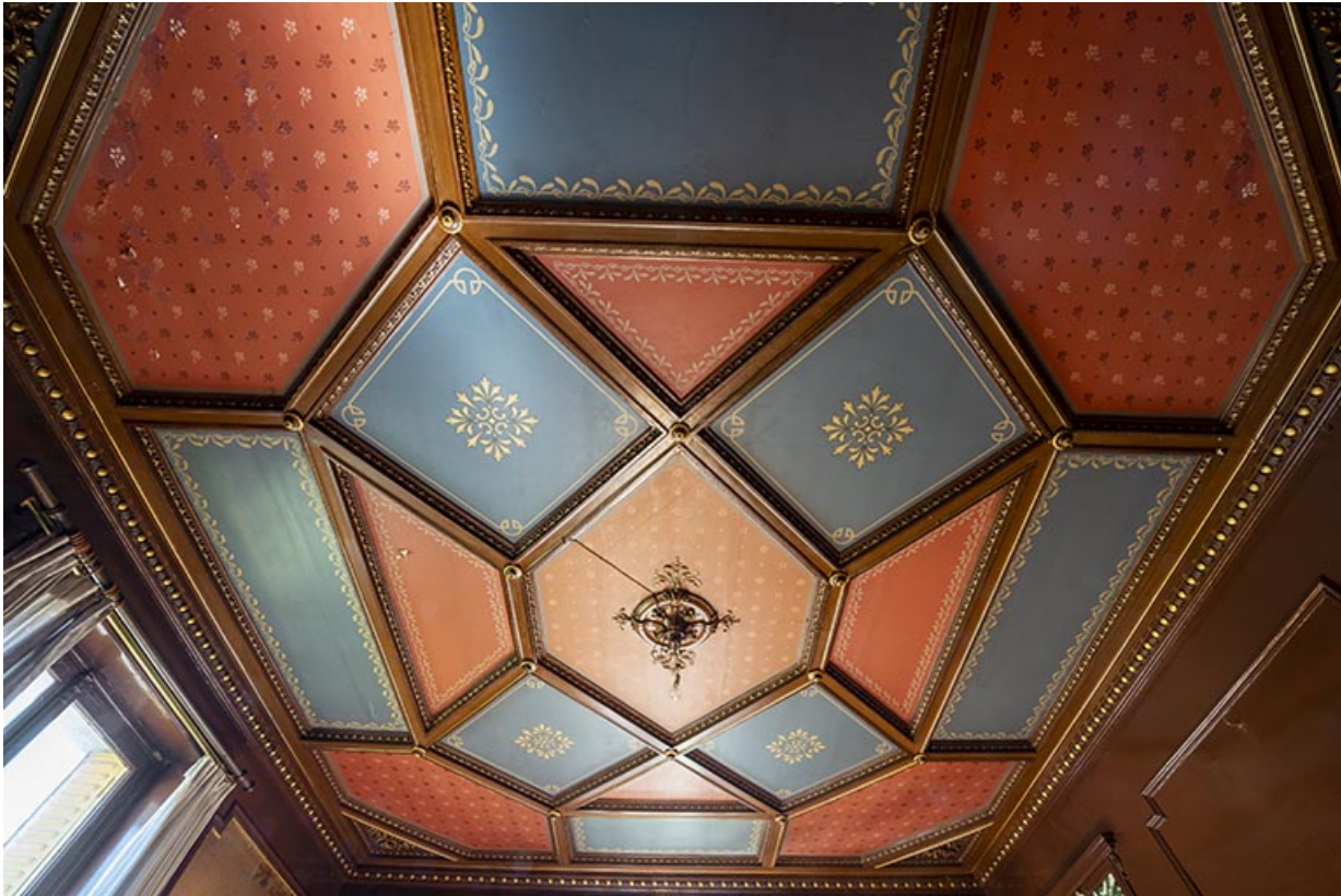
Rez-de-chaussée, grand salon, plafond à compartiments.

70, Scey-sur-Saône-et-Saint-Albin, 1 chemin des Vignes