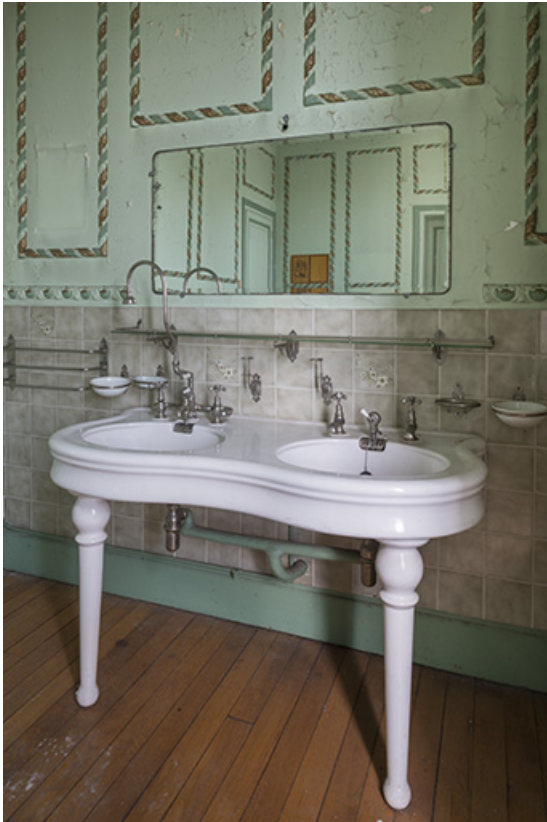
Premier étage, salle d'eau, lavabo à double vasque. 70, Sceaux-sur-Saône-et-Saint-Albin, 1 chemin des Vignes