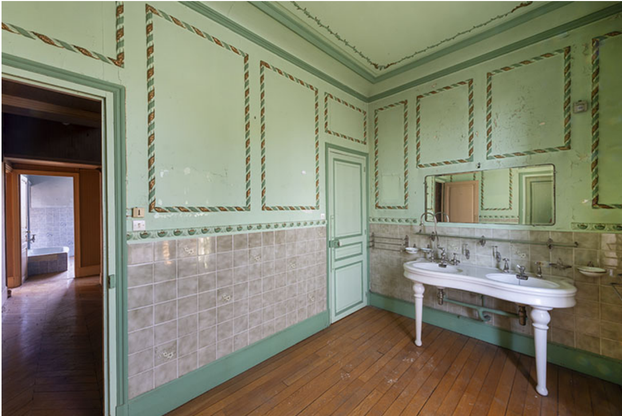
Premier étage, salle d'eau.

70, Scey-sur-Saône-et-Saint-Albin, 1 chemin des Vignes