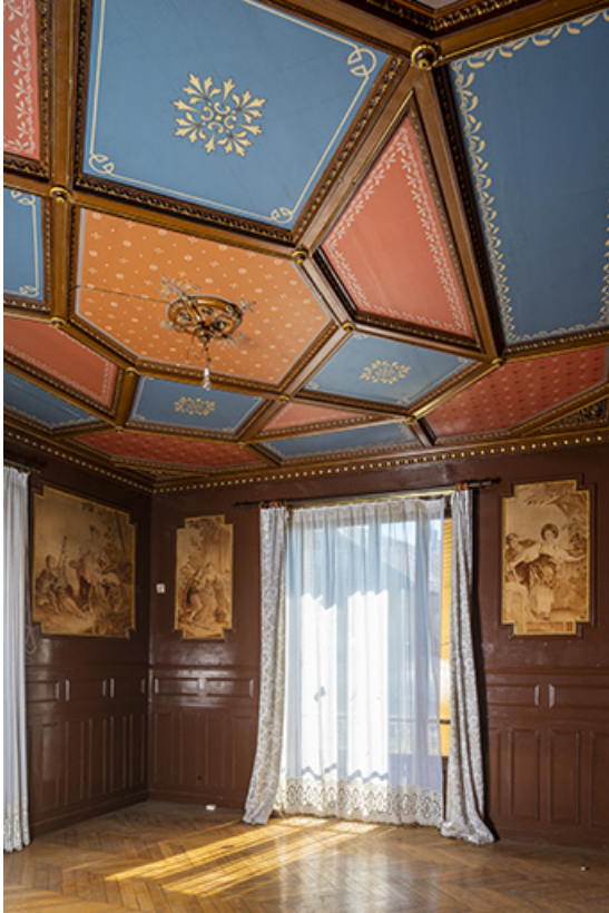
Rez-de-chaussée, grand salon, vue de l'angle sud-est.

70, Sceaux-sur-Saône-et-Saint-Albin, 1 chemin des Vignes