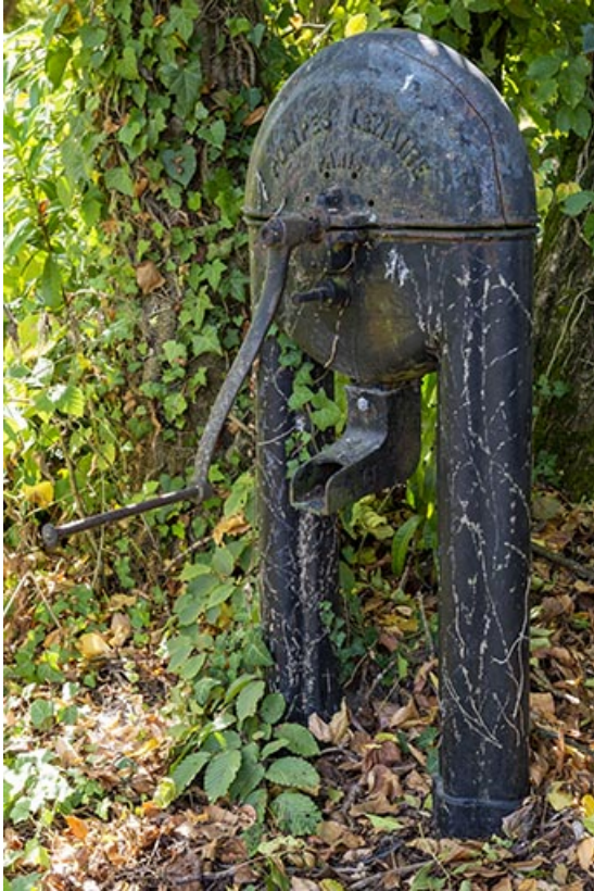
Pompe à godets (modèle Lemaire) dans le jardin.

70, Sceaux-sur-Saône-et-Saint-Albin, 1 chemin des Vignes