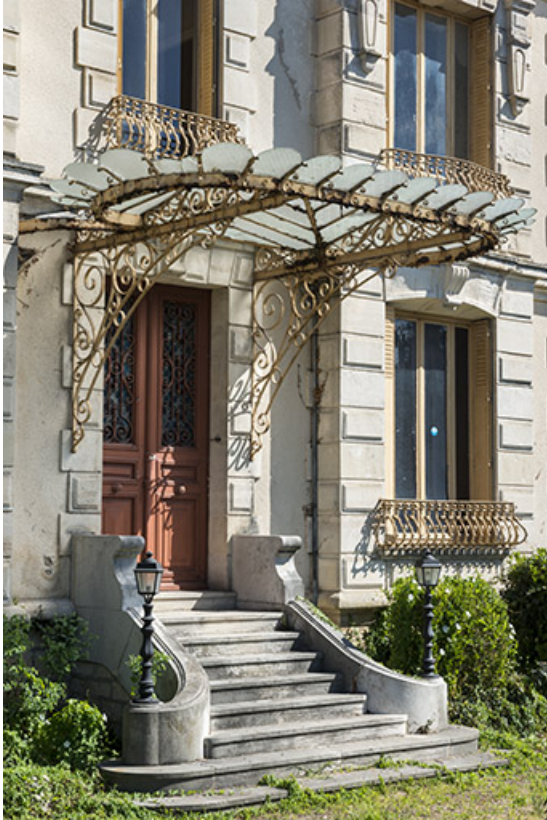
Porte d'entrée principale surmontée d'une marquise, vue de trois-quarts.

70, Scey-sur-Saône-et-Saint-Albin, 1 chemin des Vignes