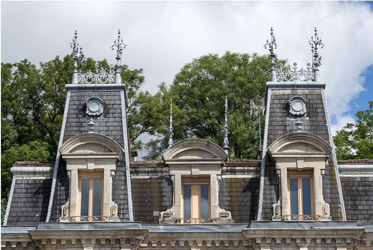
Toiture, côté sud.

70, Sceaux-sur-Saône-et-Saint-Albin, 1 chemin des Vignes