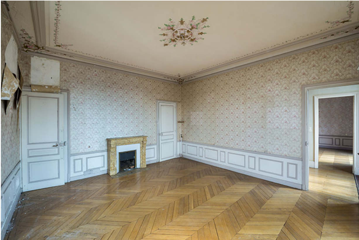
Premier étage, chambre à coucher de l'angle sud-ouest.

70, Sceaux-sur-Saône-et-Saint-Albin, 1 chemin des Vignes