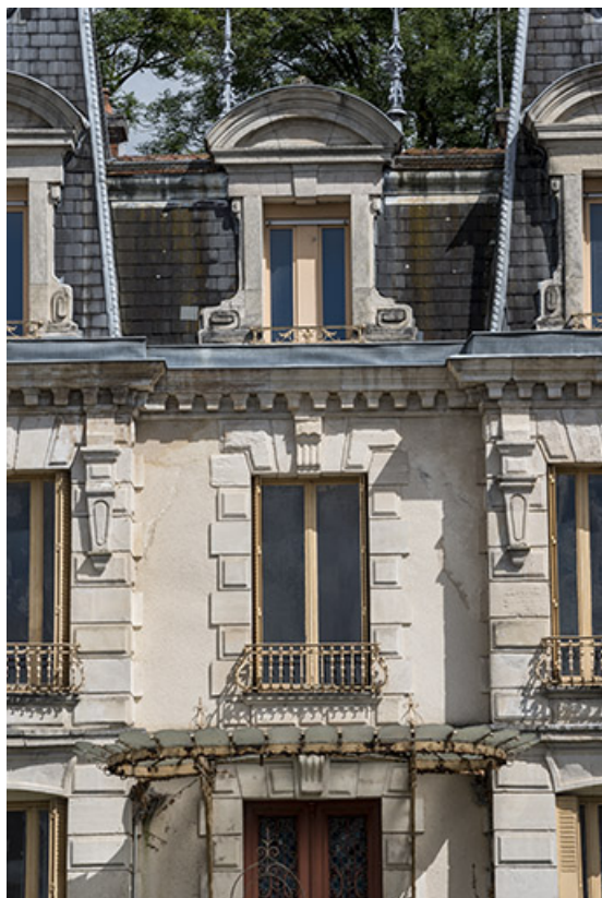
Détail de la travée centrale de la façade sud.

70, Sceaux-sur-Saône-et-Saint-Albin, 1 chemin des Vignes