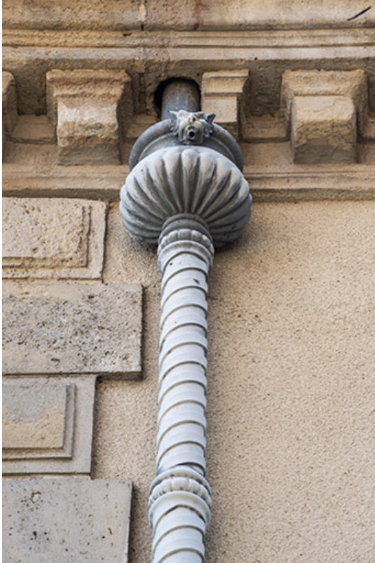
Descente d'eau en hélice avec cuvette godronnée.

70, Scey-sur-Saône-et-Saint-Albin, 1 chemin des Vignes