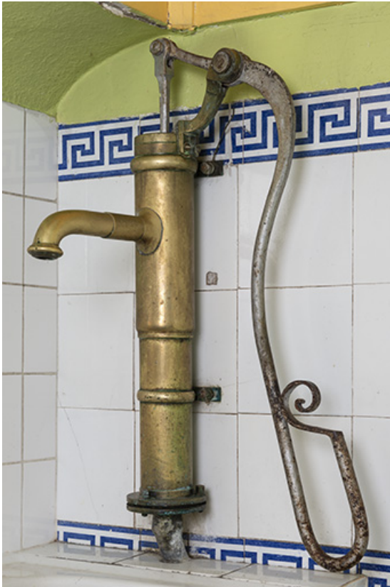
Rez-de-chaussée, cuisine, pompe à main.

70, Sceaux-sur-Saône-et-Saint-Albin, 1 chemin des Vignes