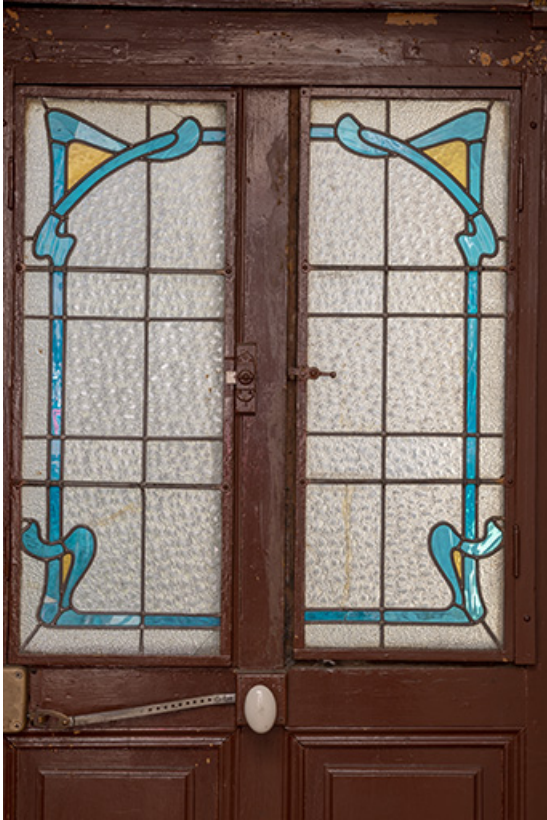
Porte de la cage d'escalier donnant sur le jardin, vitrail de style Art Nouveau.

70, Sceaux-sur-Saône-et-Saint-Albin, 1 chemin des Vignes