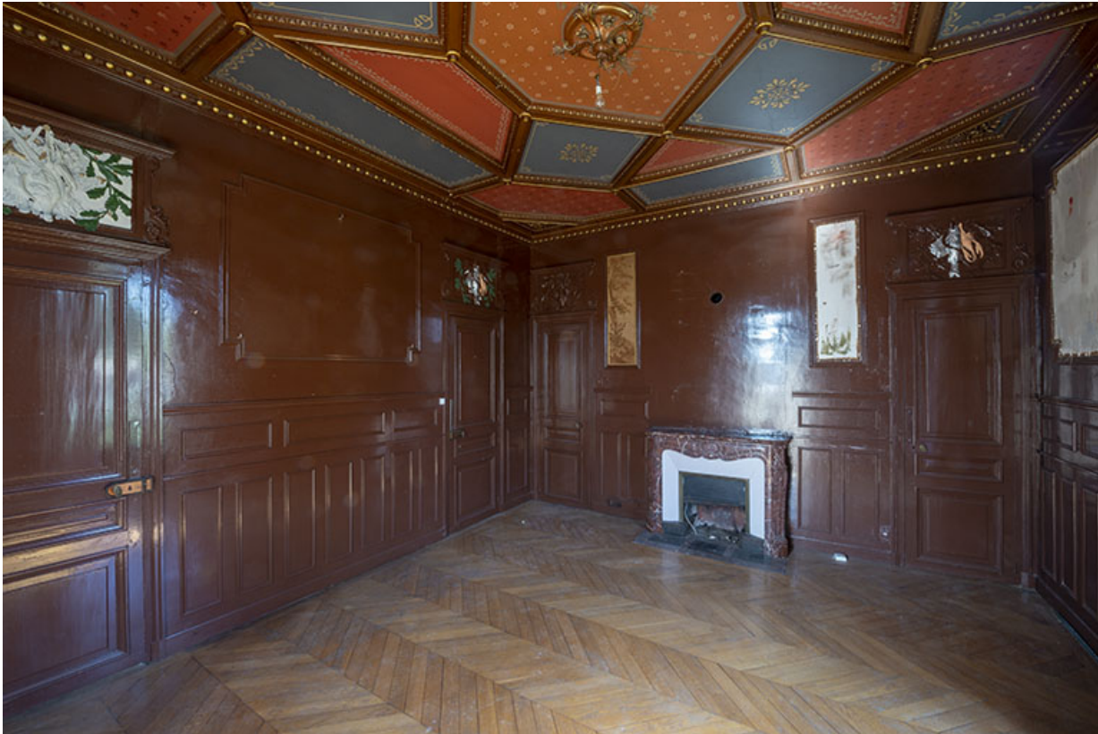
Rez-de-chaussée, grand salon, vue de l'angle nord-ouest.

70, Scey-sur-Saône-et-Saint-Albin, 1 chemin des Vignes