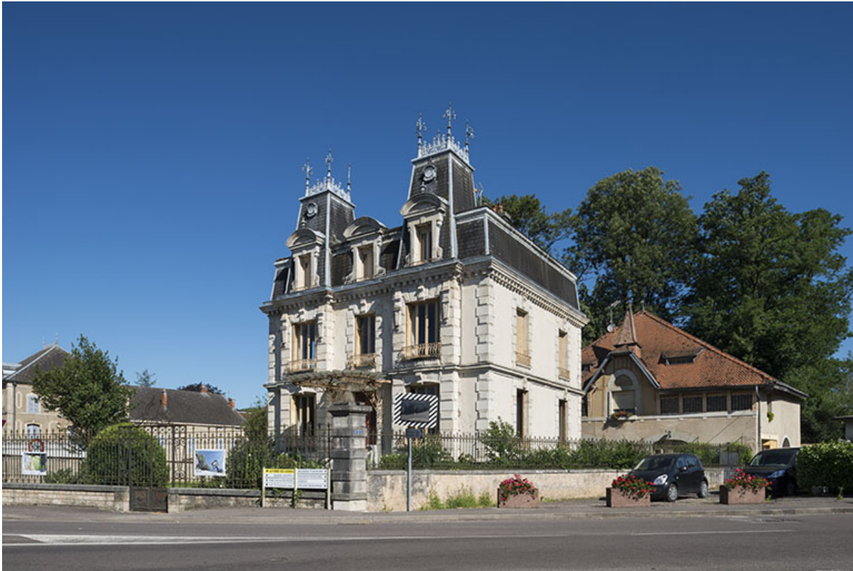
Vue d'ensemble de la maison et du bâtiment secondaire.

70, Sceaux-sur-Saône-et-Saint-Albin, 1 chemin des Vignes