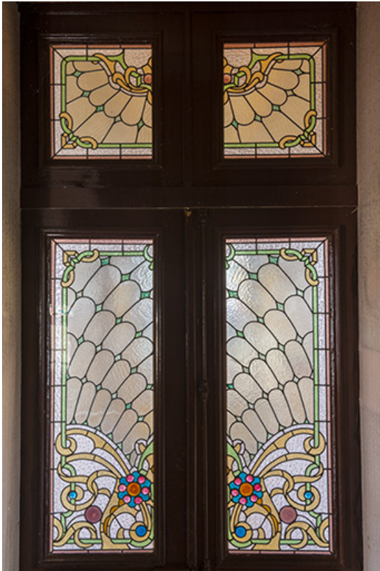
Porte du vestibule donnant sur la cage d'escalier, vitrail de style Art Nouveau.

70, Sceaux-sur-Saône-et-Saint-Albin, 1 chemin des Vignes