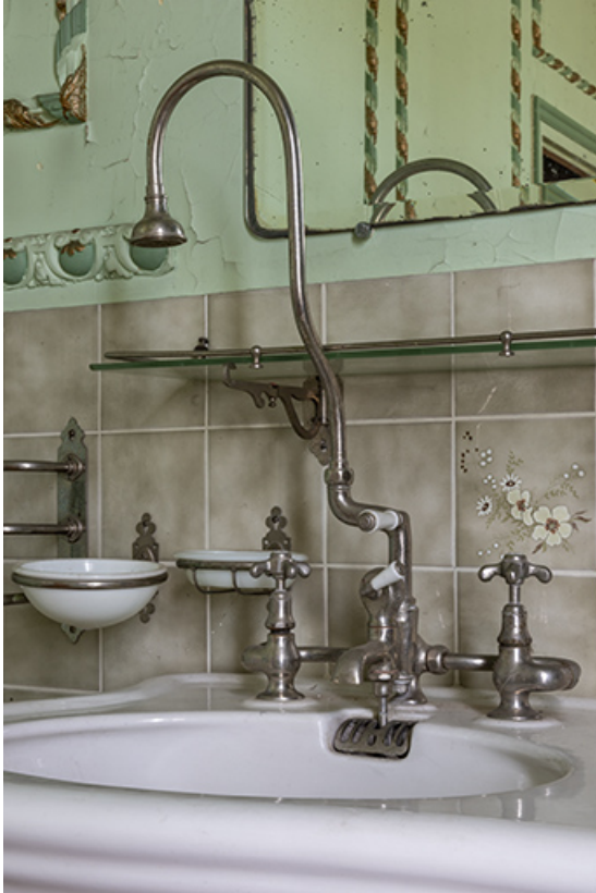
Premier étage, salle d'eau, robinets.

70, Scey-sur-Saône-et-Saint-Albin, 1 chemin des Vignes