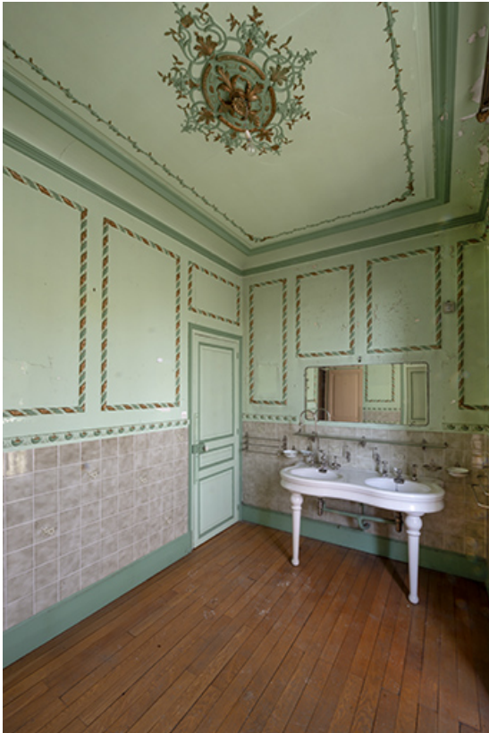
Premier étage, salle d'eau.

70, Sceaux-sur-Saône-et-Saint-Albin, 1 chemin des Vignes