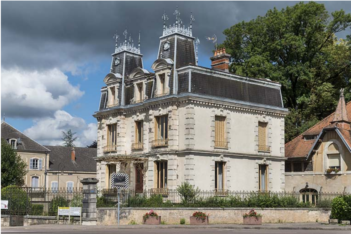
Vue d'ensemble de la maison, depuis l'est.

70, Sceaux-sur-Saône-et-Saint-Albin, 1 chemin des Vignes