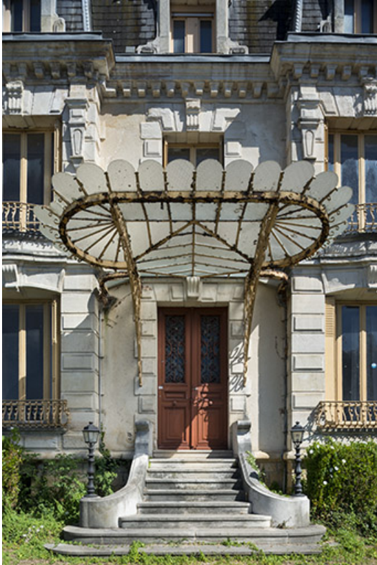
Porte d'entrée principale surmontée d'une marquise, vue de face.

70, Sceaux-sur-Saône-et-Saint-Albin, 1 chemin des Vignes