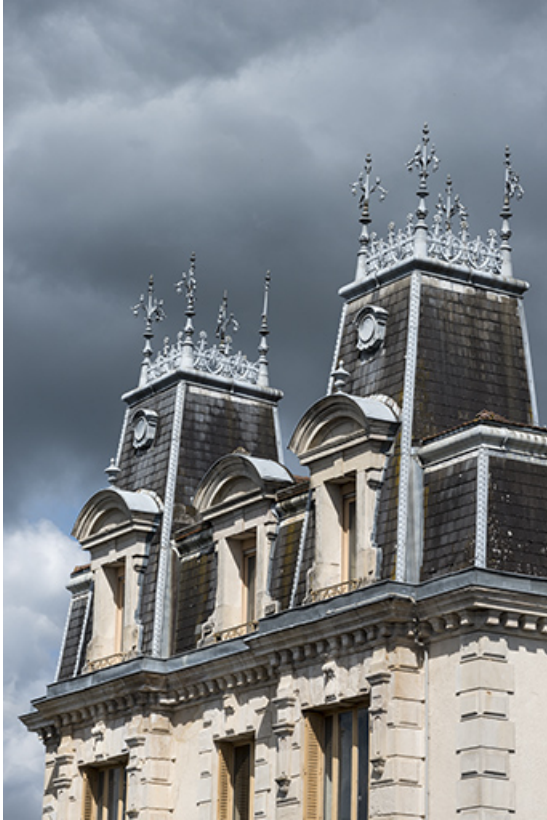
Toiture, côté sud.

70, Sceaux-sur-Saône-et-Saint-Albin, 1 chemin des Vignes