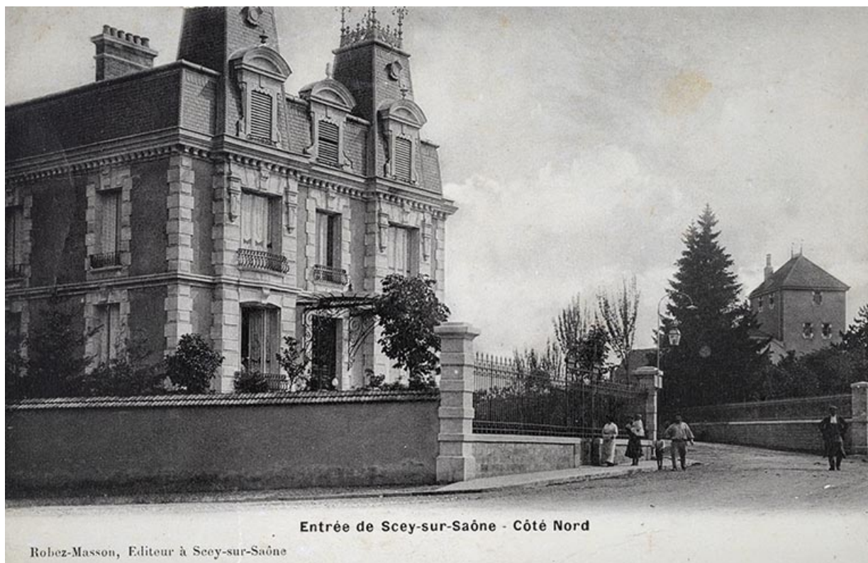
Entrée de Sceaux-sur-Saône - Côté Nord

Robez-Masson, Editeur à Sceaux-sur-Saône