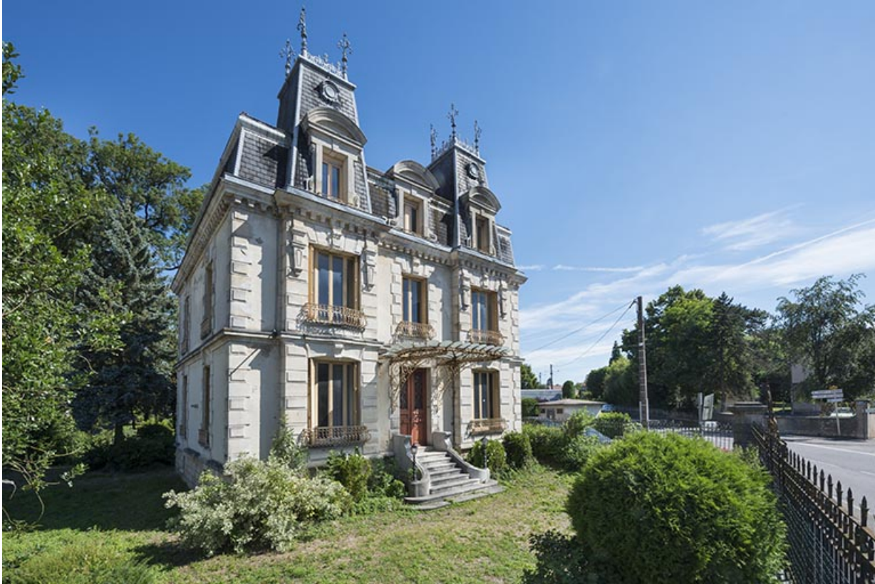
Vue d'ensemble de la maison, depuis le sud-ouest.

70, Sceaux-sur-Saône-et-Saint-Albin, 1 chemin des Vignes