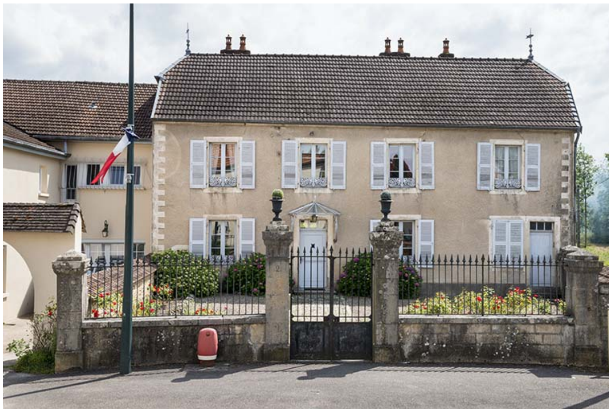
Façade principale, vue de face.

70, Scey-sur-Saône-et-Saint-Albin, 2 avenue des Pâtis