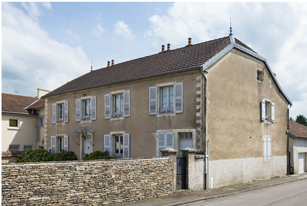
Façade principale, vue de trois-quarts.

70, Sceaux-sur-Saône-et-Saint-Albin, 2 avenue des Pâtis