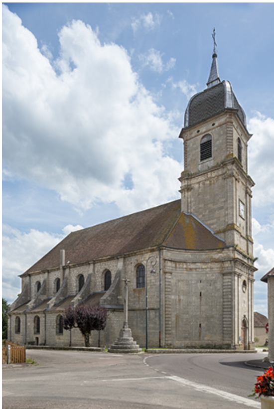
Vue d'ensemble depuis la rue de la Croix de Pierre. 70, Scey-sur-Saône-et-Saint-Albin rue de l' Église