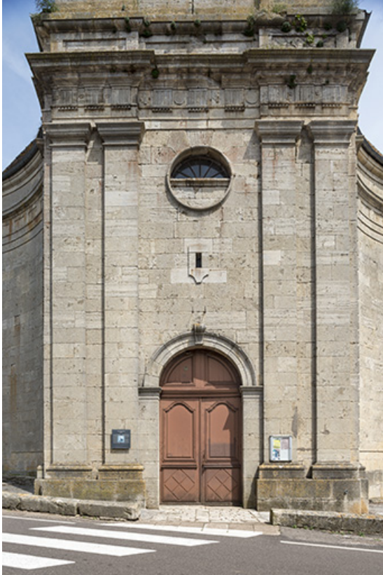
Clocher-porche, premier niveau.

70, Scey-sur-Saône-et-Saint-Albin rue de l' Église