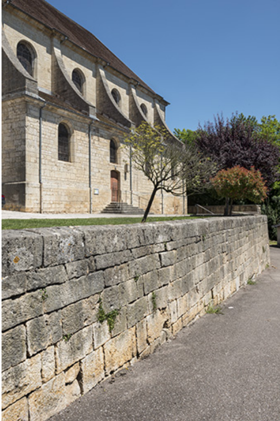
Flanc sud, mur de l'ancien cimetière.

70, Scey-sur-Saône-et-Saint-Albin rue de l' Église