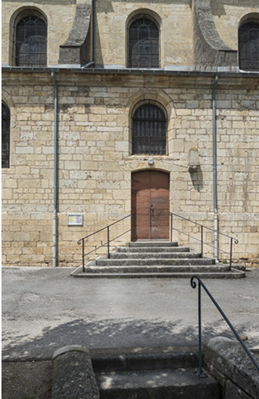
Flanc sud, porte de la chapelle des fonts.

70, Sceaux-sur-Saône-et-Saint-Albin rue de l' Église