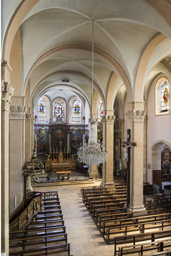
Vue d'ensemble de la nef, depuis la tribune.

70, Sceaux-sur-Saône-et-Saint-Albin rue de l' Église