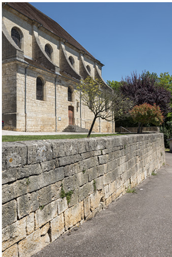
Flanc sud, mur de l'ancien cimetière.

70, Scey-sur-Saône-et-Saint-Albin rue de l'Église