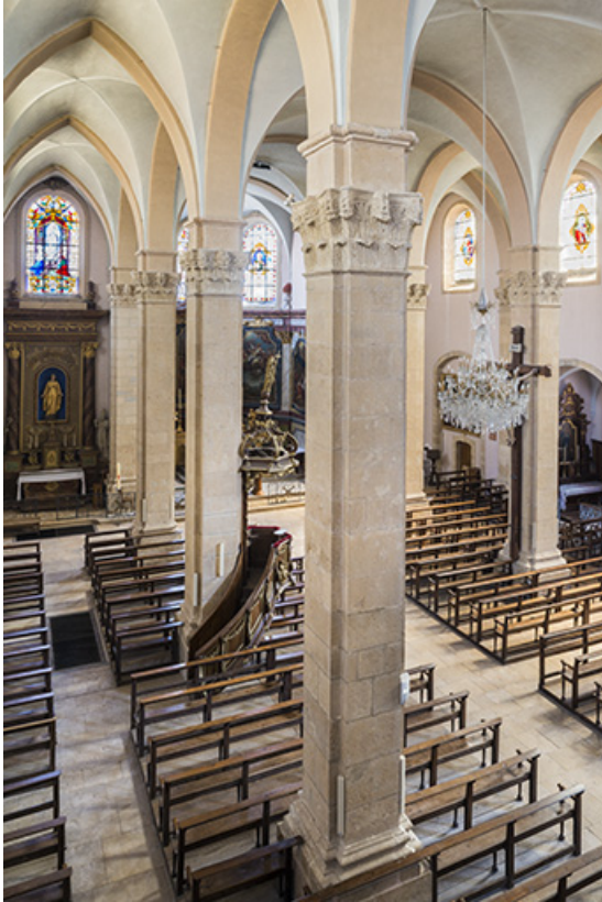
Vue d'ensemble de la nef, depuis la tribune.

70, Sceaux-sur-Saône-et-Saint-Albin rue de l' Église