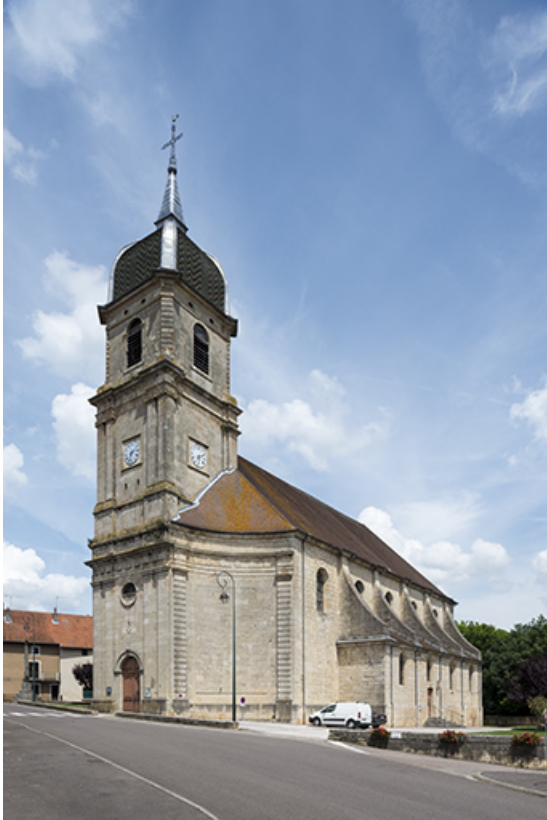
Vue d'ensemble depuis la rue de l'Église.

70, Sceaux-sur-Saône-et-Saint-Albin rue de l' Église