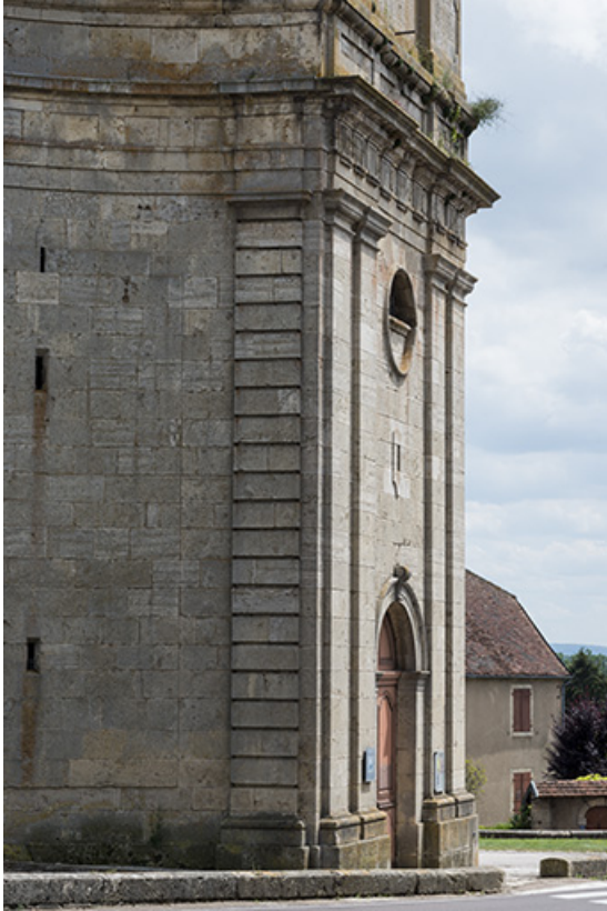
Clocher-porche, premier niveau.

70, Scey-sur-Saône-et-Saint-Albin rue de l' Église