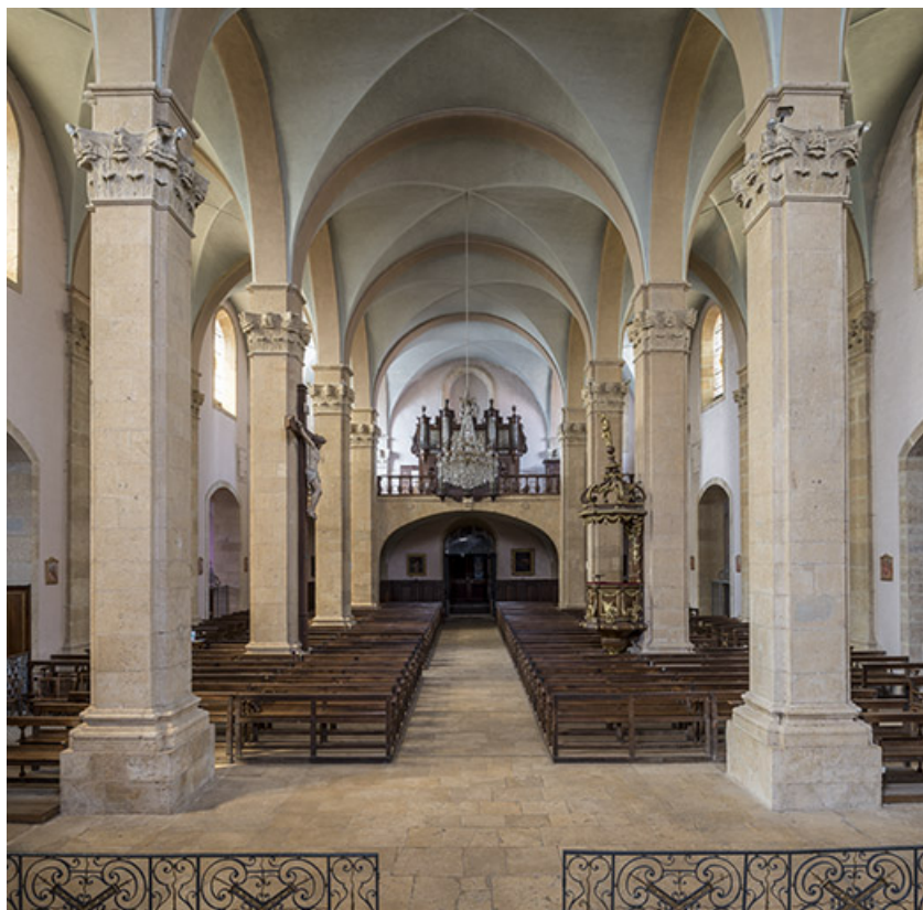
Nef, vue en direction de la tribune.

70, Scey-sur-Saône-et-Saint-Albin rue de l' Église