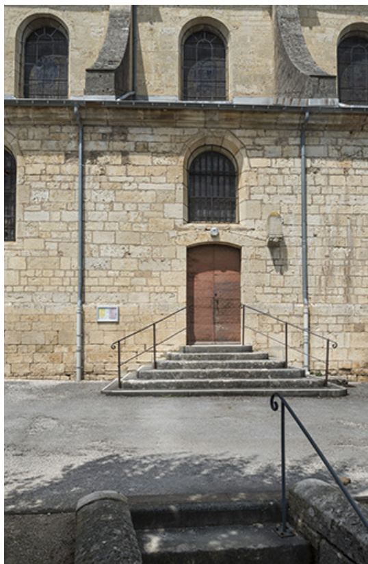
Flanc sud, porte de la chapelle des fonts.

70, Scey-sur-Saône-et-Saint-Albin rue de l' Église