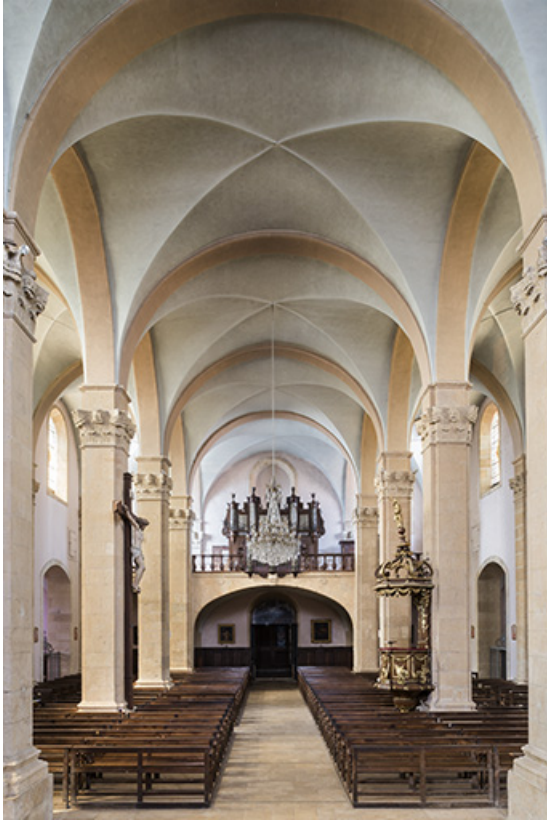
Nef, vue en direction de la tribune.

70, Sceaux-sur-Saône-et-Saint-Albin rue de l' Église