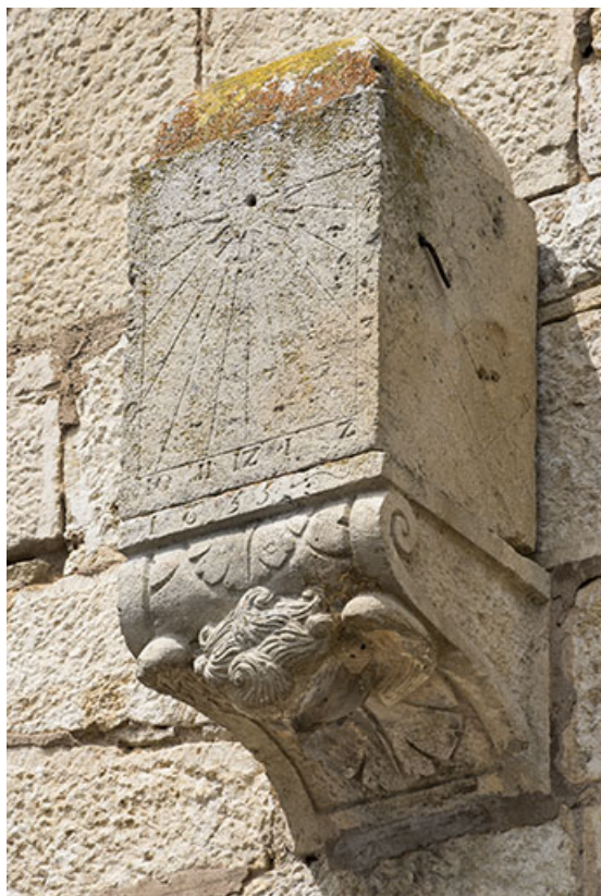
Cadran solaire sur console datée de 1655.

70, Scey-sur-Saône-et-Saint-Albin rue de l' Église