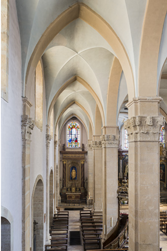
Bas-côté nord, vue en direction du chœur.

70, Sceaux-sur-Saône-et-Saint-Albin rue de l' Église