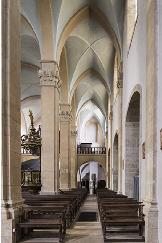
Bas-côté nord, en direction de la tribune.

70, Sceaux-sur-Saône-et-Saint-Albin rue de l' Église