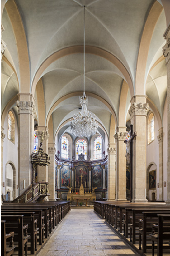
Nef, vue en direction du chœur.

70, Scey-sur-Saône-et-Saint-Albin rue de l' Église