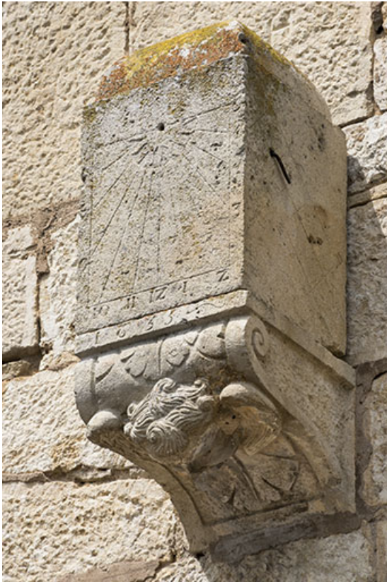
Cadran solaire sur console datée de 1655.

70, Scey-sur-Saône-et-Saint-Albin rue de l' Église