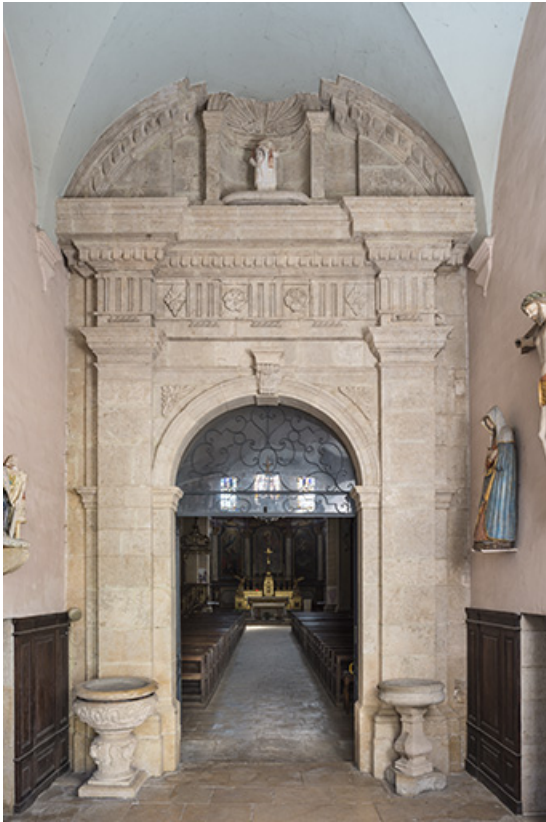
Porte, vue depuis le clocher-porche vers la nef. 70, Sceaux-sur-Saône-et-Saint-Albin rue de l' Église