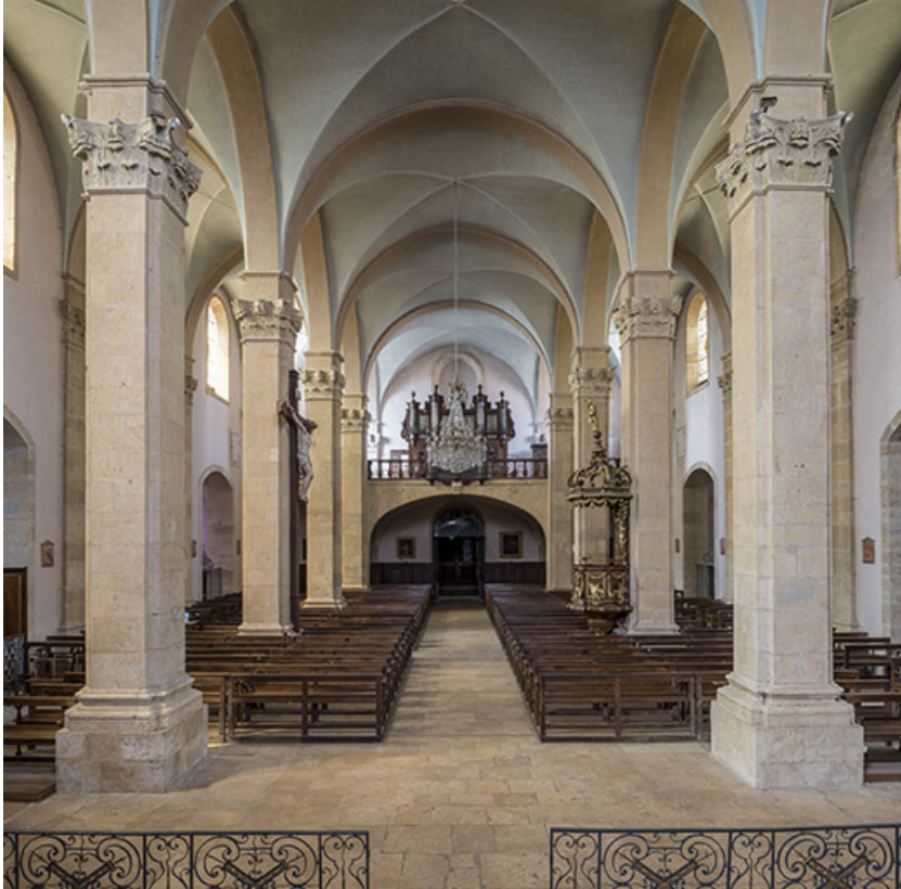
Nef, vue en direction de la tribune.

70, Sceaux-sur-Saône-et-Saint-Albin rue de l' Église