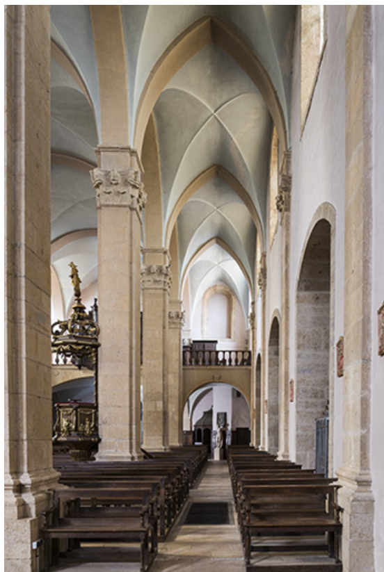
Bas-côté nord, en direction de la tribune.

70, Scey-sur-Saône-et-Saint-Albin rue de l' Église