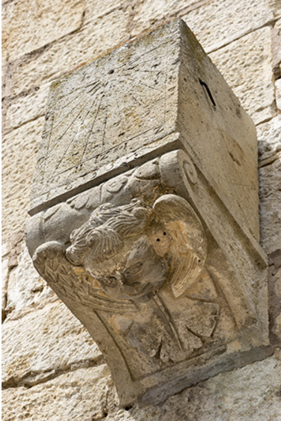
Cadran solaire sur console datée de 1655.

70, Scey-sur-Saône-et-Saint-Albin rue de l' Église