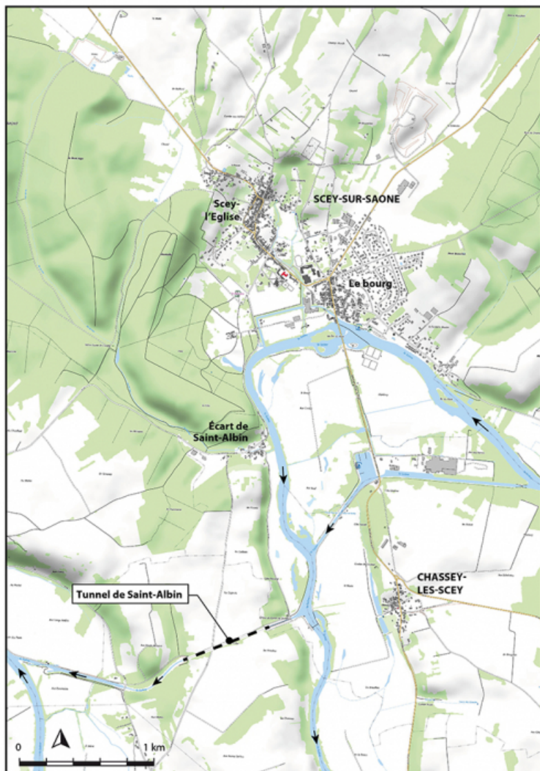
Plan de localisation. Extrait du scan 25 de l'IGN, 2019.