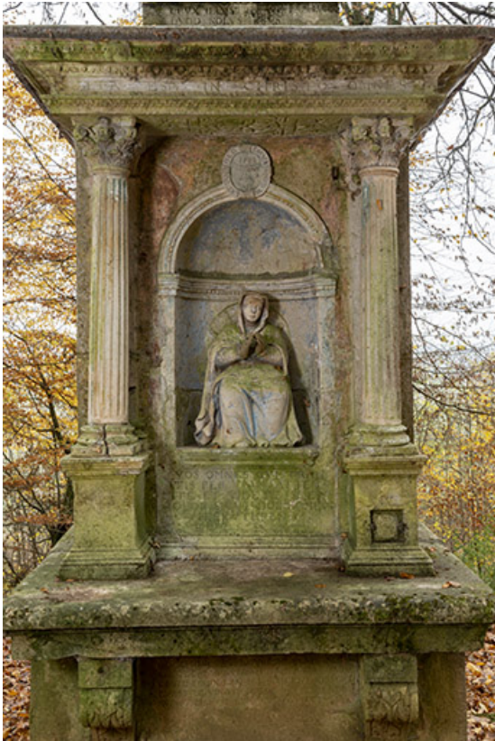
Face antérieure du piédestal, niche encadrée par deux colonnes.

70, Sceaux-sur-Saône-et-Saint-Albin chemin de défrètement, lieudit : écart de Saint-Albin