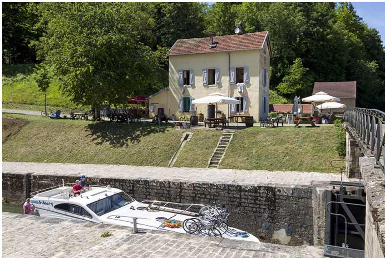
Entrée amont du tunnel Saint-Albin.