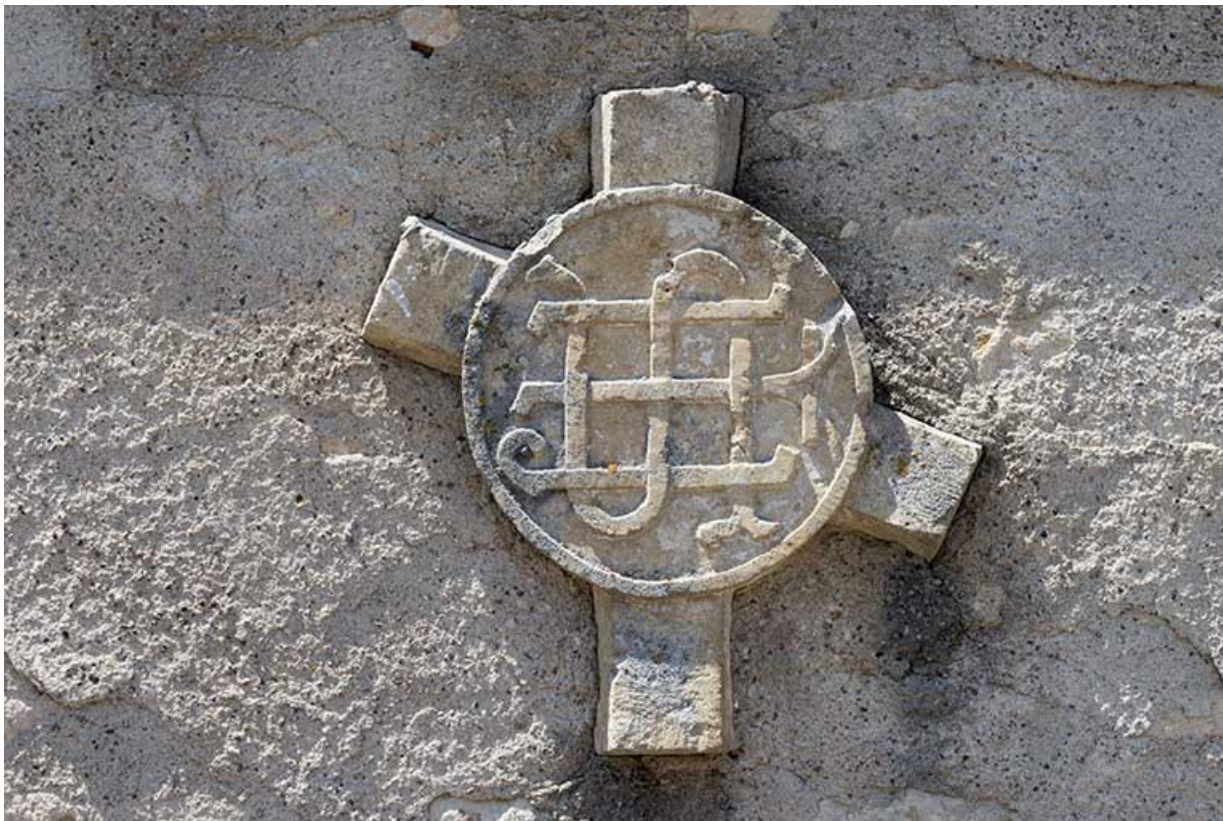
Clef de voûte de l'ancienne église de Saint-Albin incorporée dans un mur.