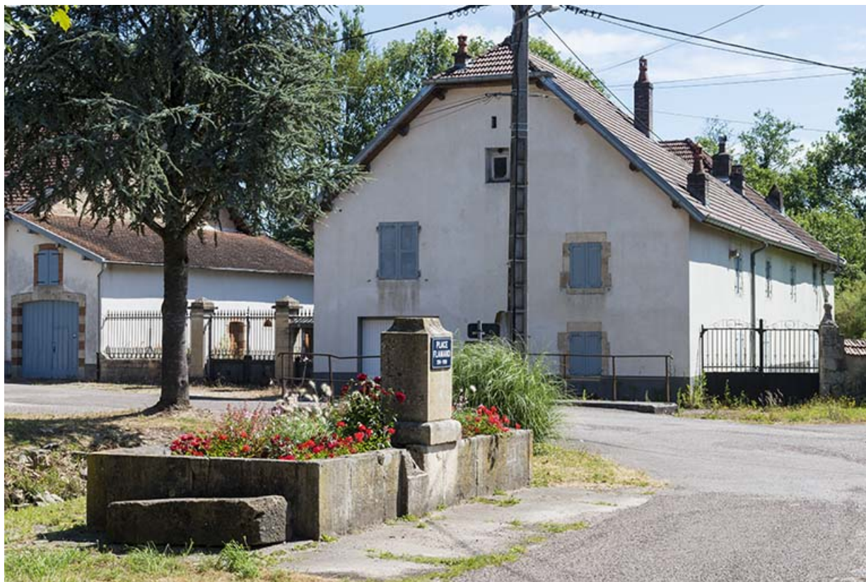
La fontaine, rue Flamand.

70, Scey-sur-Saône-et-Saint-Albin, 3 place Flamand, lieudit : Saint-Albin