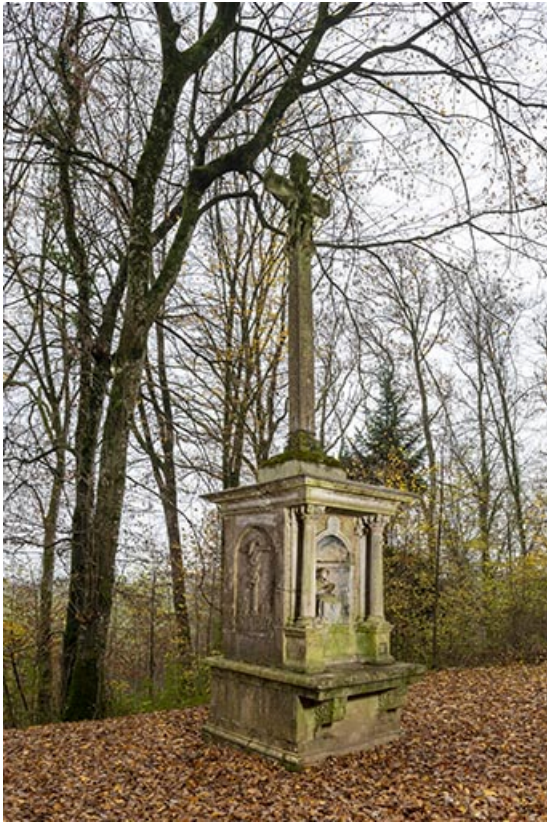
Vue d'ensemble, de trois-quarts droit.

70, Scey-sur-Saône-et-Saint-Albin chemin de défrètement, lieudit : écart de Saint-Albin