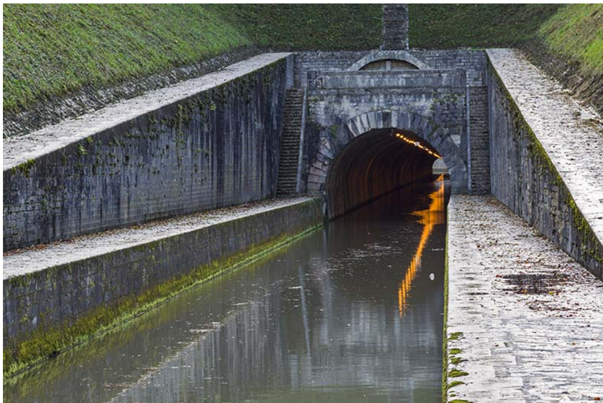
Le tunnel de Saint-Albin.