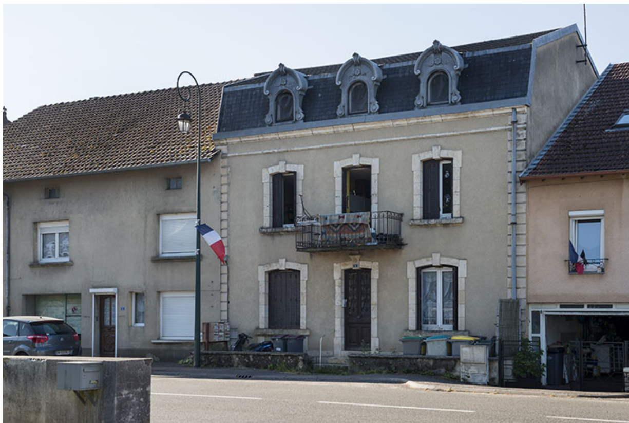
Maison n°6, vue de trois-quarts gauche.

70, Scey-sur-Saône-et-Saint-Albin rue du Pont de la Balance