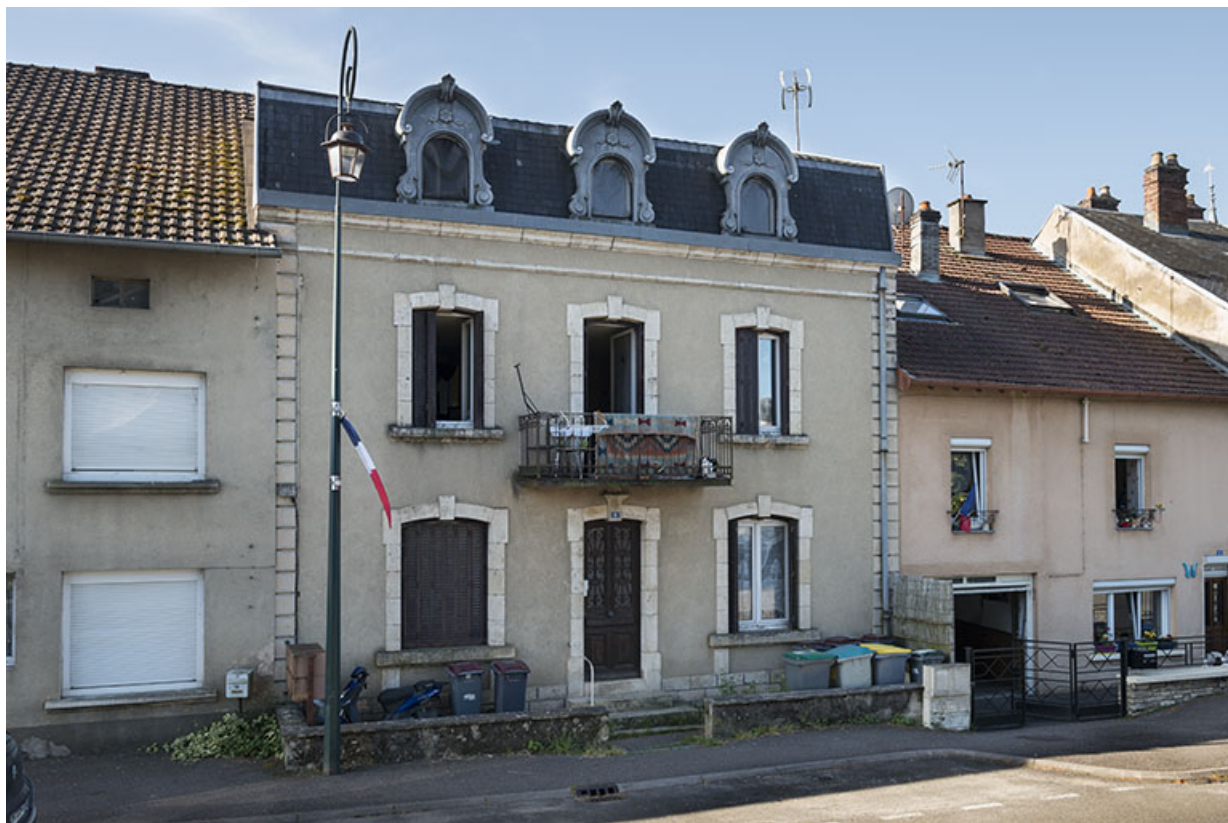
Maison n°6, vue de trois-quarts droit.

70, Sceaux-sur-Saône-et-Saint-Albin rue du Pont de la Balance