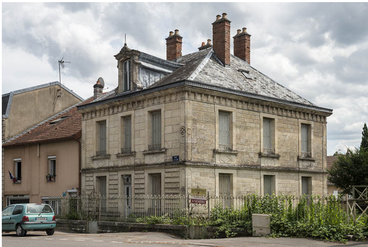
Élévation sur la rue du Pont de la Balance, vue de trois-quarts.

70, Sceaux-sur-Saône-et-Saint-Albin, 2 rue du Pont de la Balance