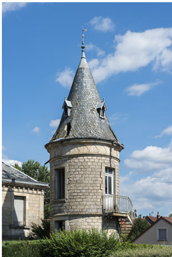
Tour, vue depuis le nord.

70, Scey-sur-Saône-et-Saint-Albin, 2 rue du Pont de la Balance