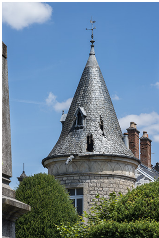
Toiture de la tour.

70, Sceaux-sur-Saône-et-Saint-Albin, 2 rue du Pont de la Balance