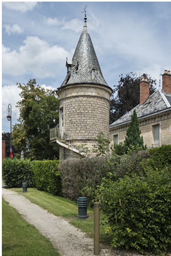
Tour, vue depuis le sud.

70, Sceaux-sur-Saône-et-Saint-Albin, 2 rue du Pont de la Balance