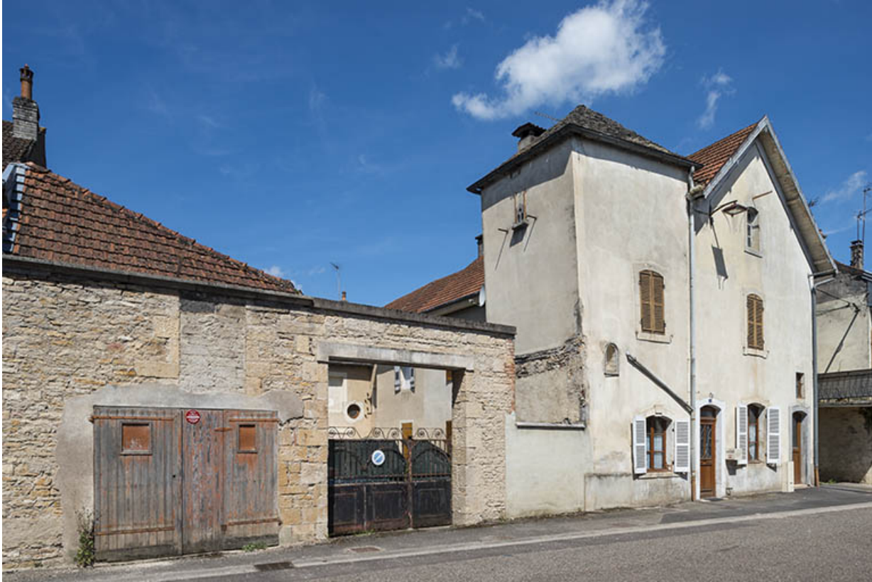
Élévation sur la rue André Bergerot, vue de trois-quarts.

70, Sceaux-sur-Saône-et-Saint-Albin, 24 rue André Bergerot