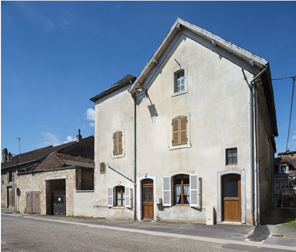
Élévation sur la rue André Bergerot, vue de trois-quarts.

70, Sceaux-sur-Saône-et-Saint-Albin, 24 rue André Bergerot