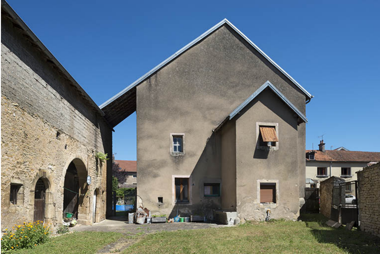
Vue d'ensemble de la maison et de la remise.

70, Scey-sur-Saône-et-Saint-Albin, 6 rue André Bergerot