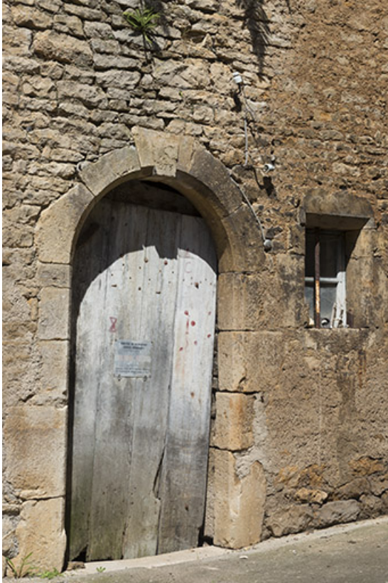
Porte de la remise.

70, Scey-sur-Saône-et-Saint-Albin, 6 rue André Bergerot