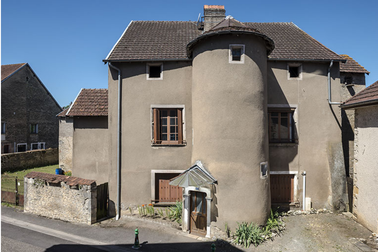
Élévation sur la rue André Bergerot, vue de face.

70, Sceaux-sur-Saône-et-Saint-Albin, 6 rue André Bergerot