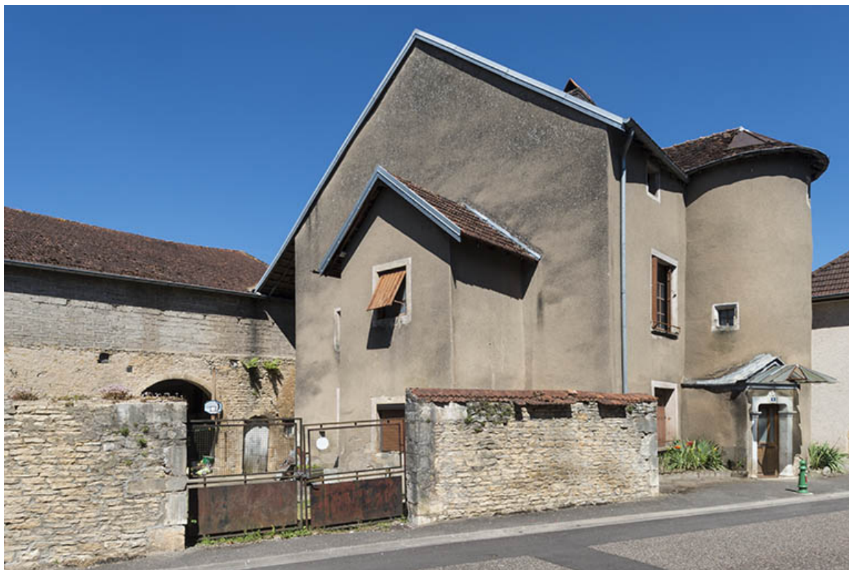
Élévation sur la rue André Bergerot, vue de trois-quarts.

70, Scey-sur-Saône-et-Saint-Albin, 6 rue André Bergerot