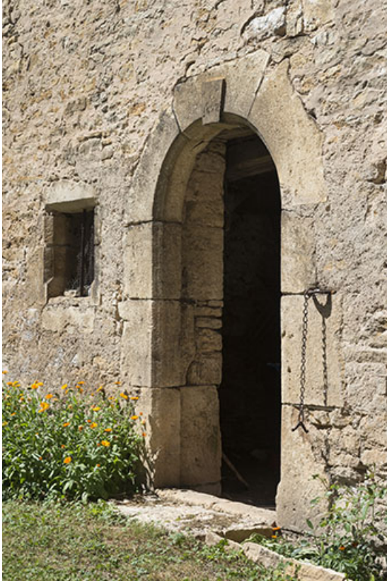
Porte de la remise.

70, Scey-sur-Saône-et-Saint-Albin, 6 rue André Bergerot