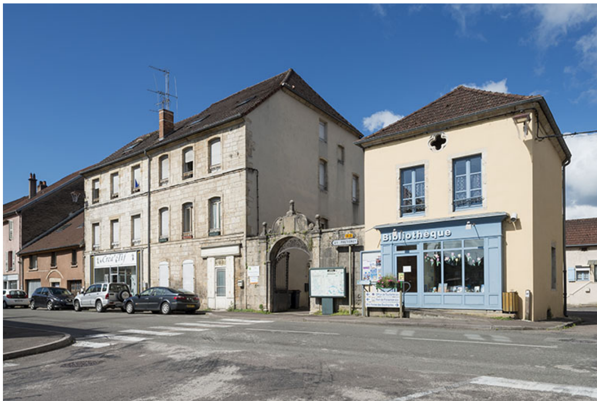
Élévation sur la rue Armand Paulmard, vue de trois-quarts. 70, Sceaux-sur-Saône-et-Saint-Albin, 8-10 rue Armand Paulmard