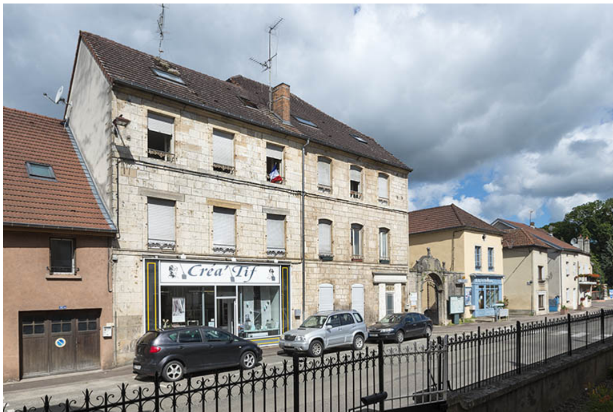
Élévation sur la rue Armand Paulmard, vue de trois-quarts. 70, Scey-sur-Saône-et-Saint-Albin, 8-10 rue Armand Paulmard