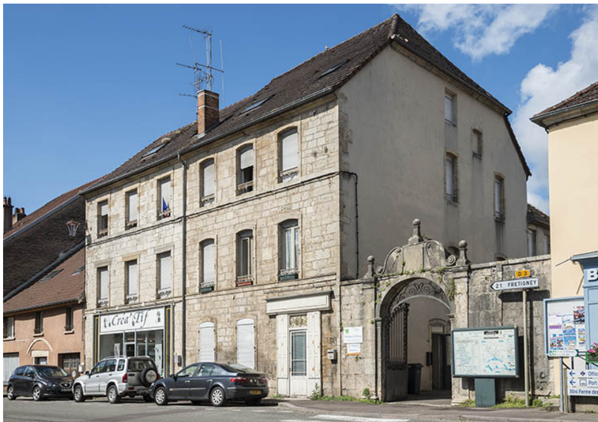
Élévation sur la rue Armand Paulmard, vue de trois-quarts. 70, Sceaux-sur-Saône-et-Saint-Albin, 8-10 rue Armand Paulmard