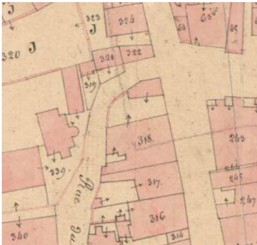
Plan de masse en 1836.

70, Scey-sur-Saône-et-Saint-Albin, 6 rue Armand Paulmard