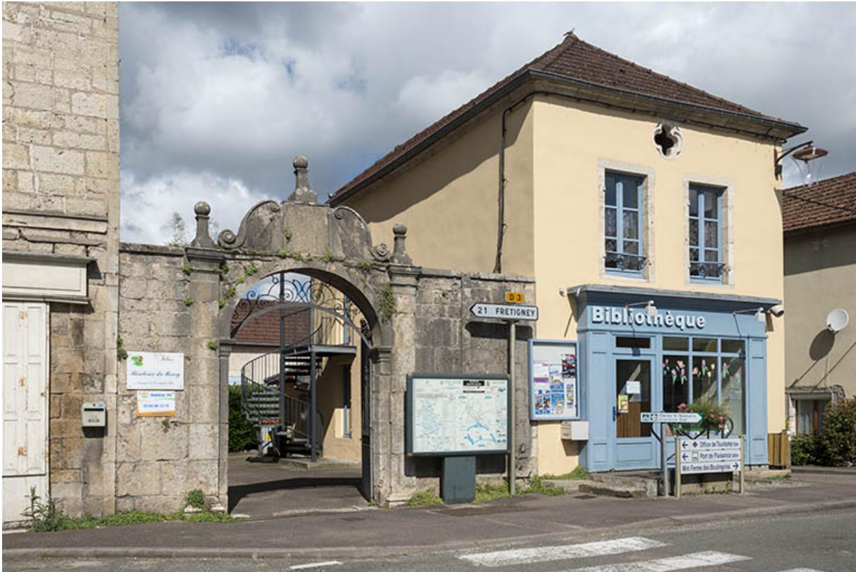
Élévation sur la rue Armand Paulmard, vue de trois-quarts.

70, Scey-sur-Saône-et-Saint-Albin, 6 rue Armand Paulmard