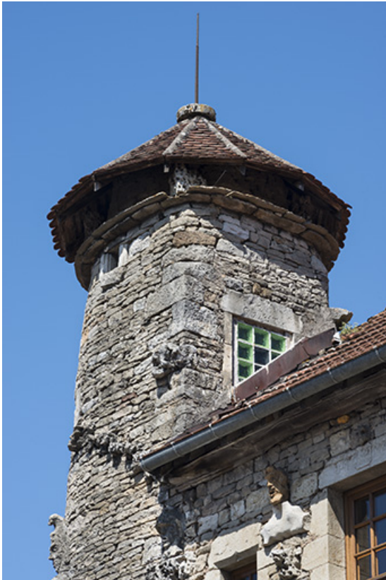
Dernier niveau et couverture de la tourelle.

70, Sceaux-sur-Saône-et-Saint-Albin, 27 rue Armand Paulmard