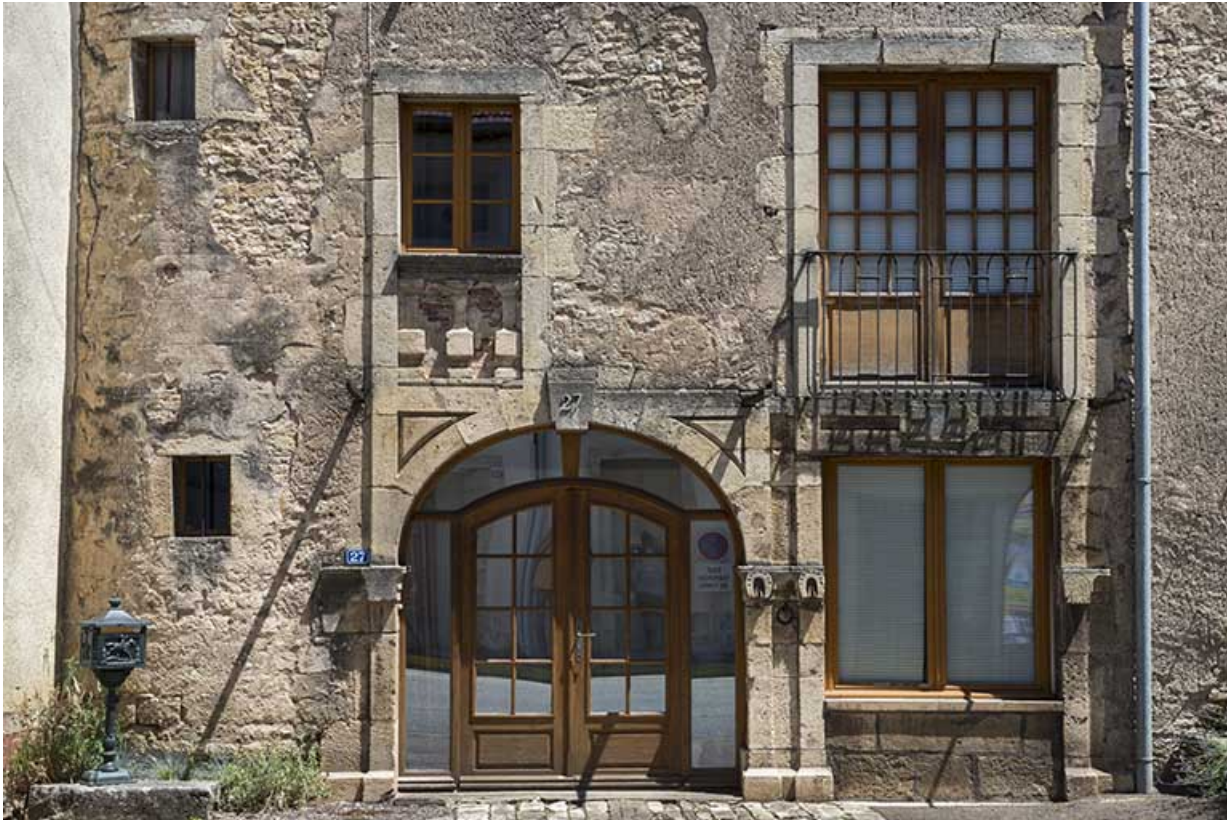
Baies du rez-de-chaussée et du premier étage.

70, Scey-sur-Saône-et-Saint-Albin, 27 rue Armand Paulmard