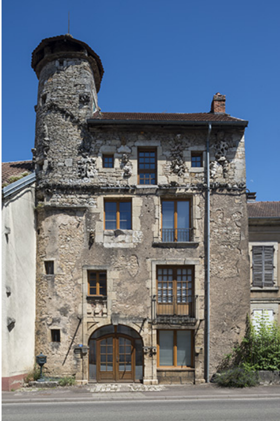
Maison n°27 rue Armand Paulmard.

70, Scey-sur-Saône-et-Saint-Albin, 27 rue Armand Paulmard