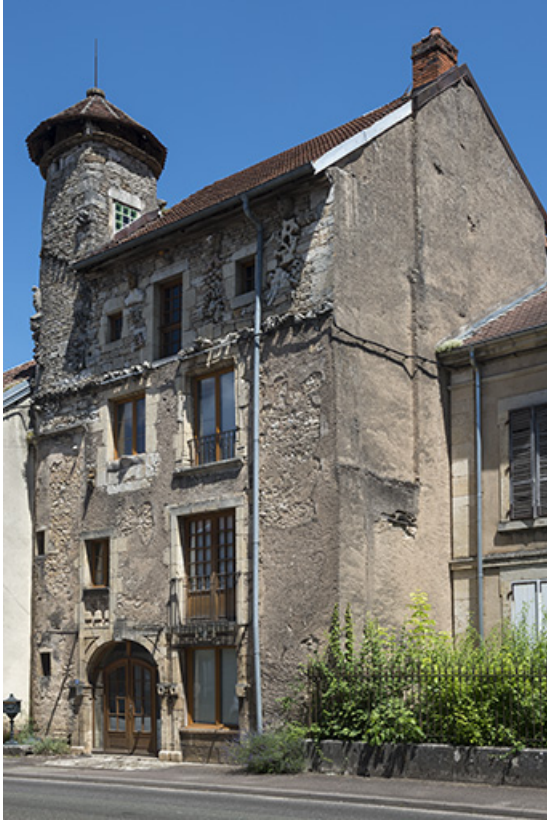
Élévation sur la rue Armand Paulmard, vue de trois-quarts.

70, Scey-sur-Saône-et-Saint-Albin, 27 rue Armand Paulmard