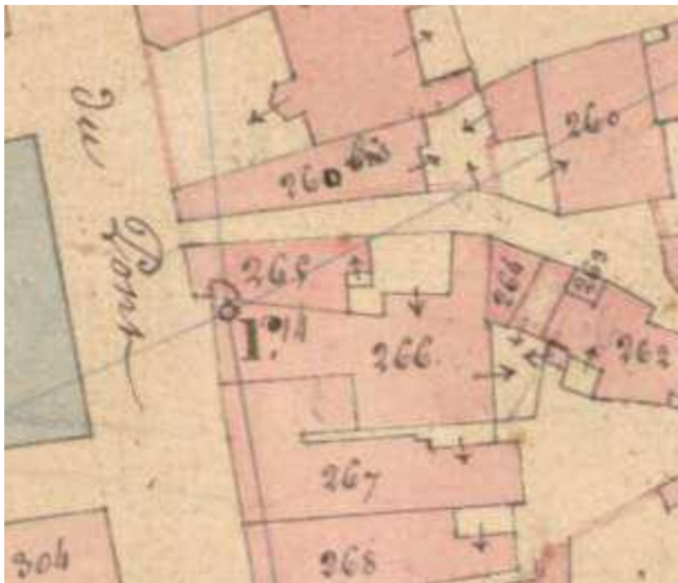
Extrait de l'Atlas parcellaire (1836) du cadastre de la commune de Sceaux-sur-Saône-et-Saint-Albin.

70, Sceaux-sur-Saône-et-Saint-Albin, 27 rue Armand Paulmard