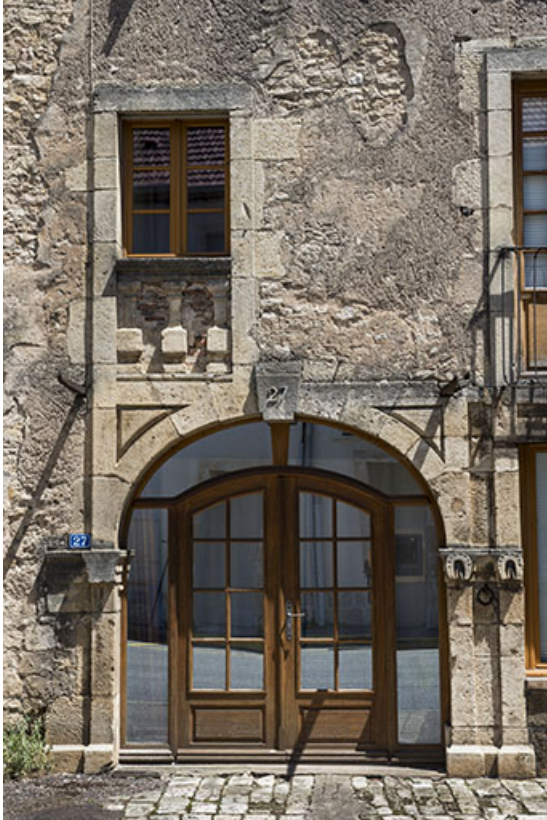
Baies du rez-de-chaussée et du premier étage.

70, Sceaux-sur-Saône-et-Saint-Albin, 27 rue Armand Paulmard