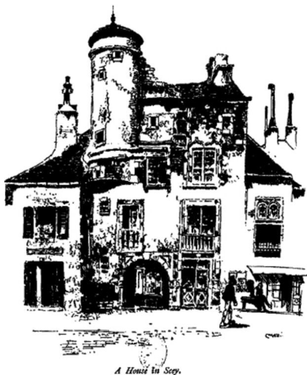
Façade sur la rue du Pont (actuelle rue Armand Paulmard). 70, Sceaux-sur-Saône-et-Saint-Albin, 27 rue Armand Paulmard

A House in Sceaux. In : Hamerton, Philip Gilbert. The Saône : a summer voyage. Londres : Seeley, 1887. XIX-368 p. p. 94.