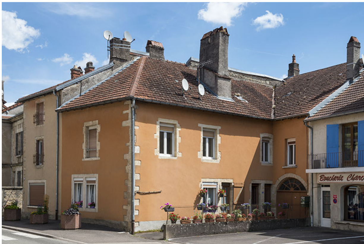
Élévation sur la rue Armand Paulmard.

70, Scey-sur-Saône-et-Saint-Albin, 35 rue Armand Paulmard