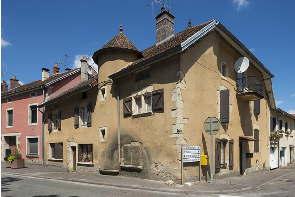
Élévation générale au croisement de la rue Armand Paulmard et de la rue d'Enfer. 70, Scey-sur-Saône-et-Saint-Albin, 45 rue Armand Paulmard