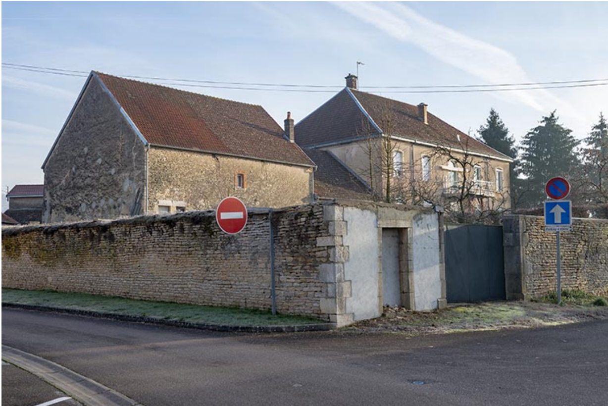
Vue de trois-quart depuis la Grande rue du Bourg.

70, Scey-sur-Saône-et-Saint-Albin, 2 route de Ferrières