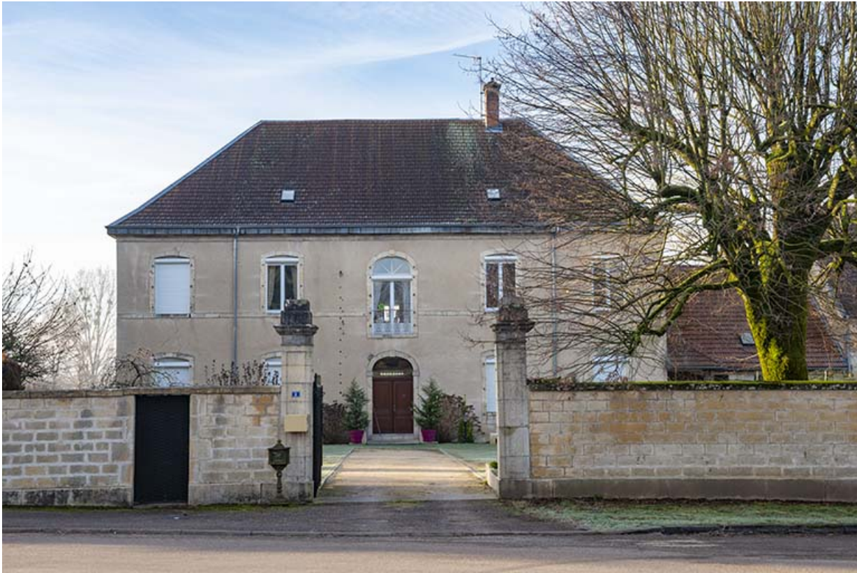
La façade antérieure et le portail d'entrée.

70, Sceaux-sur-Saône-et-Saint-Albin, 2 route de Ferrières