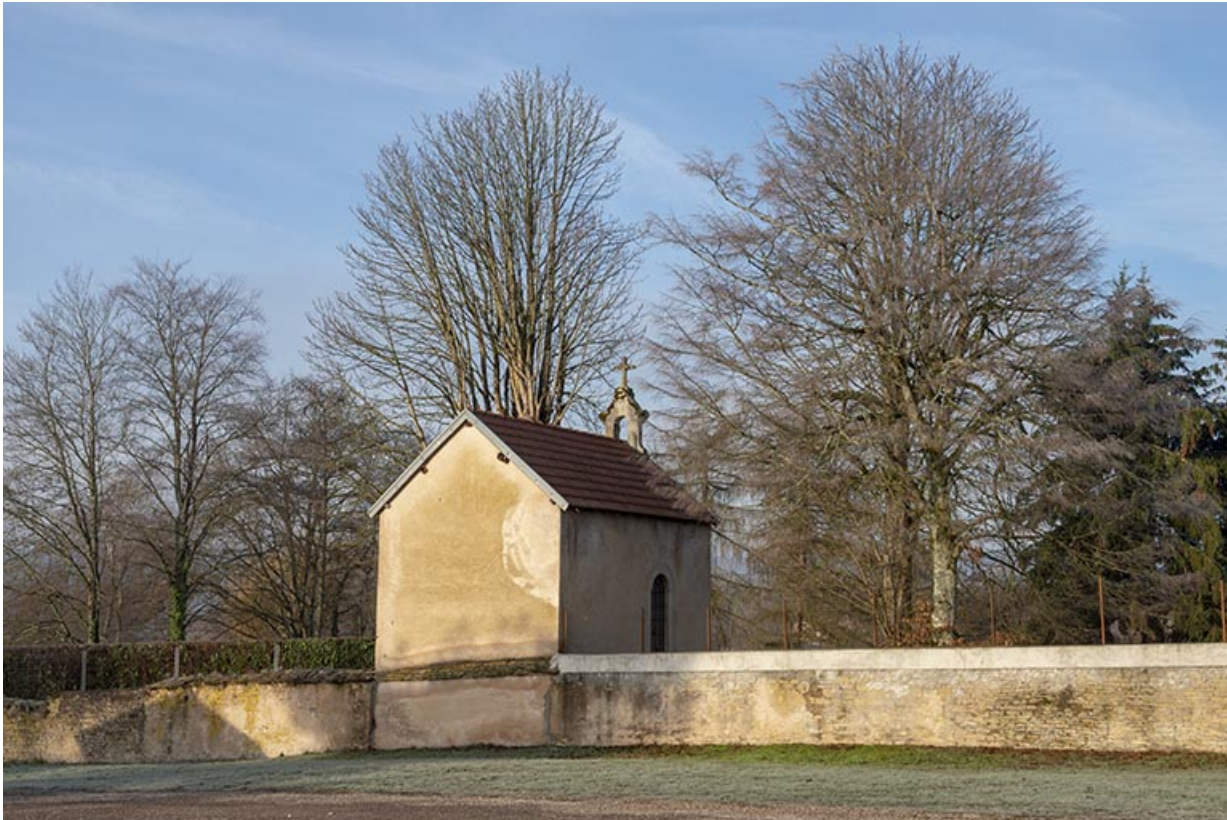
La chapelle privée depuis la route de Ferrières.

70, Sceaux-sur-Saône-et-Saint-Albin, 2 route de Ferrières