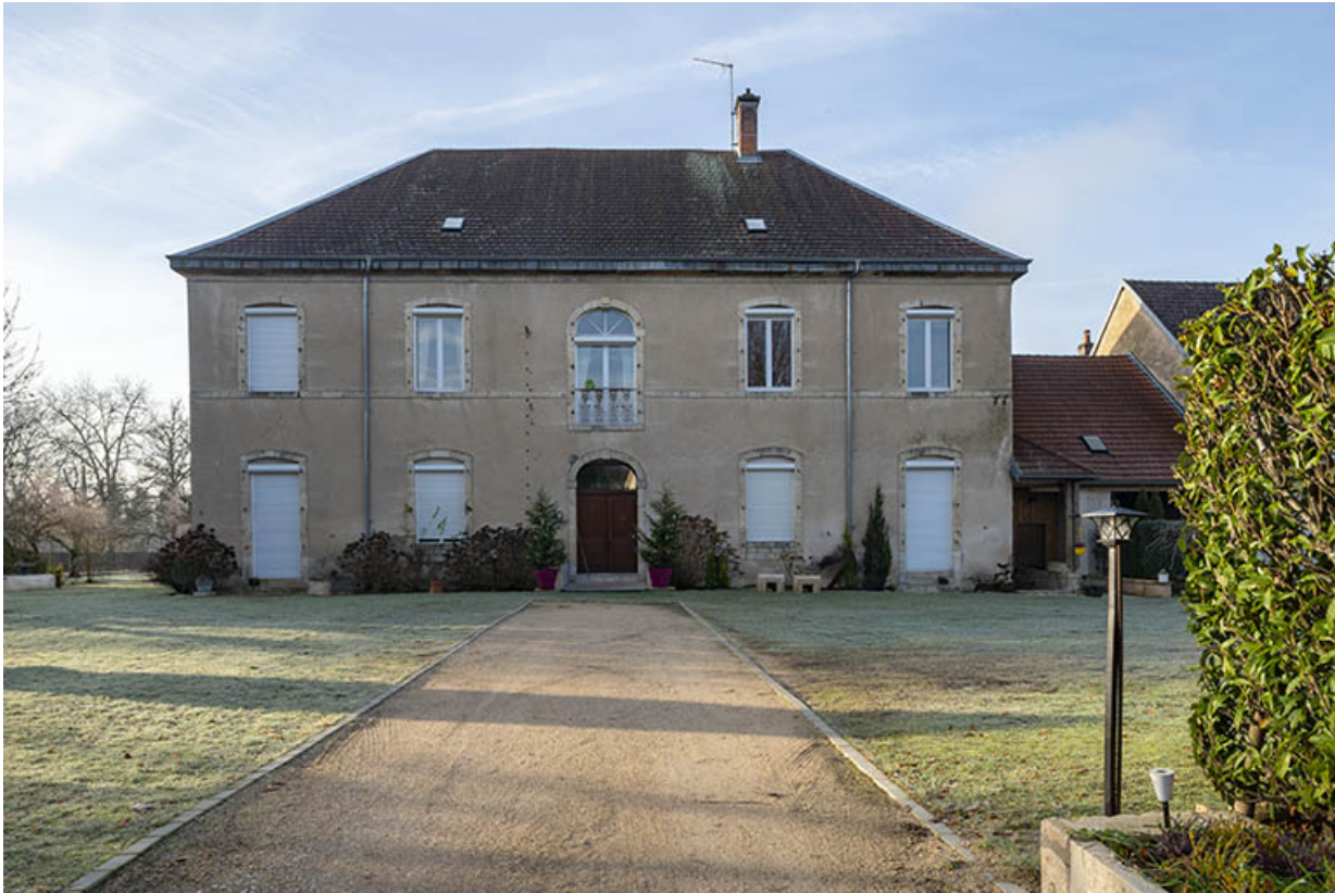
La façade antérieure à travées ordonnancées.

70, Scey-sur-Saône-et-Saint-Albin, 2 route de Ferrières