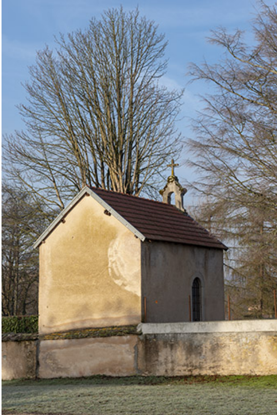
La chapelle, détail.

70, Sceaux-sur-Saône-et-Saint-Albin, 2 route de Ferrières