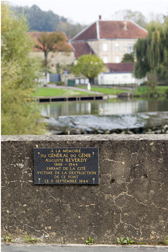
La plaque commémorative en l'honneur du Général Reverdy, et en arrière plan, sa demeure. 70, Scey-sur-Saône-et-Saint-Albin