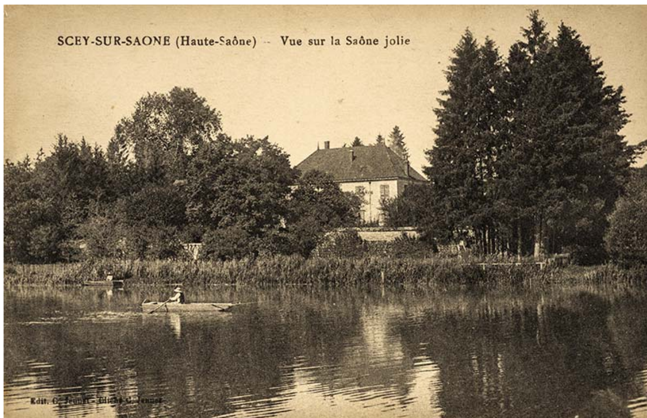
La Saône et la demeure, carte postale.

70, Scey-sur-Saône-et-Saint-Albin, 2 route de Ferrières