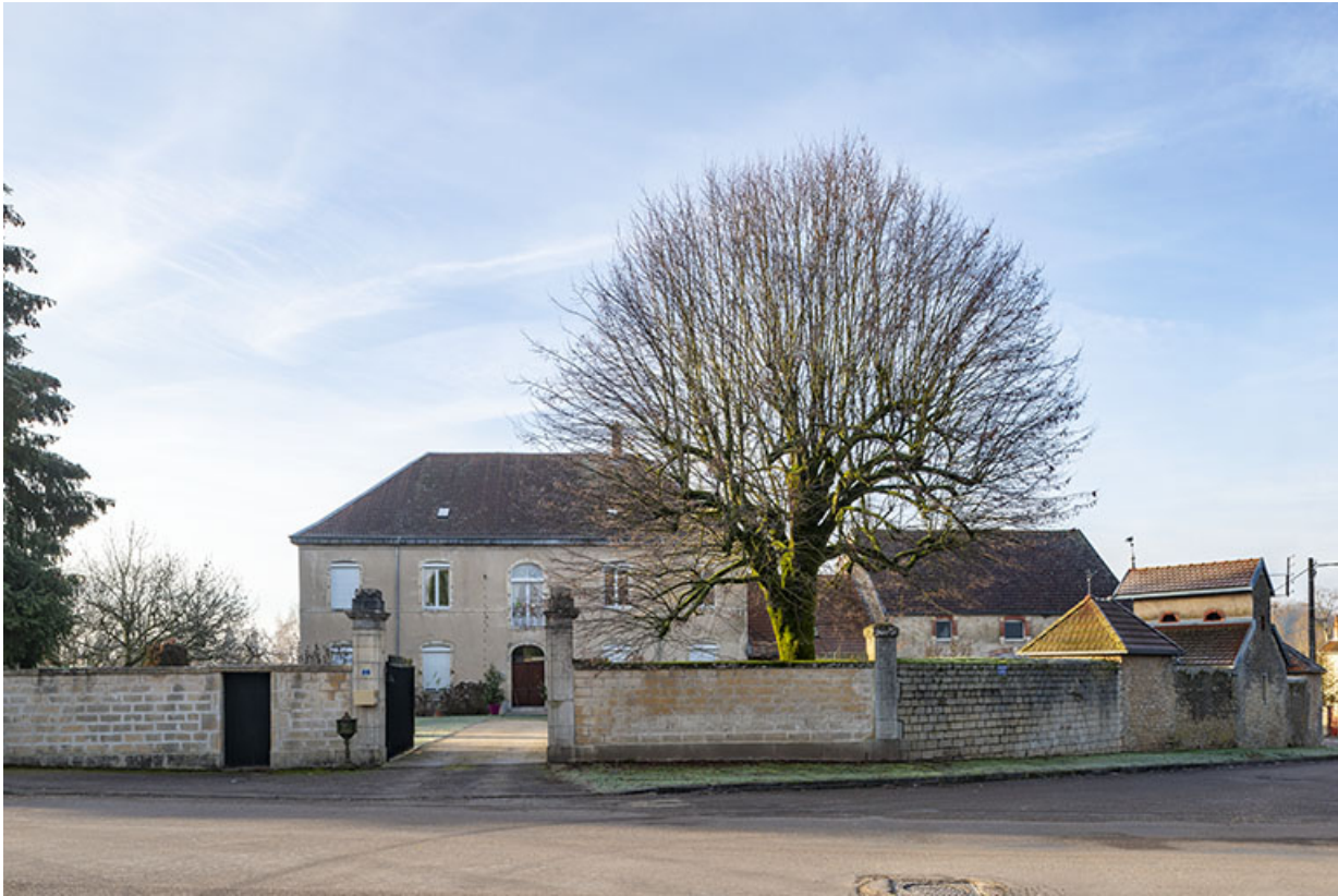
Vue générale depuis la route de Ferrières.

70, Sceaux-sur-Saône-et-Saint-Albin, 2 route de Ferrières