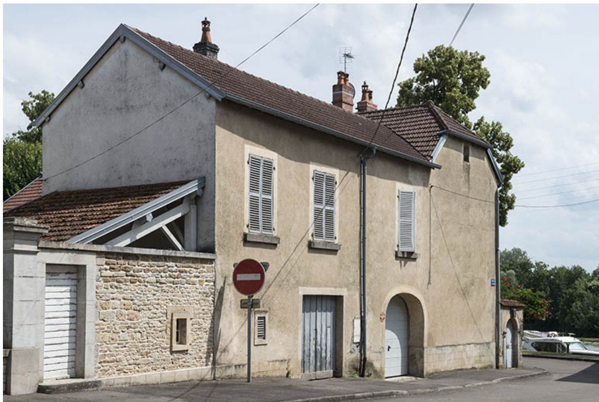
L'édifice depuis la rue Grande.

70, Sceaux-sur-Saône-et-Saint-Albin, 49 Grande rue du Bourg