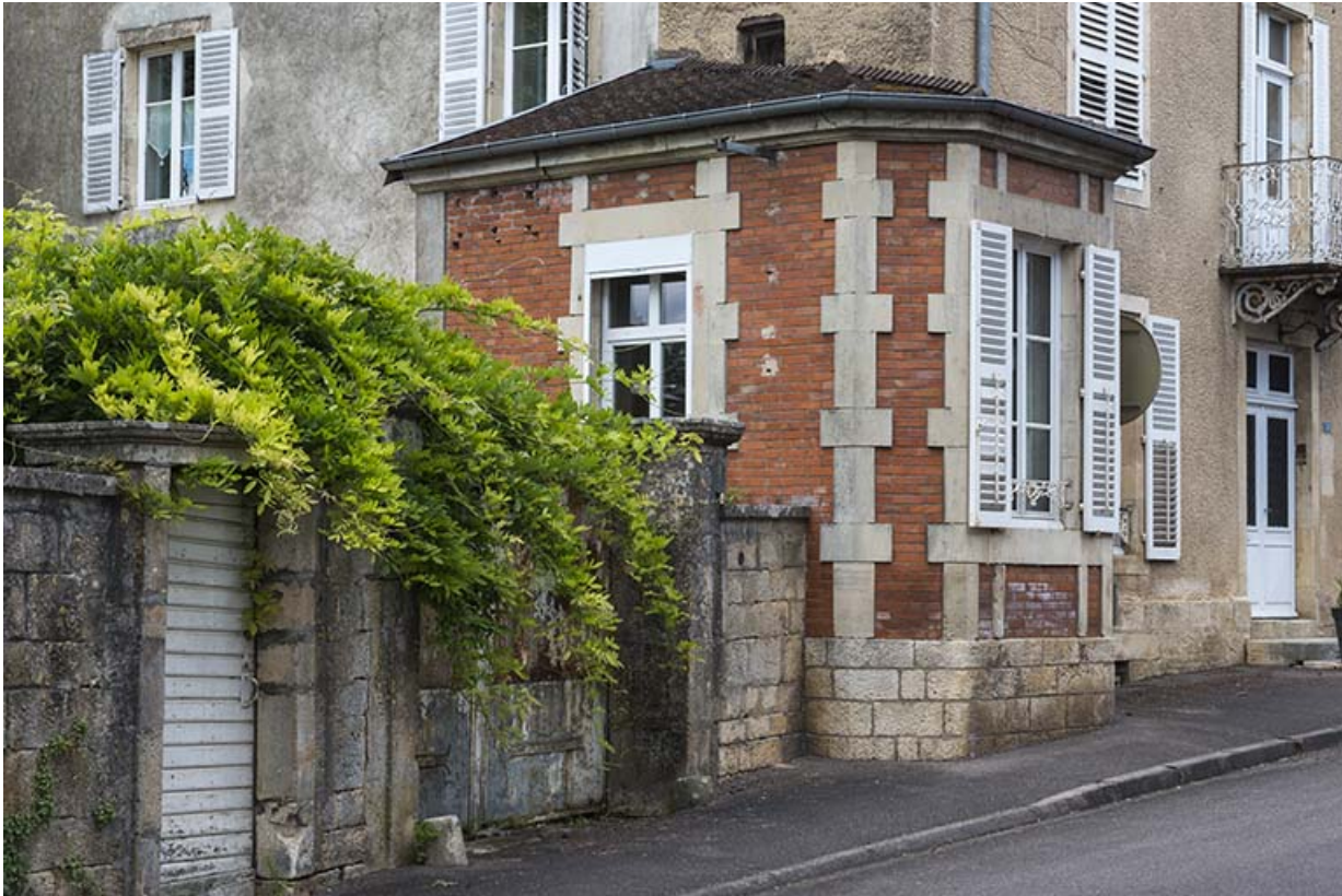
Le pavillon en brique, détail.

70, Scey-sur-Saône-et-Saint-Albin, 32 Grande Rue du Bourg