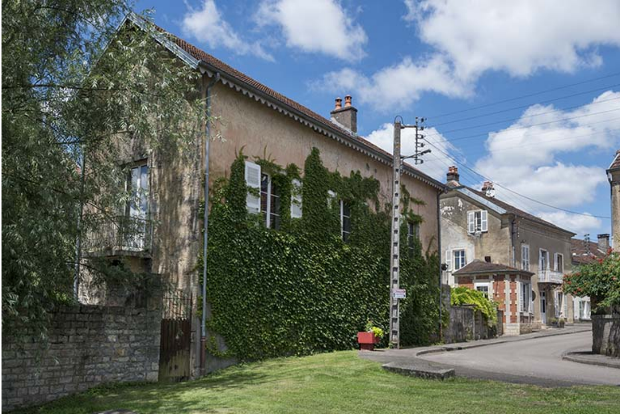
Vue d'ensemble depuis la berge de la Saône.

70, Scey-sur-Saône-et-Saint-Albin, 32 Grande Rue du Bourg