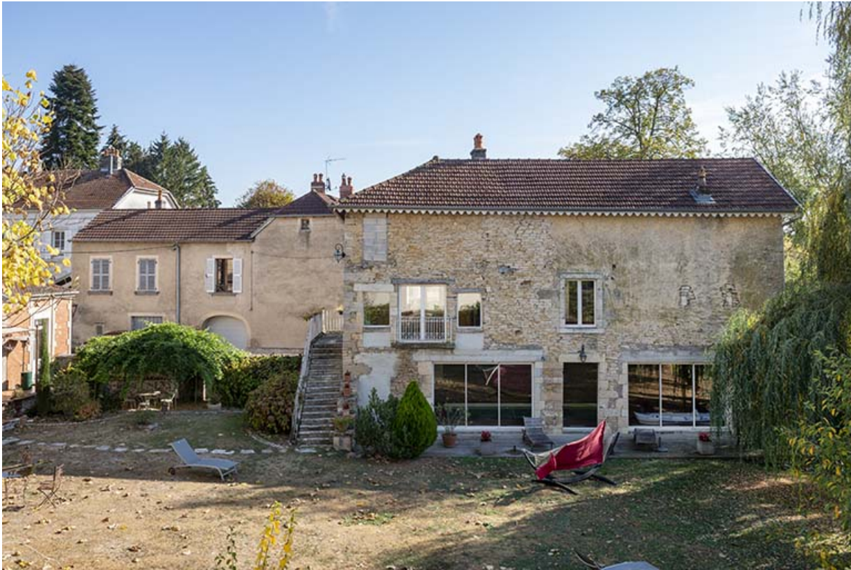
L'ancien bâtiment à usage de tannerie.

70, Scey-sur-Saône-et-Saint-Albin, 32 Grande Rue du Bourg