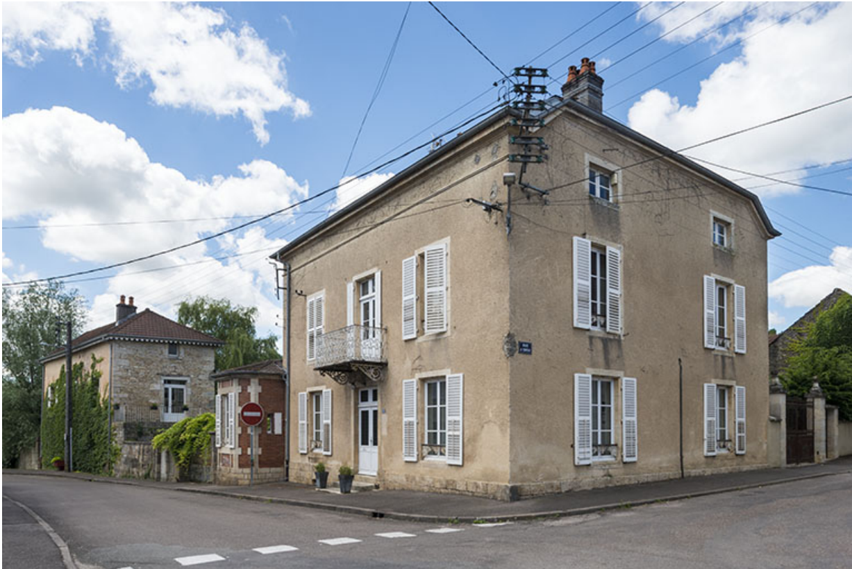
Vue d'ensemble depuis la Grande rue du Bourg.

70, Scey-sur-Saône-et-Saint-Albin, 32 Grande Rue du Bourg