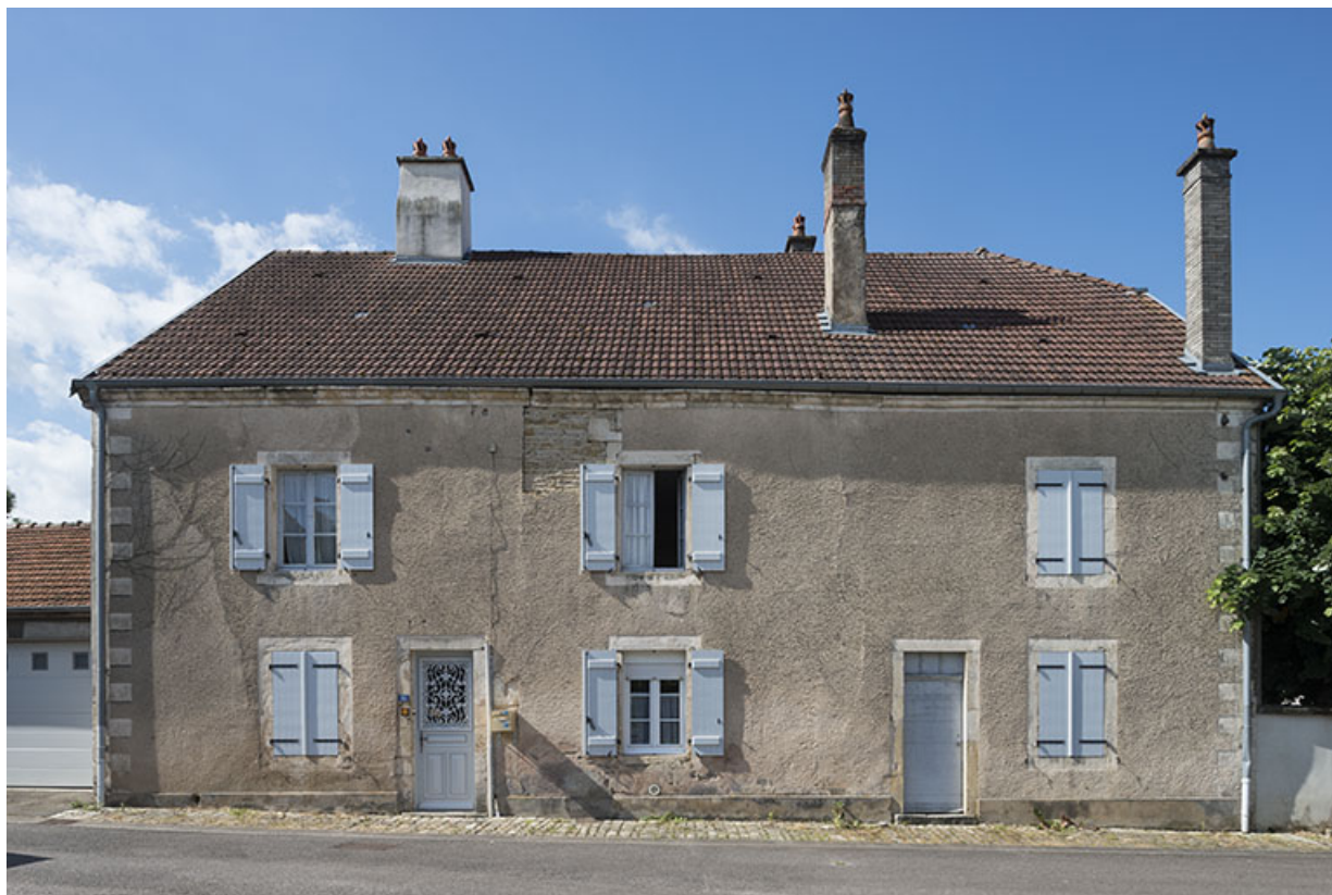
Façade antérieure de la partie de la maison , rue Mécorne.

70, Sceaux-sur-Saône-et-Saint-Albin, 10 rue Mécorne