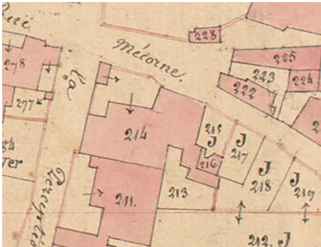
Extrait de l'Atlas parcellaire (1836) du cadastre de la commune de Sceaux-sur-Saône-et-Saint-Albin. 70, Sceaux-sur-Saône-et-Saint-Albin, 10 rue Mécorne