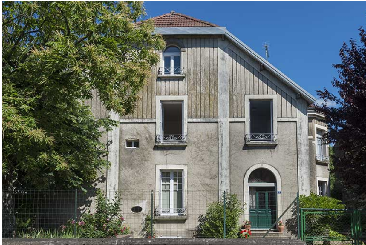
Maison côté rue de la Perception.

70, Sceaux-sur-Saône-et-Saint-Albin, 10 rue Mécorne