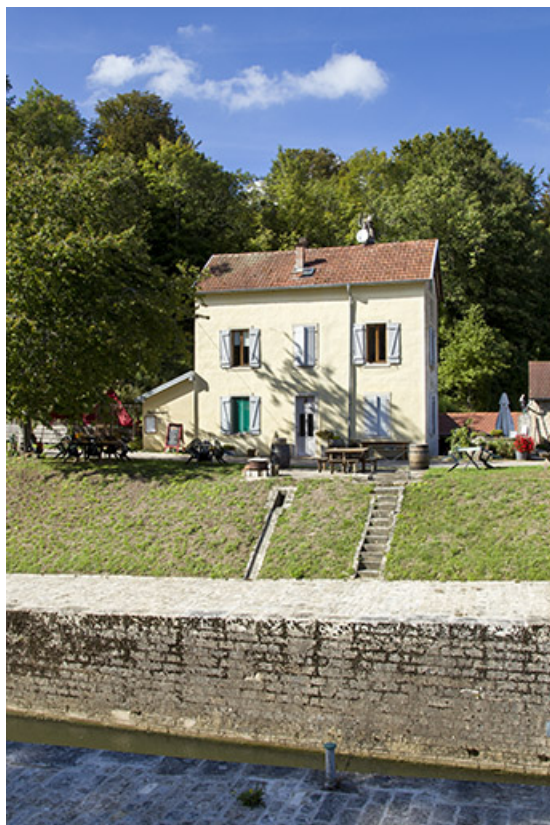
La maison du barragiste.