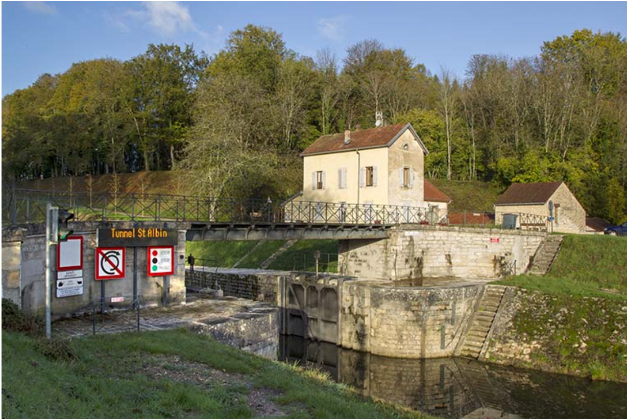
L'entrée du canal et la maison du barragiste.